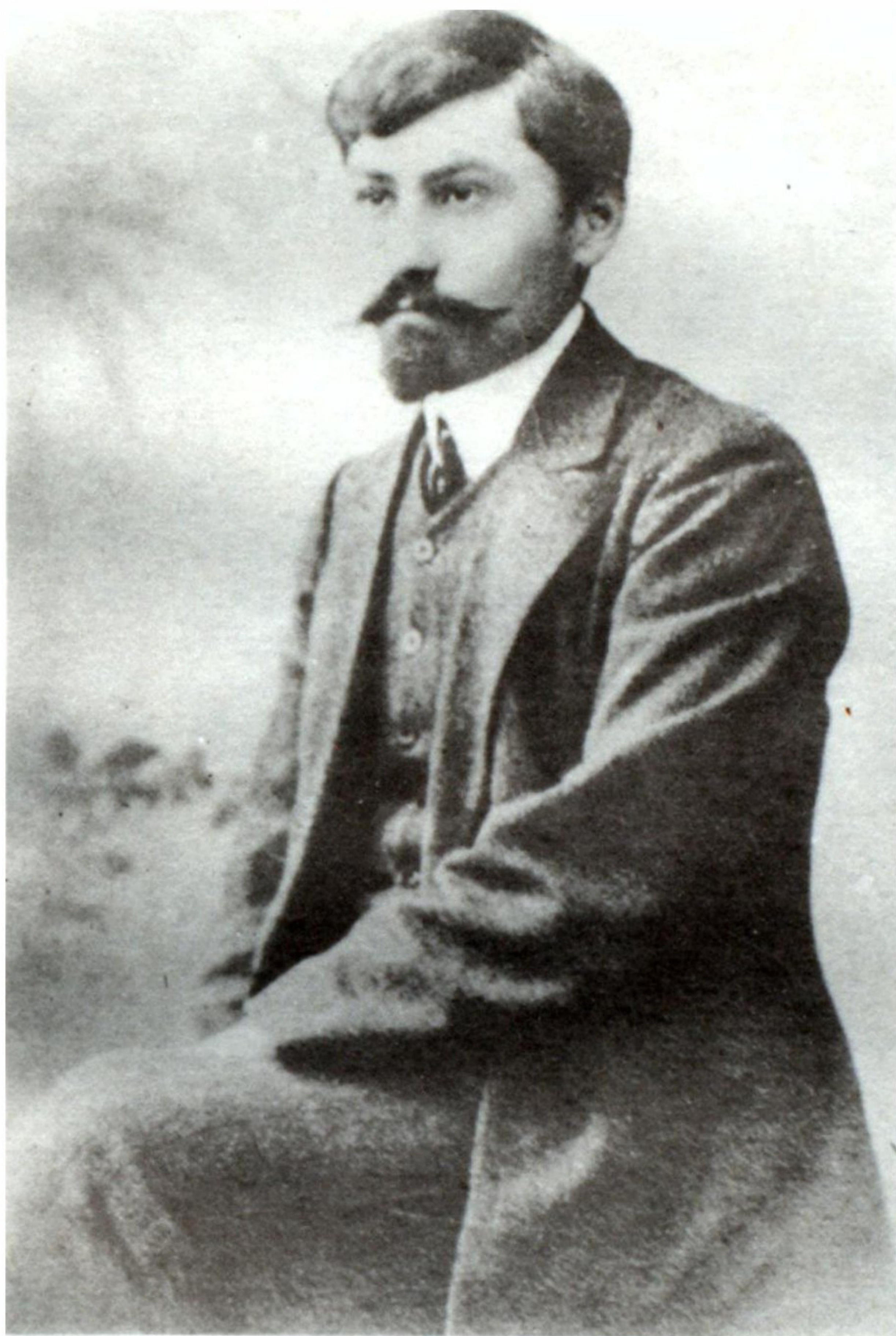
Դրոյի հայացքը... մշտապէս Արարատին սեռոված...