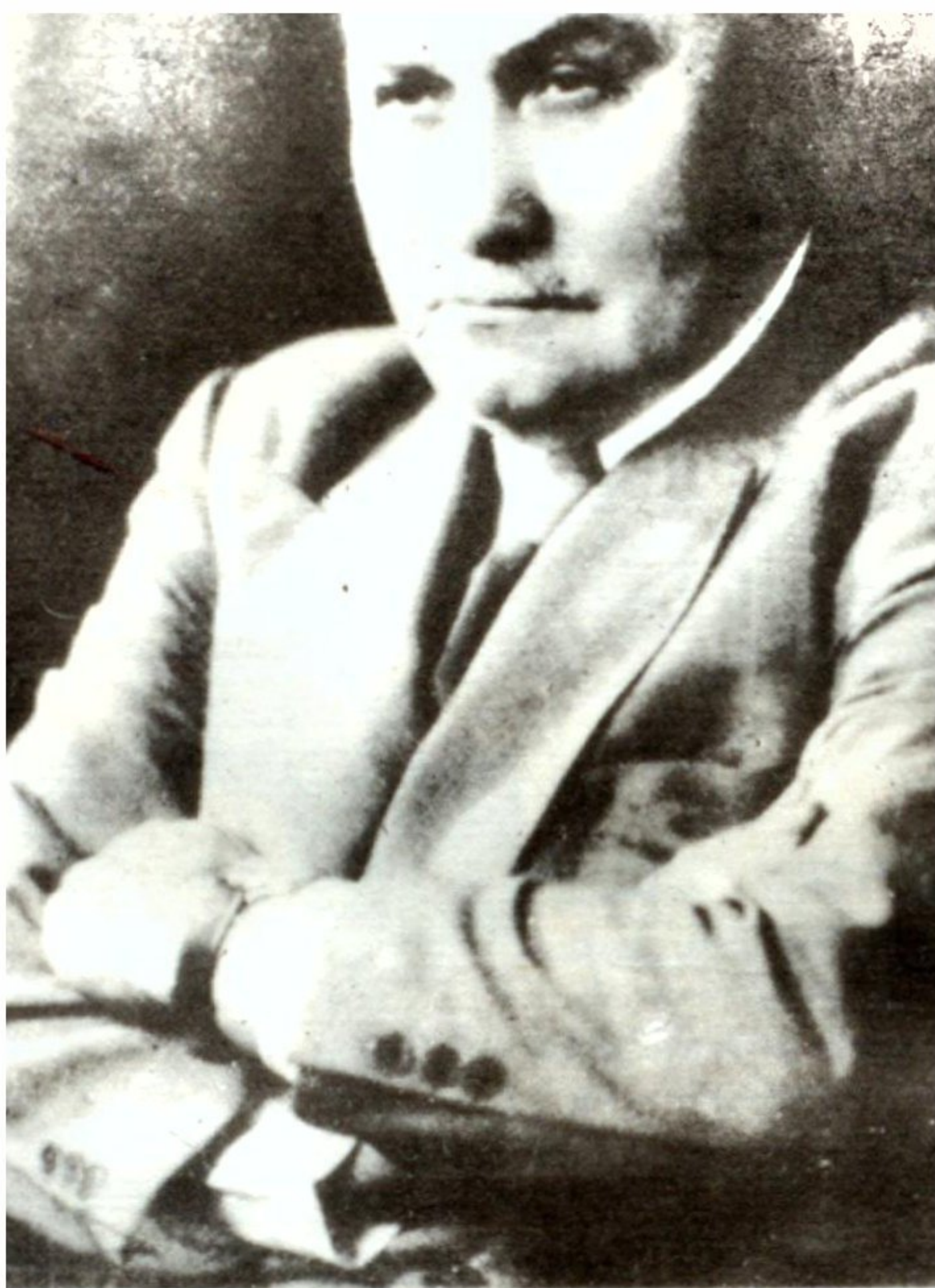
«... Ա՛խ, մեկ էլ Երկիրը տեսնեի...» (1956) Դրոյի վերջին խոսքերից