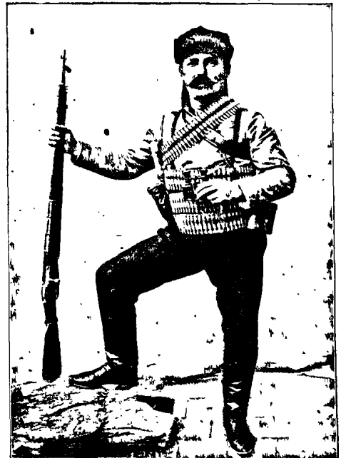
ԱՎԱՏԱԿԻԱՍ 1908 թ. ՄՈՒԺԱՄԱՐԻ ԿՈՒՆՈՄ