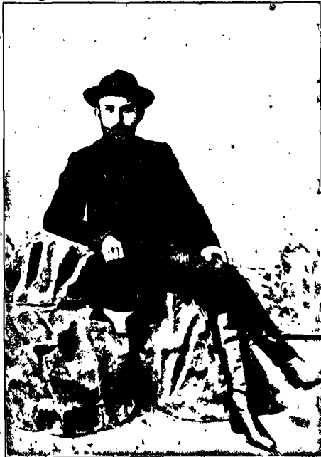
ԱՎԱՏԱԿԻԱՍ 1908 թ. ՀՈԿՏԵՄԲԵՐԻՆ-ՄՈՒԺԱՄԱՐԻ ԿՈՒՆՈՄ