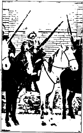
Մ Ո Ս Ս Վ

Պ մ մ ճ ա կ ա տ ա գ ի ր ը ա յ լ է ի ն մ չ է ի դ ա ա ճ ա ն ու մ, ե ս հ ա ա տ ու մ ե մ ն ր ա ն... Ընդհանուր առմամբ մի եզակի դէմք էր, թէ բնու-