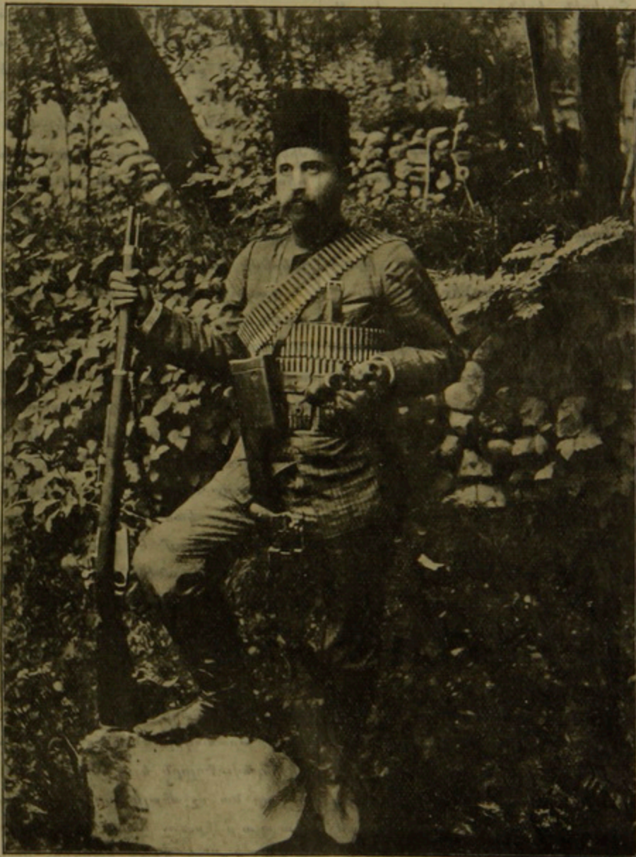
Ե Փ Ր Ե Մ