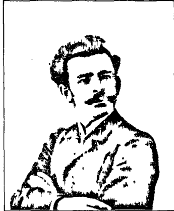
Գ ր ե գ ի ց ն ն կ ա յ ն ա ճ

Ծնուել է Կարինում իր կրթութիւնը ստացել է անգլոսոյն Ազգ. Արժեանք զպրոցումս Համեսա և ըմբոս ընտանիքի մը զուակ: 24այ Կարնոյ մէջ գործիչ ընկեր մը, որ չհանչեայ էթաէր Խնկոյնց սունը: Մեծ-