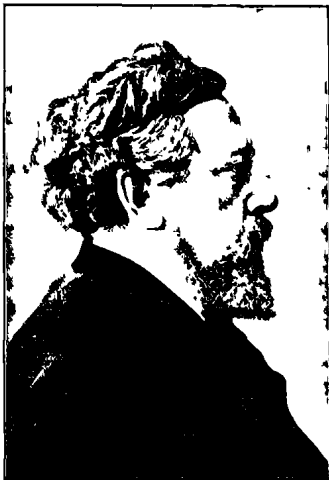
Լ Է Ք Կ Ա Ն Խ Ա

Պափով նետուեցին յորձանքի մէջ հիմնեցին անուորեք թերթեր ու ապարաններ, ոյժ տին պարլամենտական գործունեութեան իւրաքանչիւր ընտրութեանը: