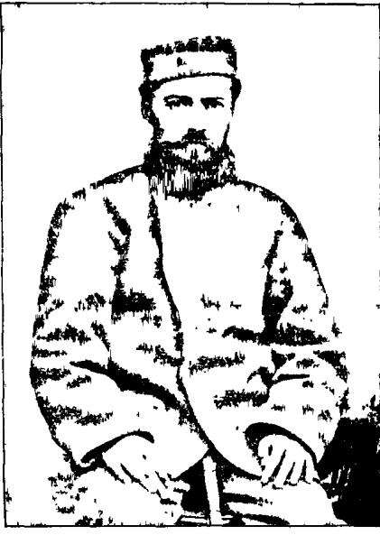
Կ ու կ ու ն ե ա մ

Աւելին չնեք գրում առ այժմ: Մի օր կը սրբի