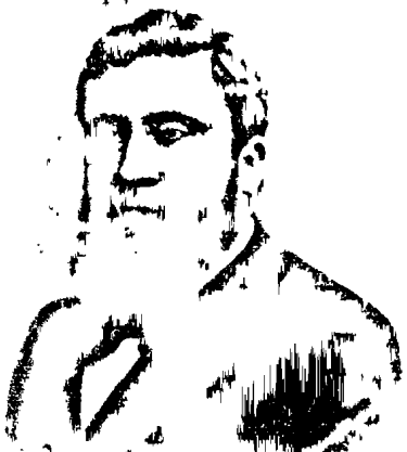
ժ Օ Ն Ա

Ժան Ժոնէսը սպանւած է: Աւելցն աշտուութիւնը սրնգահարող և շեփորող վիթխարի բարիտանը, դառար առաւ Կոնգրեսներու միթիթիների փոթորիկանոյ զօղանը... Մի բութ, գուհհիկ ոճրագործ, անտարակոյս մի վարձկան, նուցիանկիտա ու բունպարտիտա խուժանի միջազխր կամակատար, փորտող առողջ անկիւնից անկիւն, եկու վարկկնարար վերը զնելու այդ փառահեղ կենարին, որ ամբողջպէս ներուած էր Արդարութեան ու Ծարդկայնութեան գաղափարին, որ իբրեւոյսի ու ոգևորութեան մի աղբիւր էր մեզ համար, բոլոր բարստ մասնողների, բոլոր յուսահատ կուռղների համար... Ողջացրին մի մարդ, որի