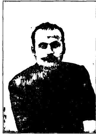
Ս ու Ր Ի Ա Ն Ա

Բագրի «կազմակերպած» պօզրօնները ծայր աւին և երևանում (1905 մայիս), իսկ երևանը փառաւոր դատուց շփացած խուժանին։ Մայիսան (22, 23, 24) երեք օրուս անընդհանուր կռիւներում զոհուած անկի ջան հարիւր թիւրք, և այդ յաղթութիւնն էր որ ստանկցեց նահանգի թիւրք հօրդաներին Բագրի կռիւները այդքան սակաւ ու այդպիսի ղեկավարութեամբ կար