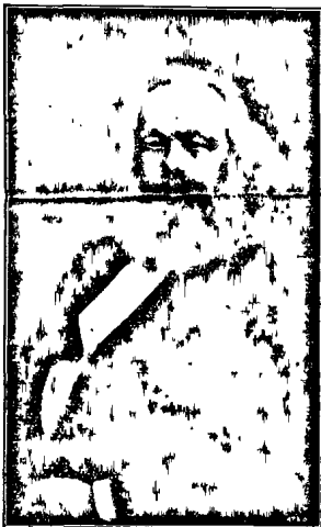
Մ ա Ր Ք ա

հիմնած Ի ն ս ե ը ն ո յ թ ո ն ա լ ի կ ո մ Միջազգային Բանտորական Գաշնակցութեան մէջ կտիւը անմիջապէս բորբորեց: Չորս տարի շարունակեց նա և ի վերջոյ 1872-ին, Կապի համագումարում ձայներէ թոյլ մե-ծածանութեամբ յնաերնացիանալը հնաւորեց իր ծոցից Բակունինին, դառնառարանելով, որ նրա անիշխանական համագումարներն ու առկտիւր չեն կարող հաշուել Մի-