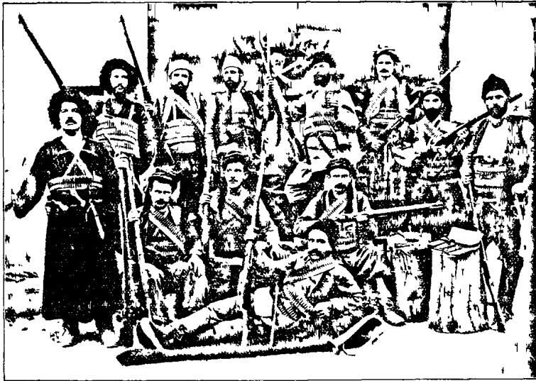
Խ Ա Ն Ա Ս Օ Ր Ի Ա Ր Շ Ա Ի Ա Խ Մ Բ Ի Ծ

պահանջի Տամեմուս այս կամ այն կետերում Տասասակում էին ճիւղեր: