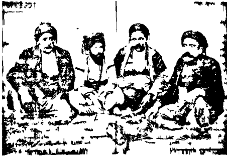
ՎԱՍԿՈՐԱՆԻԱՆ ԵՐԱՆԻ Է. Ս. Դ. ԵՐԵՎԱՆՍԻՆԸ

Յառուկ Կամբոյէ առաջին թաշկերից մէկը Ազգա- յին Քորհրդի անունից գինակոչ յայտարարեի էր: Այդ յայտարարութեան համաձայն զեկտի տակ էին կանչւում մինչև 27-28 տարեկան հասակ ունեցողները: 1914թ. յունւարի 5-ին, ճաշից յետոյ, Արամի հետ Երևանից ինքնաւարժով գուրս եկանք զԳագի Գուրգուշի՝ Մնկղեան երկնիս աշխույռ անցկացնելու հա- մար: