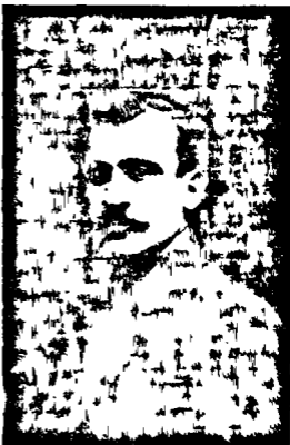
ՓԼՈՍ — ՄԱՐԱԼ (Նստնուկաւ Երարոյն սնականերն սրբին. 1915թ.)

Վրա Հասաւ Համալսարանային գտածորագր: Կոմկասահայութեան կեանքը սակն ու վրա եղաւ: Սիւակց մի շտեման եւ ու զիս: Յայակց ու կարգակերպելից կամարական շարքումը: Կարնիկեանը այց շարքումը զիստարողիցից էր: Ինչպէս և Հանդիպում Անտիք Եւրոպայումնուը, թ. Յ. Զարեանը, Արմն