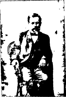
ԲՐ ՄԻՔԱՅԷԼԻԱՆ Մանուանց ինչ տառ

մանուանց որո, մեկը, մի որ պարտարութեան տանն միտան գիտարըն նարանուտի է կորիկ էր այց չորս տաները (իրենք ինքական մեկով ու մեկութեանը) կարգաւ մի Քիւրքի վրա, մանկէն էր կարում սեղը