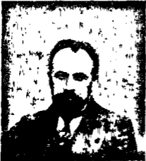
Ք Ո Ս Տ Ո Մ

Մտախոս փառայի, Տէր Լուկասովի, Լորիս Մեղիքովի անունները կ'արտասանուէին անեն կողմ, կ'եր-