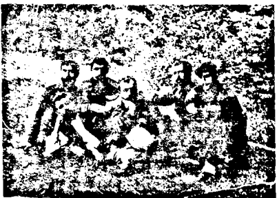
Պատկը՝ ԽԱՅՈ անք յնան ԵՐԵՎԱՆ ԿԱՊՍ, որի յունկչ-ՆԵՆԱԿՈՒՅՆՆ ԵՆՅՈ, ԿԵՍ, այ կարճ Ետան փերի՛ն ԵՆՅՈ և ԿԱՐԱԿՈՒՅՆ ԶՈՐՈՒՆԵՆԵՆ:

րան կը լինէր, եթէ շրջապատիցները նայ յունկէին նրա մասին: Արամին ժառ նանաչեւոյ յետոյ մարդ ստորագրում է, թէ ո՛վ է նրան տակ փաշա տխարո- սը: Մի կատարեալ թիւթեմայութիւն է, գանն, ուս- աւանդաբն նանդապաշտութեամբ, նրա ընաւորութեան ձեզ փաշաչական ու՛րէն չկար: Եւ ինքը ինչպէ՛ս էր խորում, երբ նրան սփաշառ էին անանում: