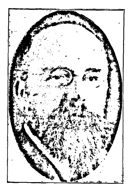
ԼՈՒԻ ՏԸ ՊՐՈՒՔԵՐ

2 · Ճարտարարւեստի մեքենականացումը կամ ամե– րիկանացումը, բանւորը կր վերածէ՝ մեքենայի գայն