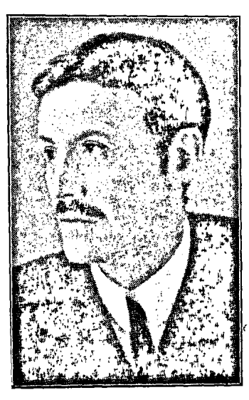
የፅሀፕ ዓይሀገዮ ፌኒስጸተሳ ብ

Ծանկ-Քանթաօ չին երիտասարդ պատդամաշորը, որ բեմ կուդայ Պրքըսթընկն յետոյ, Վամագումարին իանդավառ ծափերուն կարժանանայ։ Յուգւած՝ ան կը սկսի չեչտելով իր մեծ ու անընկնելի հաւատքը, որ ունի չին աշխատաւոր ժողովրդի մօտալուտ ազատա-