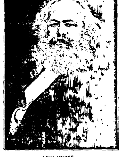
ԿԱՐԼ–ՄԱՐՔՍ (Գիտական ընկերվարութեան հիմնադիրը)

նահանդային, համայնչային վարչութեան նախադահներ, մեծ ելևմտագէտներ և տնտեսագէտներ, սկսելով գերման Նաֆթալիէն մինչև ֆրանսացի Կասթոն-Լէվին, Ազգերու Դաչնակցութեան մօտ նախկին կամ արդի պատւիրակներ՝ Պրայթշայտէն մինչև Տը-Պրուքէր և Վանտերվելտ, կուսակցութեան պետեր, տեսաբաններ, գործիչներ, մեծ մասով հեղինակաւոր դէմբեր։