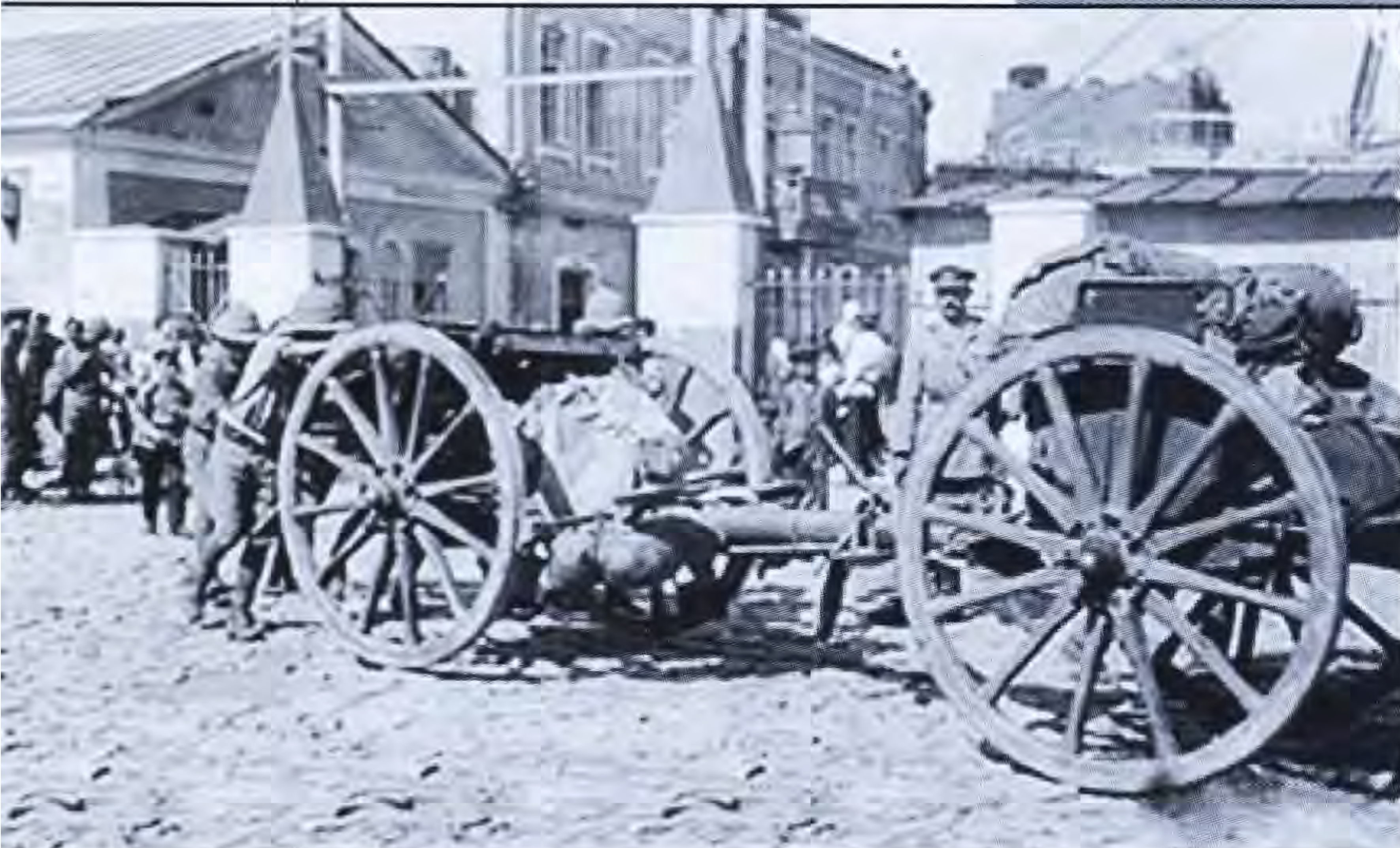
Բրիտանական բանակը, Բաֆու, 1918 թ.

պատված էր թշնամիներով, մինչև այժմ ենթարկվում էր երեք պետությունների՝ Թուրքիային, Ռուսաստանին, Պարսկաստանին, որոնք և բաժանել էին իրար մեջ երկիրը՝ ունենալով կառավարական, վարչական, գերիշխանական, քաղաքակրթական խորապես տարբեր համակարգեր: