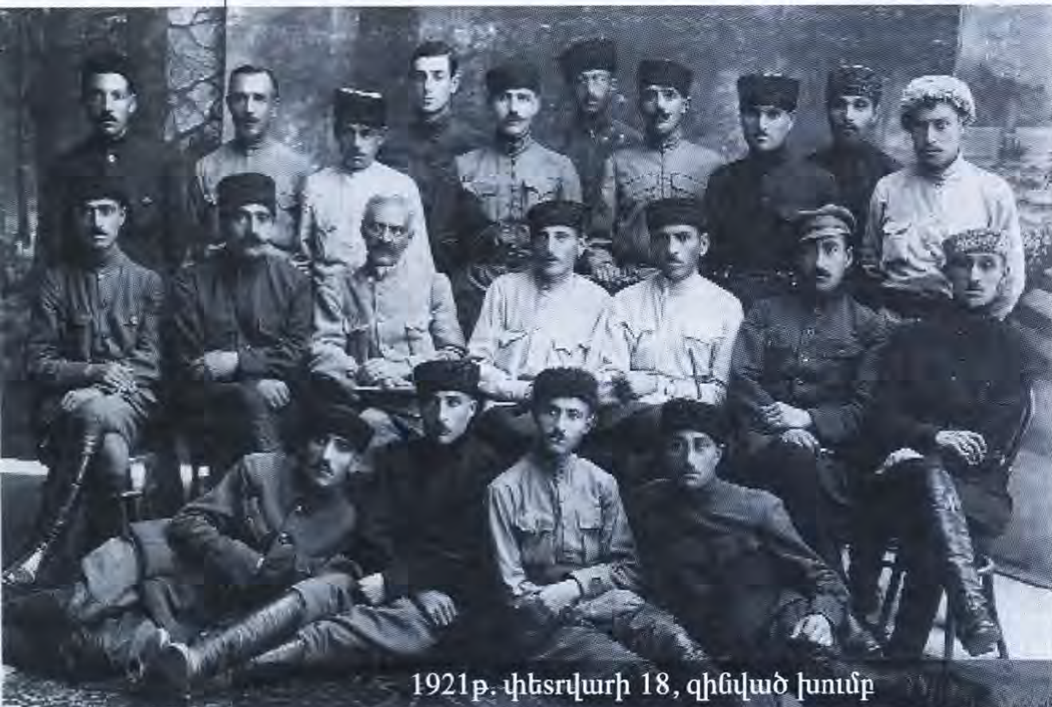
1921 թ. փետրվարի 18, զինված խումբ

Նոր իշխանությունը անմիջապես չեղյալ հայտարարեց նախնական պայմանավորվածությունը (որն, ի դեպ, ամրագրված էր պայմանագրով) և սկսեց վարել անհեռատես քաղաքականություն ու դրսևորել օտար նվաճողին վայել վարքագիծ: Նախ, անտեսելով պայմանագրի այն կետերը, որոնցով երաշխավորվում էին ՀՀ Կառավարության անդամների, ՀՅԴ գործիչների, մտավորականության, ՀՀ բանակի սպաների և այն անձանց անվտանգությունն ու հայրենիքում ազատ ապրելու հնարավորությունը, որոնք մինչ այդ պայքարել էին Հայաստանի անկախության համար: Հեղկոմն (Ս. Լուկաշին, Ավիս Նուրիջանյան, Ա. Մռավյան և այլք) ու մյուս բոլշևիկյան գործիչները, իրենց հետ Հայաստան եկած ռուսական բանակի աջակցությամբ, սկսեցին համատարած