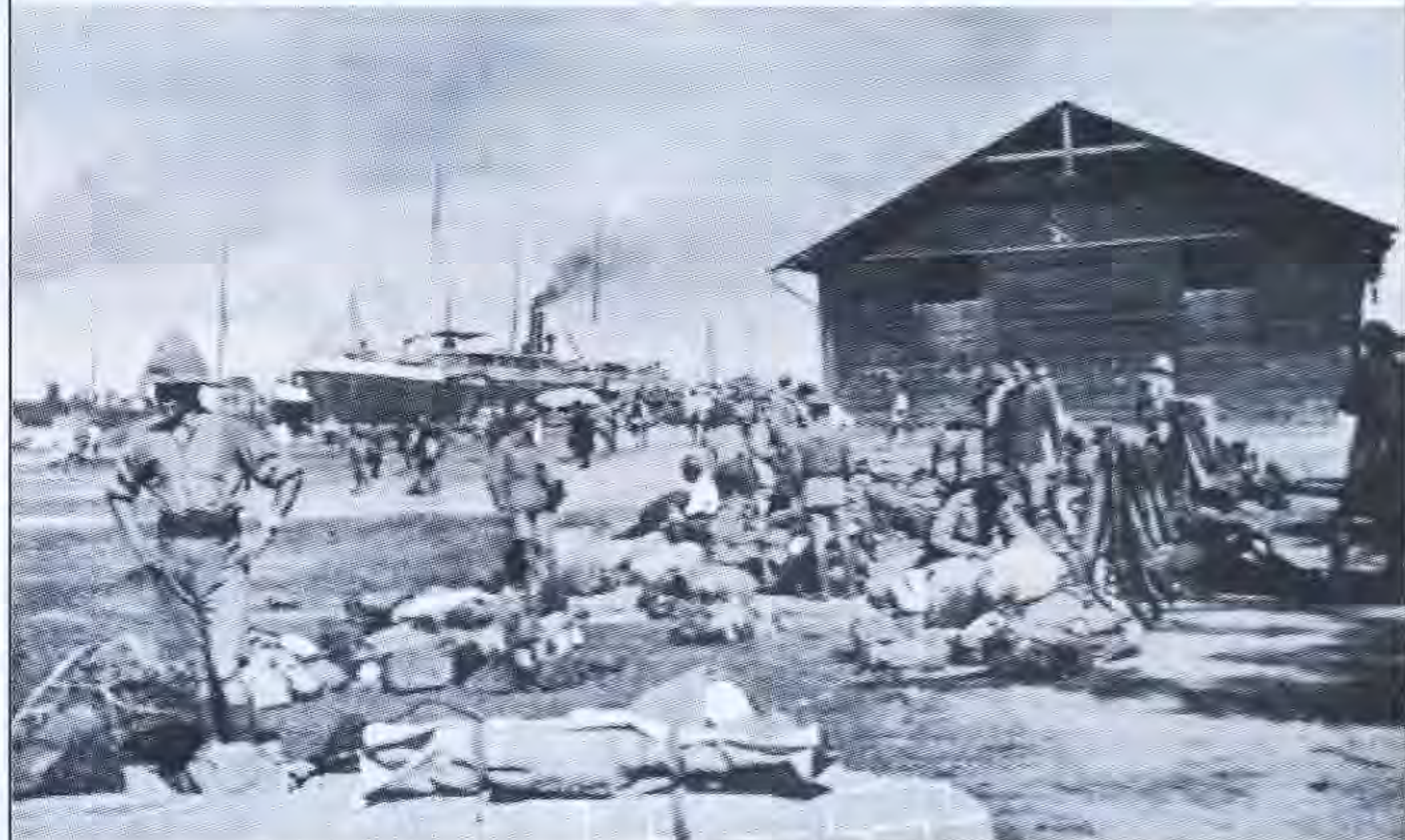
«Վարվիկեայր» գորամիավորի 39-րդ բրիգադը Անգալիում, Բաքվից արհամիվելուց հետո:

Ինչ խոսք, ուժերի անհավասարությունն այն միակ պատճառն էր ու հավաստի պատճառաբանությունը, որը «Դյունստերֆորսի» 6 պարտության պատճառը դարձավ: Չորաբանակը ձախողվեց ոչ միայն Բաքվում, այլև մյուս ծրագրերն