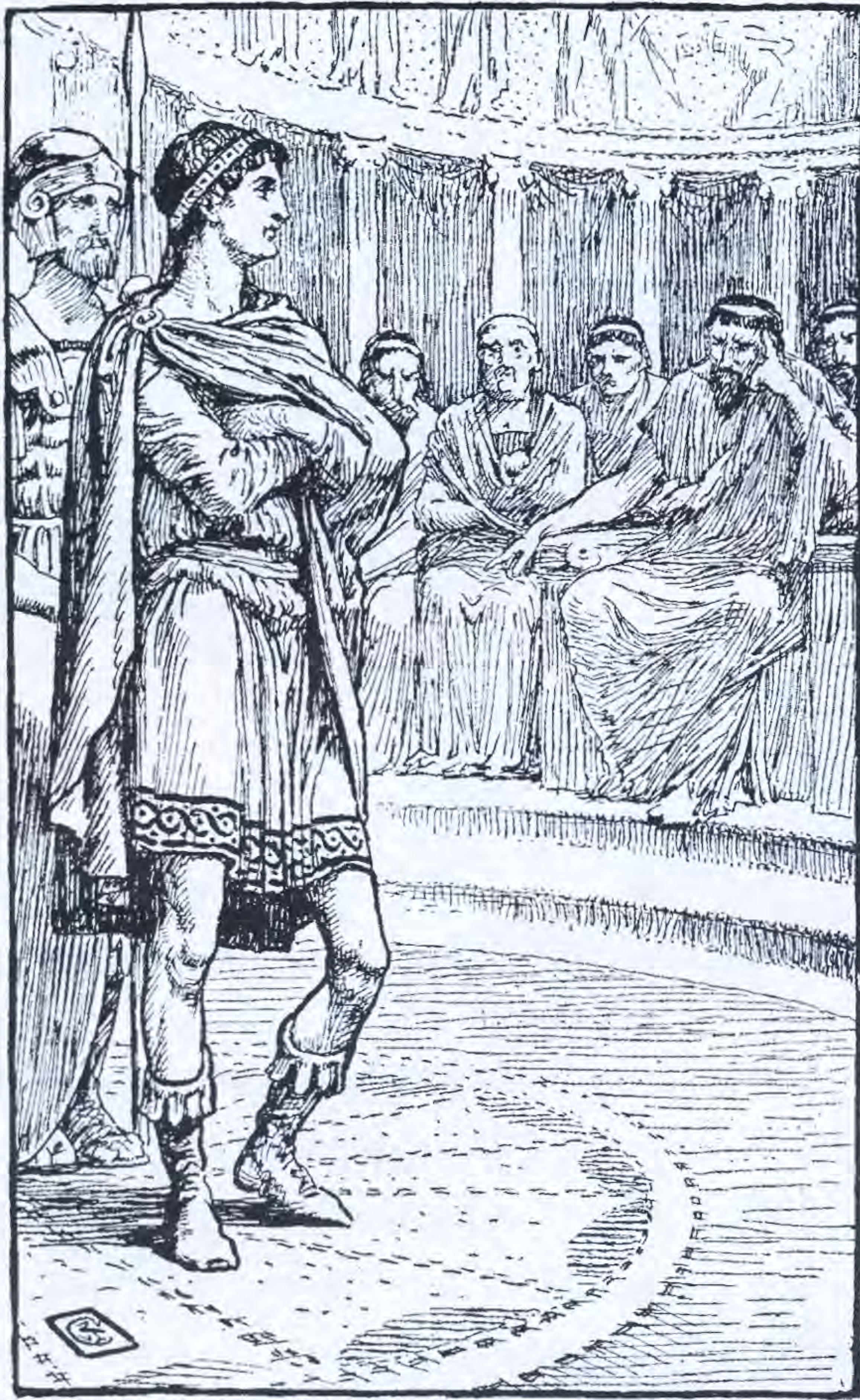
THE DOOM OF AGIS KING OF SPARTA

ներ հարաբերությունները՝ կարևոր որոշումներ կայացնելու գործընթացում. «Մենք չենք կարծում, որ բաց քննարկումը կարող է վնասել պետական գործերի ընթացքին: Ընդհակառակը, մենք համոզված ենք, որ սխալ է պետք եղած որոշումն ընդունել առանց կողմ կամ դեմ ելույթների միջոցով նախնական պատրաստության: Ի տարբերություն ուրիշների, մենք՝ ունենալով քաջություն, նախընտրում ենք դրա հետ միասին նախապես հիմնավոր քննել մեր ծրագրերը, որից հետո միայն գործի դիմել: Մյուսների մեջ անհարգալից սահմանափակությունը ծնում է անհաշվենկատ քաջություն, իսկ սթափ հաշվարկը՝ անվճռականություն: Իսկապես քաջ պետք է համարել միայն նրանց, ովքեր ամբողջական պատկերացում ունեն ինչպես պարտության, այնպես էլ հաղթանակի մասին, և հենց այդ պատճառով էլ չեն խուսափում վտանգներից»: