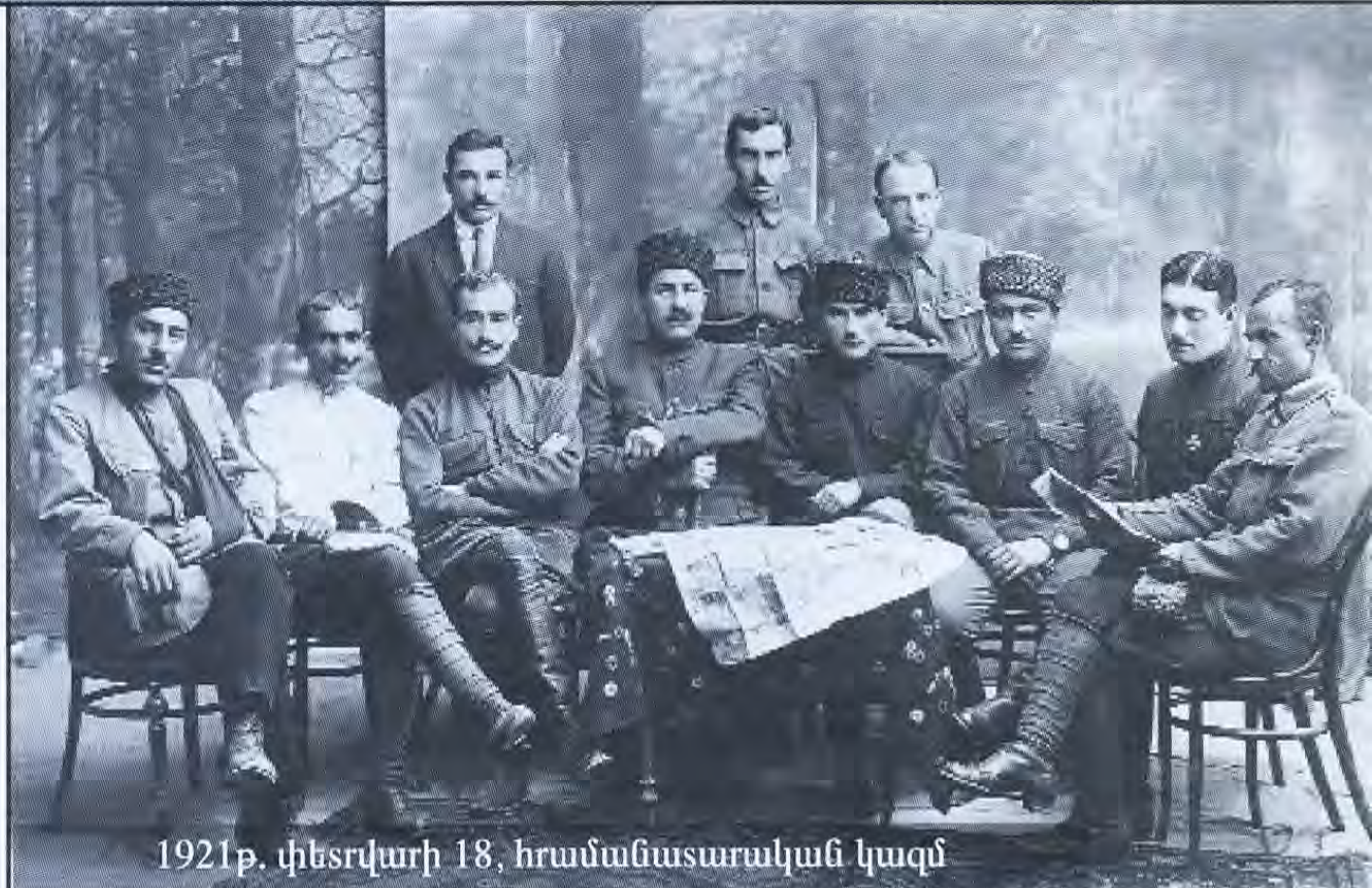
1921թ. փետրվարի 18, հրամանատարական կազմ

Ձերբակալվեցին ու բանտ նետվեցին, Հայաստանից չհեռացած պետական ու կուսակցական գործիչները: ՀՀ բանակի մոտ 1500 սպա արքայվեց Բաքու և Ռուսաստան: Ամենաանցանկալի պատրվակներով, մատնությամբ, բանտերն էին նետվում տարբեր խավերի ներկայացուցիչներ (բանվորներ, գյուղացիներ, հասարակ ծառայողներ և այլն)... Նորընծա ղեկավարներն ու նրանց հետ եկածները, անպայմանորեն, բռնագրավում ու տեղավորվում էին նախկին գործիչների և մտավորականության բնակարաններում, յուրացնում պետական հիմնարկների գույքը՝ անձնական օգտագործման նպատակով: Ռուսական բանակի զինվորներին տեղավորեցին ոչ թե զորանոցներում՝ հայ զինվորների հետ, այլ քաղաքացիների տներում, որոնք պարտավոր էին նրանց կերակրել, հագցնել, հոգալ նրանց կարիքները: Թալանում ու բռնագրավում էին ոչ միայն բնակչության տներն ու ունեցվածքը, այլև պահեստները, նույնիսկ որբանոցների ու հիվանդանոցների ունեցվածքը (պարեն, դեղորայք և այլն): Ավելի