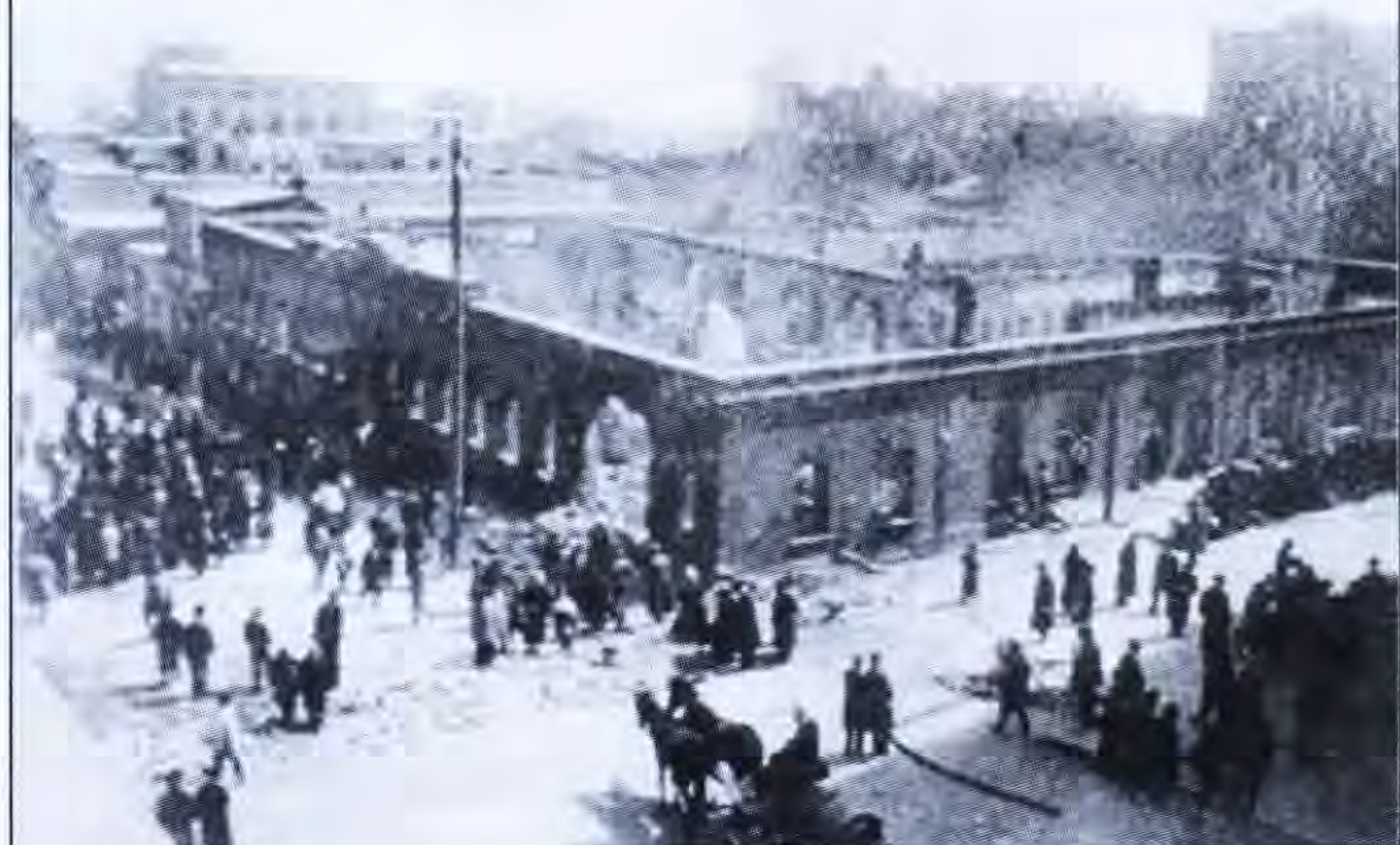
Բաքու, 1919 թ.

կանիչները, որ սիրով ենք դրվատում մեծաթիվ ազգերի վարքագծում, առավել ևս չպետք է մոռանանք, որ նրանք փոքրաթիվ ժողովուրդ են, մի պետությունում համախմբված չեն, հետևաբար չի եղել համահայկական հեղինակություն, իշխանություն, կենտրոնական կառավարություն: Դիշտ հակառակը՝ հայկական տարբեր համայնքներ ապրում են տարբեր, մեծ մասամբ թըշնամի ժողովուրդների, ցեղերի միջավայրում, միմյանցից հաճախ չափազանց հեռու, գրեթե առանց հաղորդակցության հնարավորության, ուստի կանոնավոր հարաբերություններ հաստատել չեն կարողանում, այսինքն նպատակային համագործակցության չեն հասնում, որին անպայման կհասնեին, եթե համախմբված լինեին նույն պետությունում, ապրեին նույն վարչակարգում: Պետք չէ մոռանալ նաև, որ այս ժողովուրդը, որ առանց այն էլ աշխարհով մեկ ցրված ու շրջա-