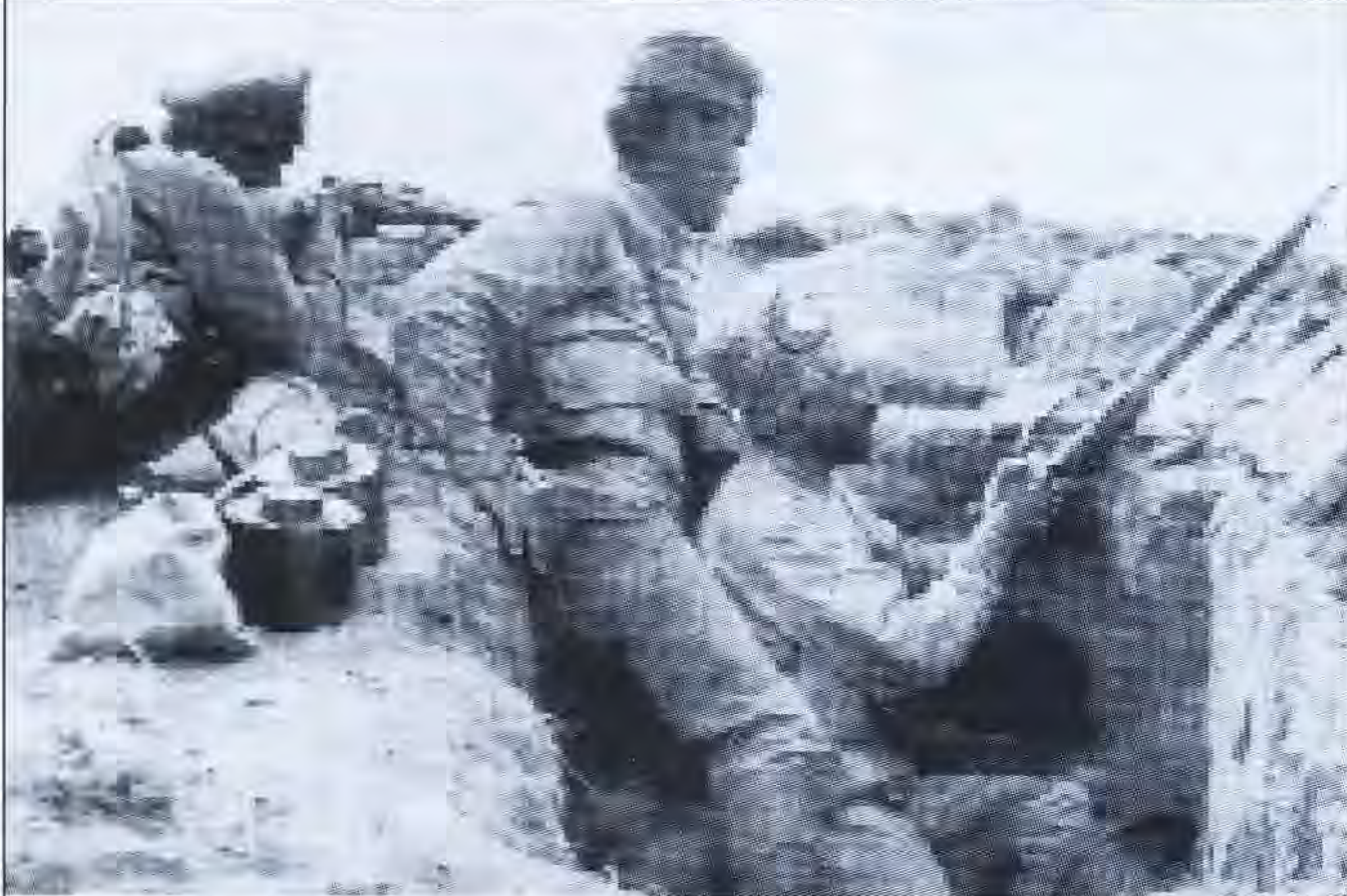
Բաքվի ինֆնադաճեցմանության հայ զինվորները

դեցություն ունեին: Շատերը քաշվել էին Բաքվի մերձակա թաթարական գյուղերը, այնտեղից կապ էին հաստատում թուրքերի հետ: