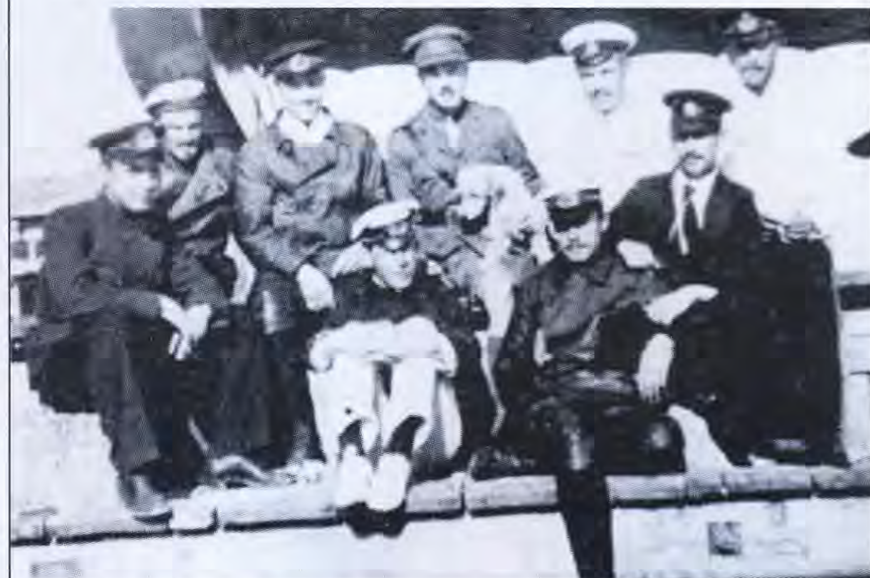
Ռուսական ռազմածովայինները, Բաֆու, 1917-18 թթ.:

Հրեաները, չնայած համեմատաբար փոքրաթիվ էին, իրենց հարստությամբ ու դիրքով մեծ ազ-