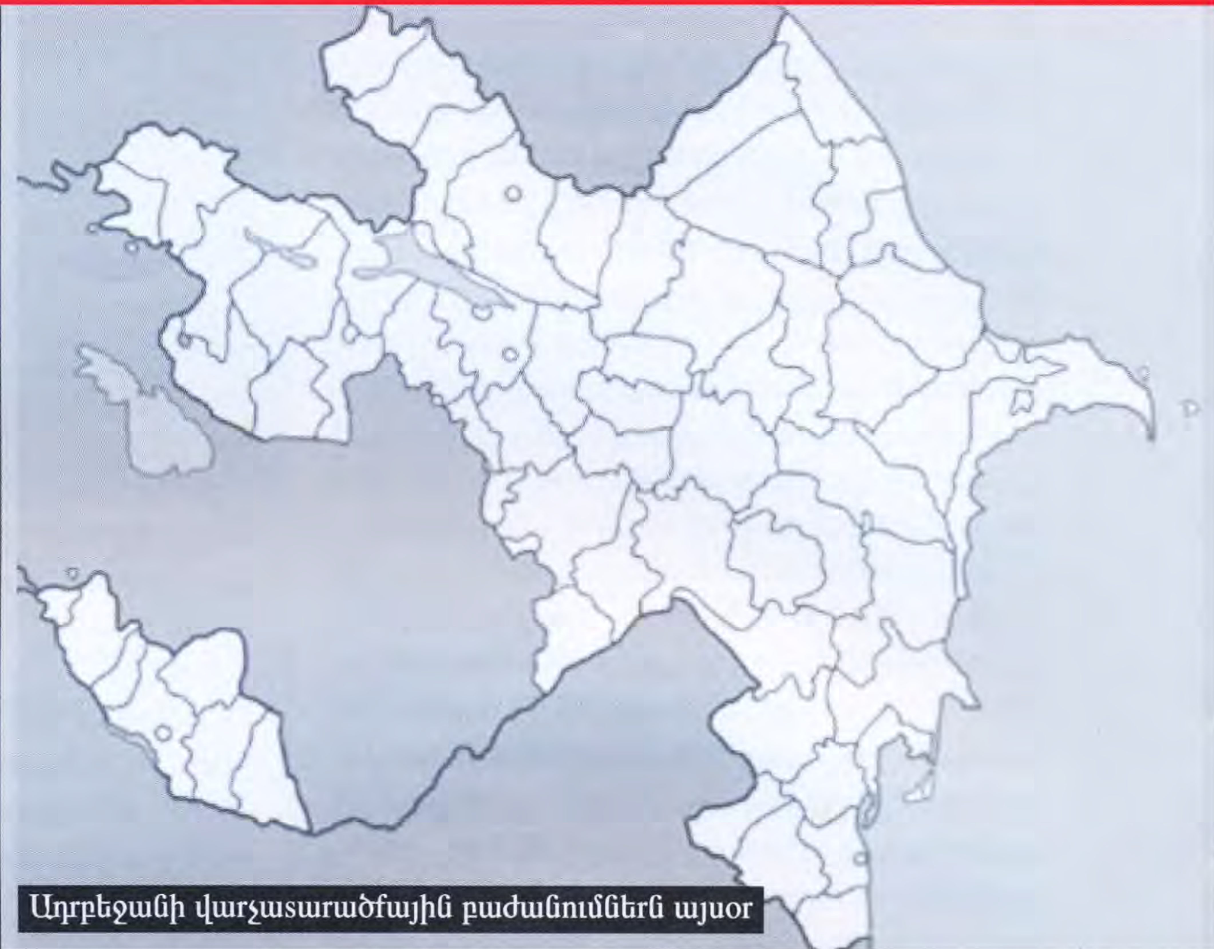
Ադրբեջանի վարչատարածքային բաժանումներն այսօր

Չնայած իր գեոռազմավարական կարևորությանը, Ադրբեջանը հանդիսանում է մոնոարտադրական ուղղվածություն ունեցող թույլ սնեստությամբ, եկամուտների անհամաչափ բաշխում ունեցող, ուժեղ կոռումպացված ղեկավարություն: Ադրբեջանը դեռևս չունի կայացած հասարակություն, առկա են էթնի-