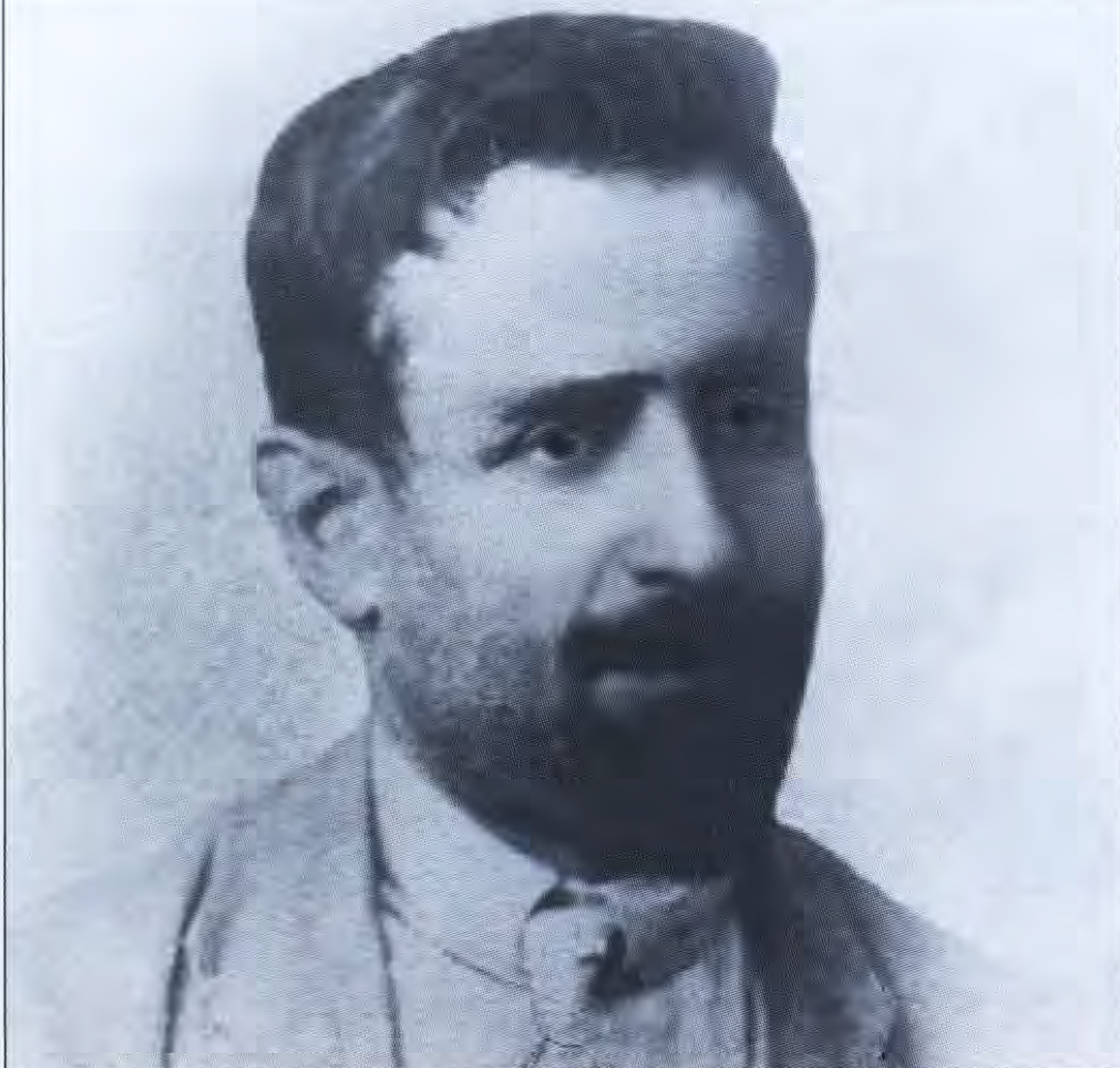
Տիգրան Ծամհուր, ՀՀ Խորհրդարանի լիազորված անդամ: Չնկվել է 1921 թ. փետրվար 18-ին, Խորհրդարանի ժողովի վրա ազգային եռագույնը բարձրացնելու դրամին:

Էին ազատ խոսքն ու մամուլը, բոլոր տեսակի հավաքները, բացի բոլշևիկյան մամուլից ու ժողովներից: