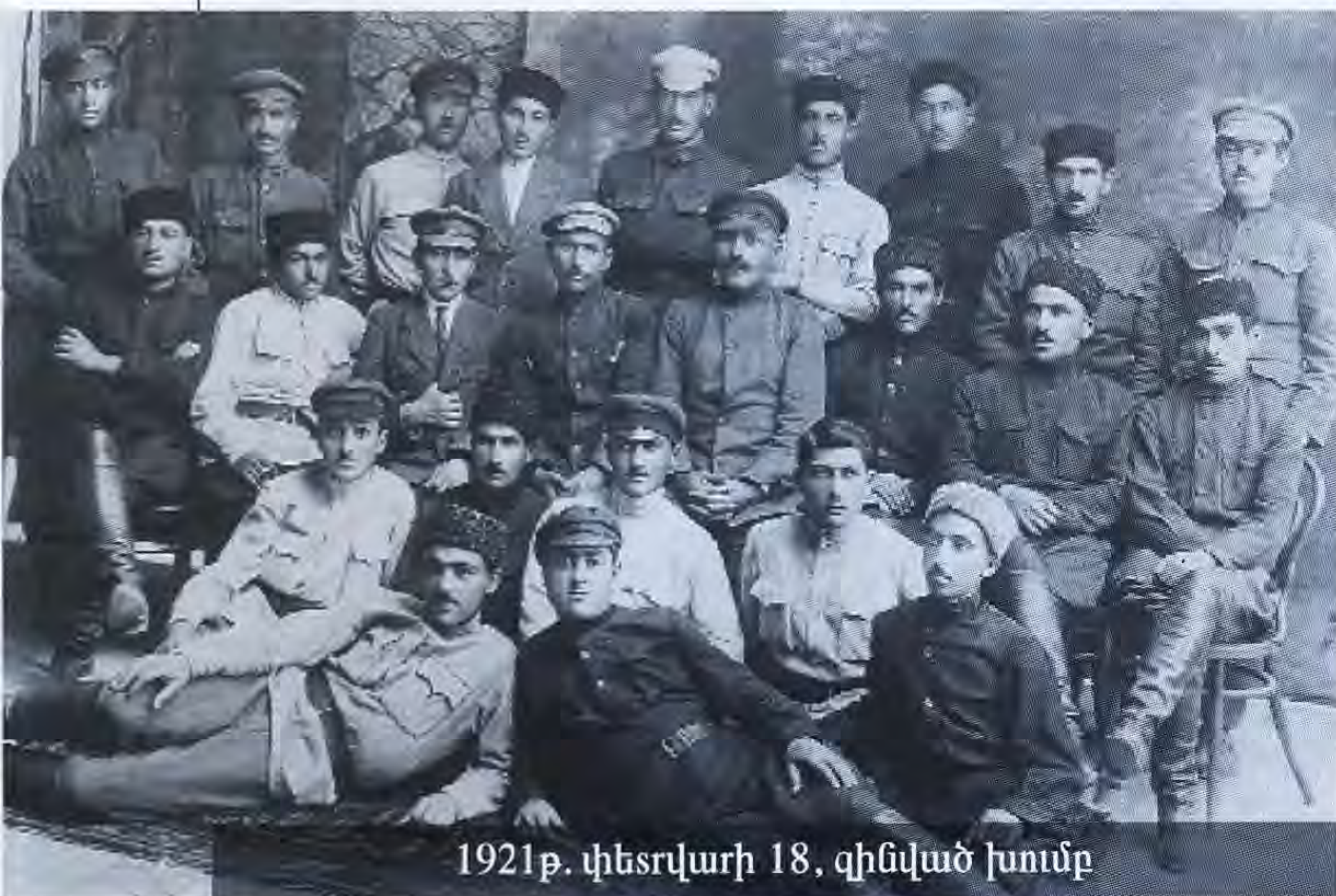
1921թ. փետրվարի 18, զինված խումբ

Երկիրը մատնվում էր համատարած սովի ու հուսահատության: Բանտերում այլևս տեղ չկար: Բանտարկված էին հայտնի, ականավոր գործիչներից մինչև մատնության ու գրպարտության զոհ դարձած սովորական մարդիկ: Ուռնահարվում էին մարդկային բոլոր իրավունքները, արգելվել