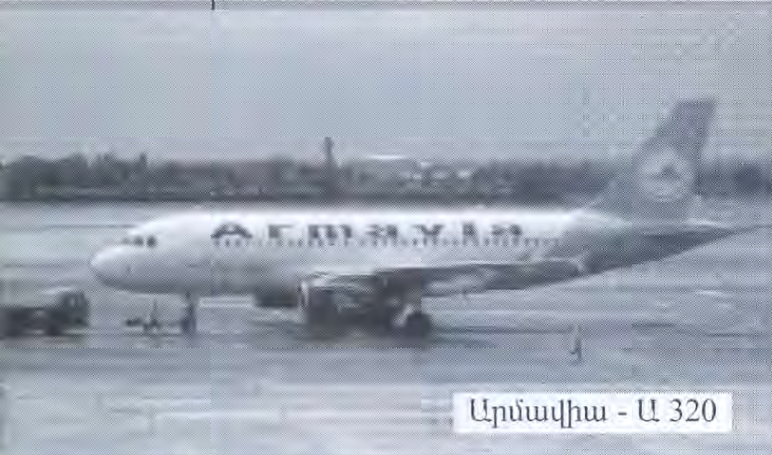
Արմավիա - Ա 320

Պատմությանը հայտնի են մի քանի դեպքեր, երբ տրանսպորտային ավիացիան որոշիչ դեր է խաղացել այս կամ այն