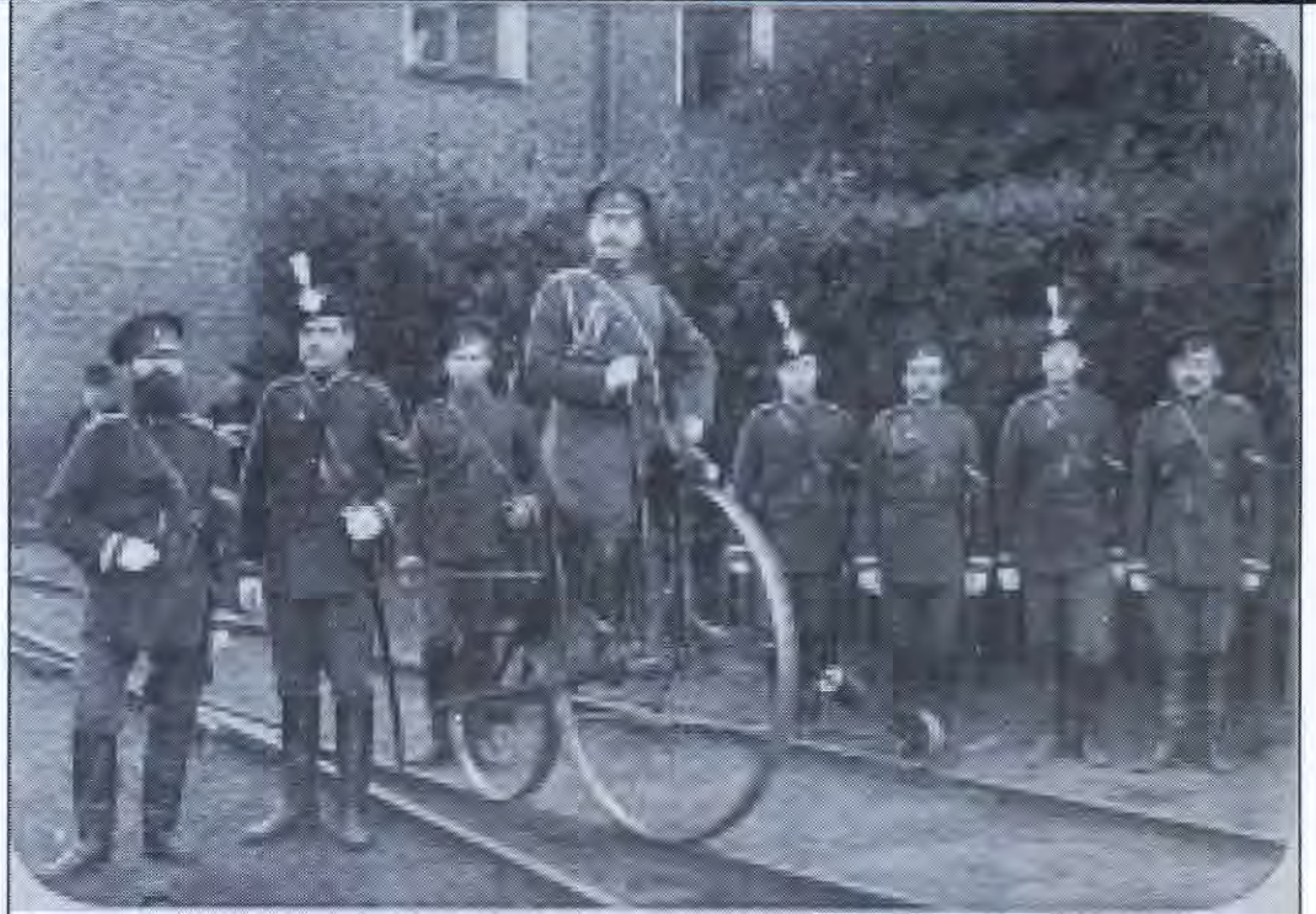
Ռուս ժանդարմներ, 1890թ.

Նա, որպես սկիզբ, որոշեց բացահայտել Ավանեսով ազգանունով մի հայի ինքնությունը, որն ատաղձագործ էր, ապրում էր Ռոստո- վից ոչ հեռու՝ Նախիջևանում: Ու քանի որ ինքն էլ մի փոքր խառատ էր, աշխատանք ստանալու պատրվակով ներկայացել էր Ավանեսովին՝ վարձատրության փոխարեն միայն ուտելիք ու քնելու անկյուն խնդրել: Ավանեսովը, սակայն, նույնիսկ նման բացա- ռիկ պայմաններով, նրան աշխատանքի չի վերցնում, որից և Սալտոն եզրակացնում է՝ արհեստանոցում օտար մարդն անցանկալի է: Մինչդեռ ակնհայտ էր, որ գործ շատ ուներ: Սալտոն իսկույն փոխում է մարտավարությու- նը, ասում է, որ քաղաքական գործիչ է, ոստի- կանությունը հետապնդում է իրեն, ինքը կեղ- ծանունով է ապրում ու շատ է խնդրում չմեր- ժել: Որպես ասածի ապացույց նա Ավանեսո- վին է մեկնում ընկերվար- հեղափոխականնե- րի կազմակերպությունից կորզած վկայագի- րը: Ատաղձագործն իսկույն որոշումը փոխում, ընդունում է Սալտոյին: Վերջինս այնպիսի եռանդով է գործի կաշում, որ արժանանում է վարպետի դրվատանքին: Ու քանի որ Սալ- տոն ոչ միայն բանվոր էր, այլ նաև ընդհա- տակյա գործիչ, մոր կողմից էլ հայ, Ավանեսո- վը ամեն երեկո հետը տանում է գարեջրա- տուն, որտեղ քաղաքական բուռն խոսակցու- թյուններ էին ծավալվում: Հետզհետե վարպե- տը Սալտոյին վստահում, բացվում, ասում է, որ ինքը պատահական մարդ չէ, այլ հայկա-