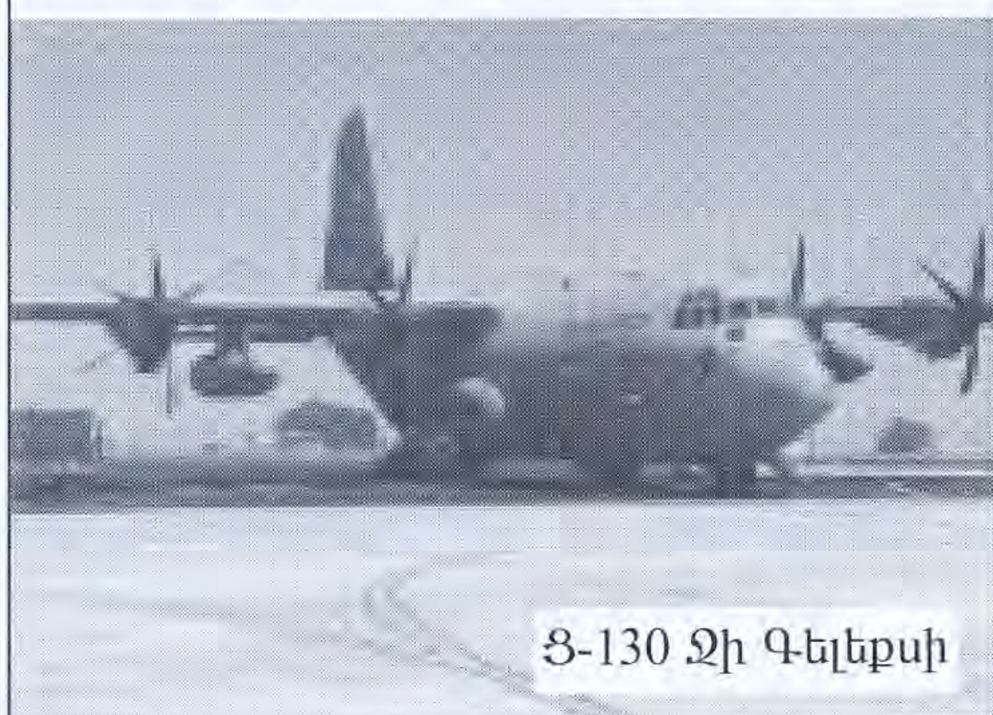
Ց-130 Ձի Գելեքսի

Առաջին պատճառը հենց բեռնափոխադրումների ծավալների աճն է, որը պատերազմի ժամանակ կարող է ընդունել աննախա-