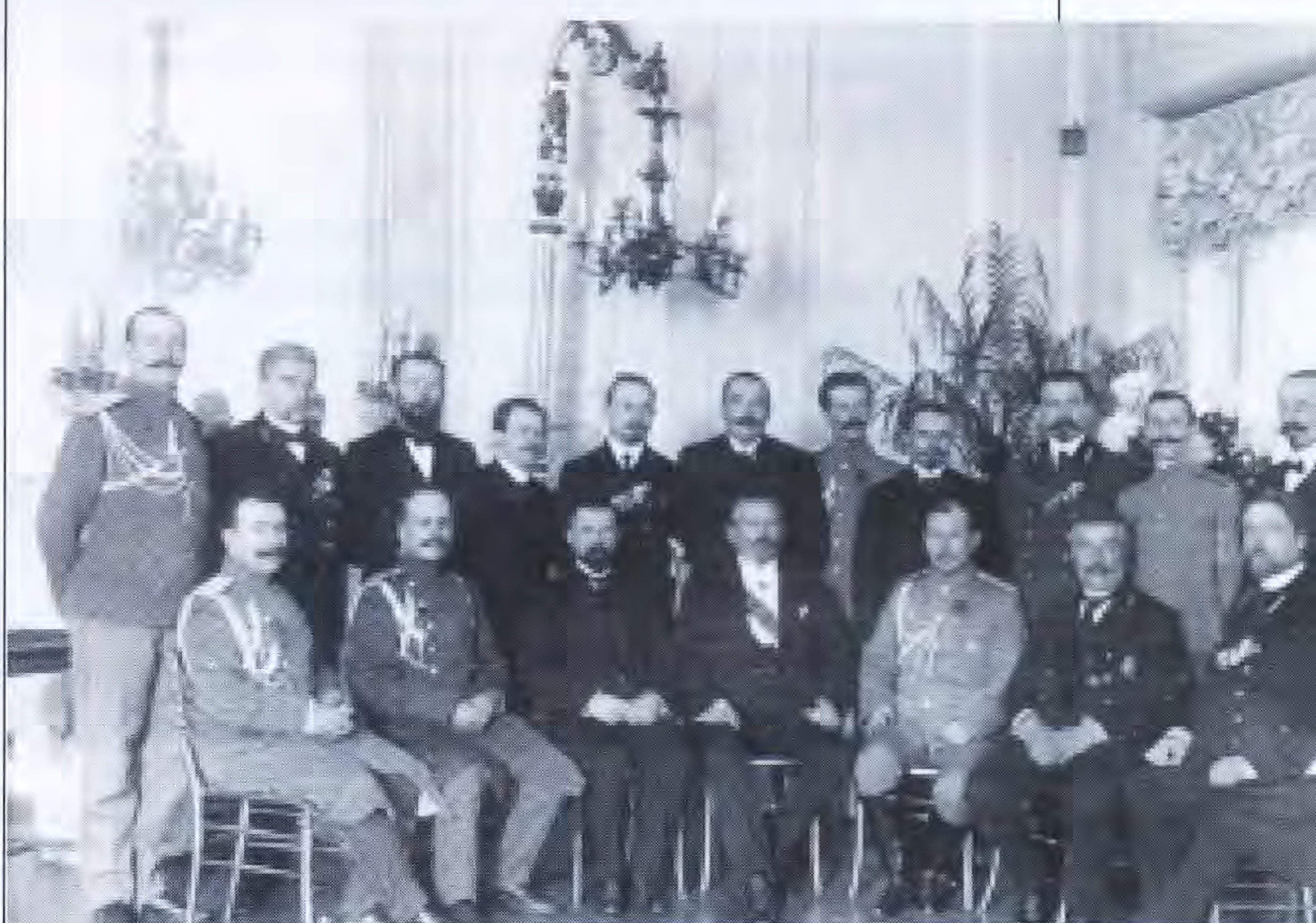
Յարական Օխրանկայի ղեկեր, Պեներբուրգ, 1905թ.