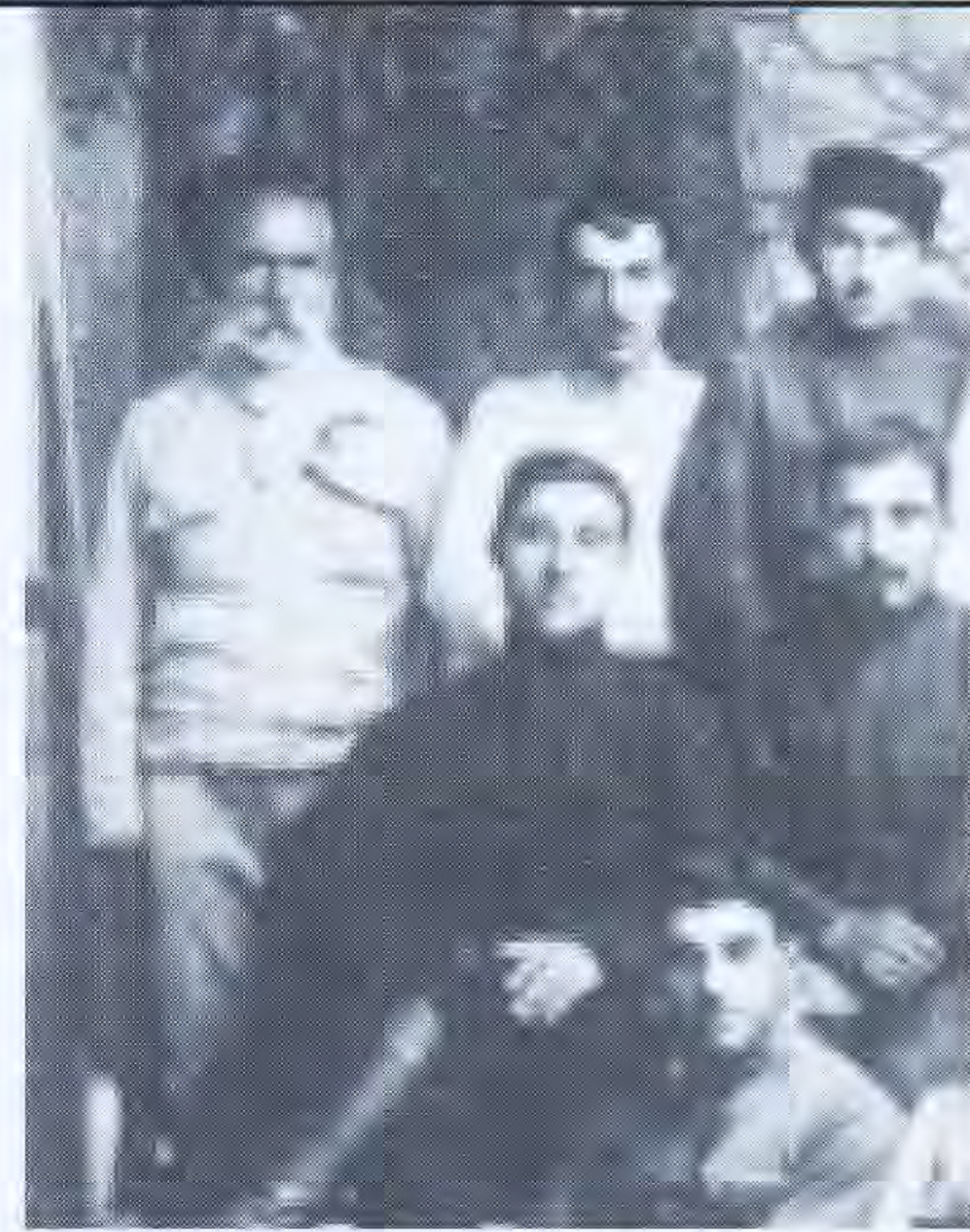
1921թ. փետրվարի 18, մասնակիցներ

Այս համամասնությամբ կարելի է եզրակացնել, որ Հայաստանի ապստամբական չորս գավառների շուրջ 100 հազար ակտիվ հայ բնակչության 35 տոկոսը (5 տոկոս ունևոր և 30 տոկոս միջակ), այսինքն՝ քանակական արտահայտությամբ 35 հազար մարդ ունեցել է որոշակի սեփականություն, ենթարկվել է ռազմակոմունիստական բռնագրավումների ու ճնշումների, ուստի և պոտենցիալ առումով կարող էր մասնակցել կամ համակրել ապստամբությանը: Բացի ունևոր և միջակ շերտերից, ի դեպ, արձանագրվել են նաև բազում փաստեր, երբ կամայականորեն բռնագրավել են անգամ չքավորների վերջին միջոցը: