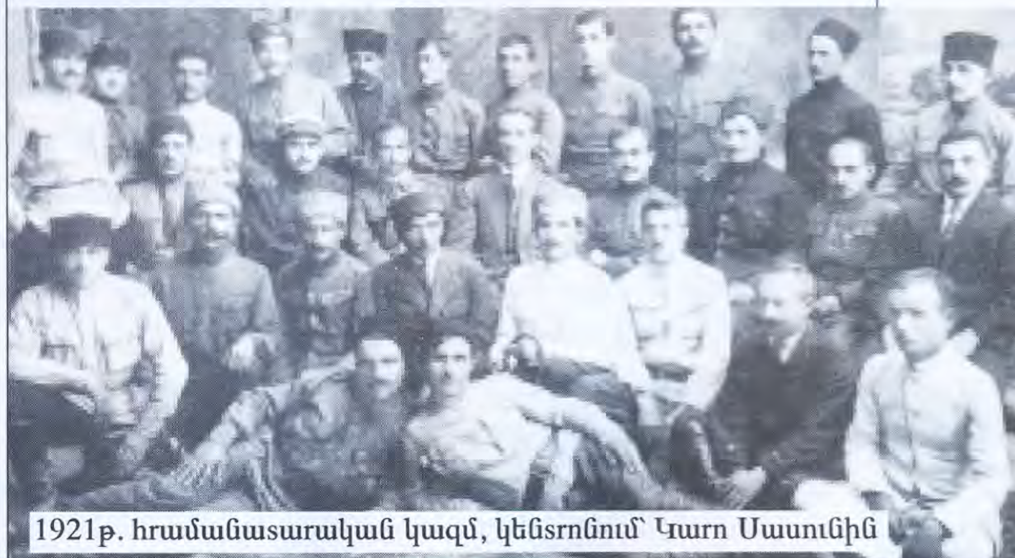
1921թ. հրամանատարական կազմ, կենտրոնում՝ Կարո Սասունի

կամ բուրժուազիայի ու պրոլետարիատի միջև (իրականում Հայաստանում չեն եղել ընդգծված դասակարգեր՝ կալվածատերեր, բուրժուազիա, պրոլետարիատ և այլն), որքան Հայաստանի երկու գլխավոր քաղաքական անհաշտ ուժերի՝ ՀՅԴ և բոլշևիկների միջև՝ քաղաքական իշխանության համար: Սրանց միջև պայքարի գերխնդիրը եղել է այն, թե Հայաստանը, իրո՞ք, պետք է լինի անկախ, եվրոպական չափանիշներին ձգտող ժողովրդավարական երկիր, թե՞ Խորհրդային Ռուսաստանից քաղաքականապես կախյալ, մարքս-լենինյան գաղափարաքաղաքական հիմունքներով կառուցվող ամբողջատիրական պետություն: Առաջին ուղղության կրողը համարվում էր ՀՅԴ-ն, իսկ երկրորդինը՝ Հայաստանի կոմկուսը: Այդ իմաստով փետրվարյան ապստամբությունը իր բնույթով և հետապնդած նպատակներով ոչ բուրժուական էր և ոչ էլ սոցիալիստական, այլ սոցիալական ինքնաբուխ ժողովրդավարական ելույթ էր բոլշևիկյան