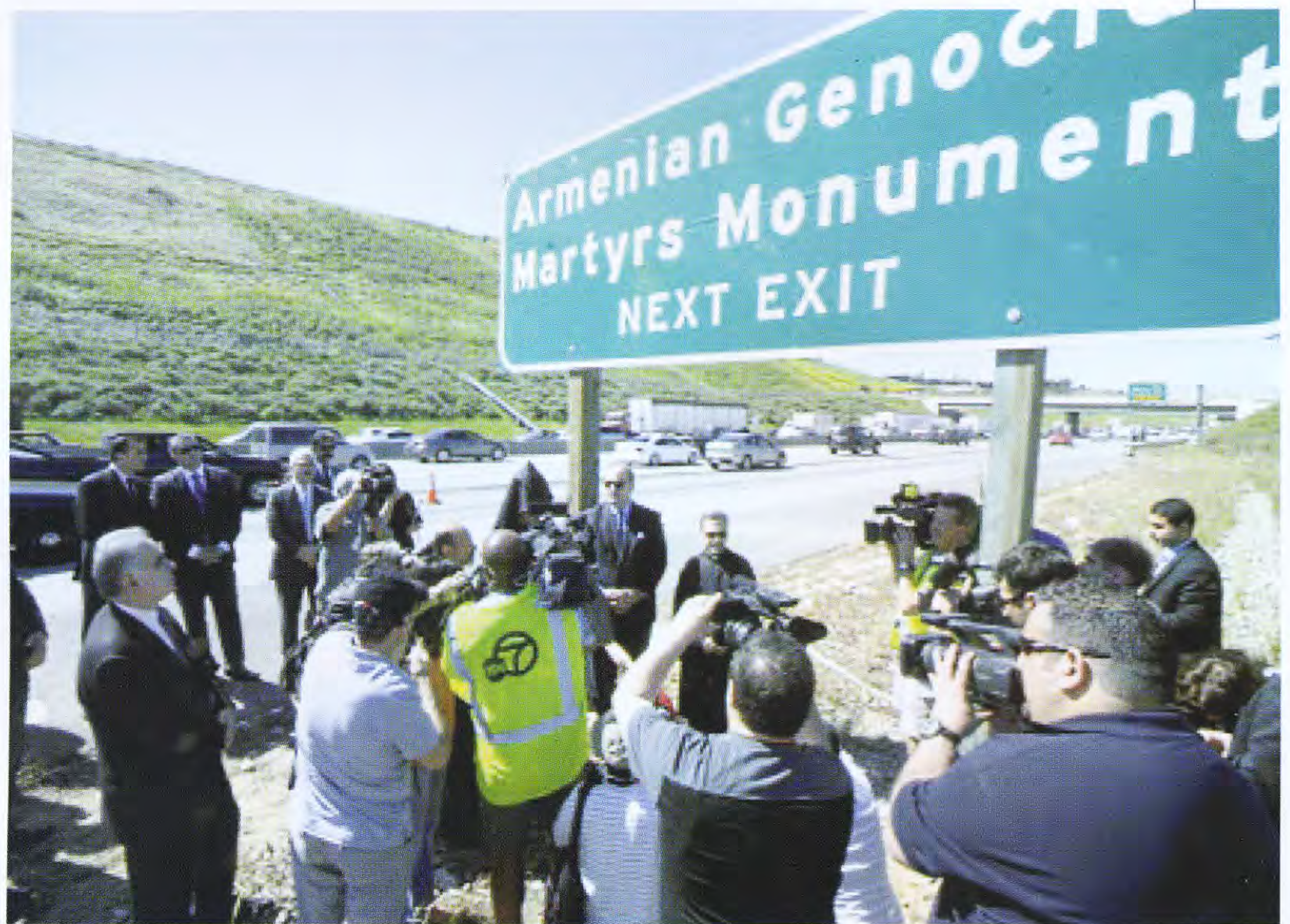
ԱՄՆ, Կալիֆոռնիա, Մոնսթերեյլո սանող մայրուղի, 2011թ. մարտ