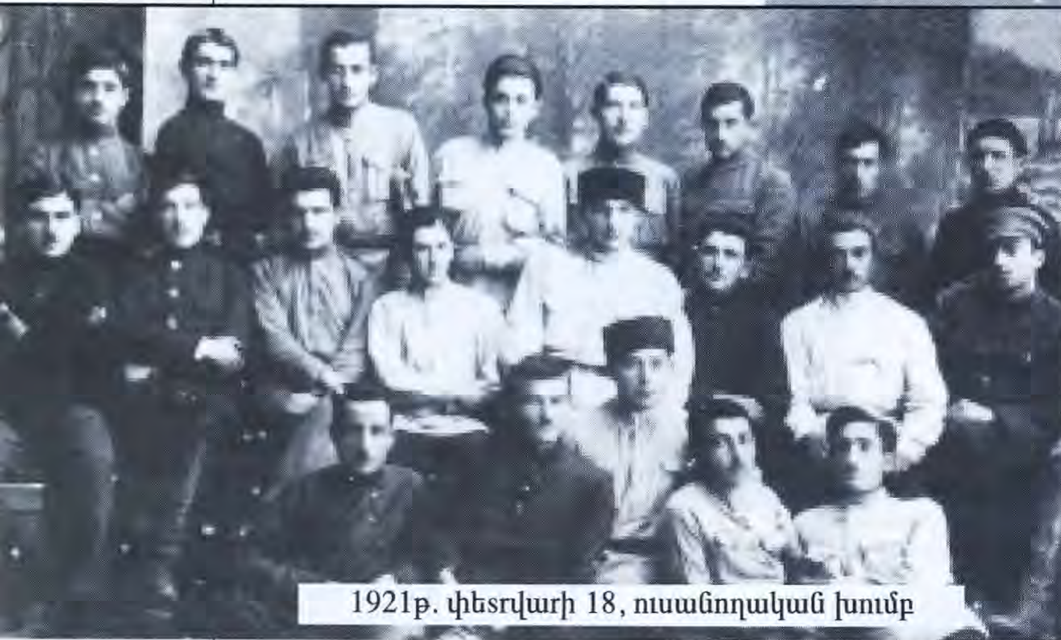
1921թ. փետրվարի 18, ուսանողական խումբ

ՀՍԽՀ բնակչության 1921-1922 թթ. թվաքանակի մասին կան այլ տվյալներ: Օրինակ, Հայաստանի ժողկոմխորհի նախագահ Ալ. Մյասնիկյանը 1921 թ. հունիսին Մոսկվայում Հայաստանի լիազոր ներկայացուցիչ Ս. Տեր-Գաբրիելյանին տեղեկացնում է, որ Հայաստանի տարածքում կա 1,5 մլն. բնակիչ և, բացի այդ, մինչև 100 հազար անտեր որք 3 : Մեկ այլ տվյալով՝ 1922 թ. հունվարի 1-ի դրությամբ Հայաստանի հիմնական ազգաբնակչությունը կազմել է 1,1 մլն. մարդ, իսկ գաղթականությունը՝ 300 հազար: Ամբողջ բնակչությունը կազմել է 1,4 մլն. մարդ 4 : Մեր կարծիքով՝ այս երկու տվյալները մոտավոր հաշվարկի արդյունք են, չափազանցված են և այնքան էլ վստահություն չեն ներշնչում: Օրինակ, խիստ կասկածելի է, թե 1922 թ. սկզբին հանրապետությունում 300 հազար գաղթական եղած լիներ: Այս կապակցությամբ ավելի մոտ է իրականությանը 200 հազար գաղթական ցուցանիշը 5 :