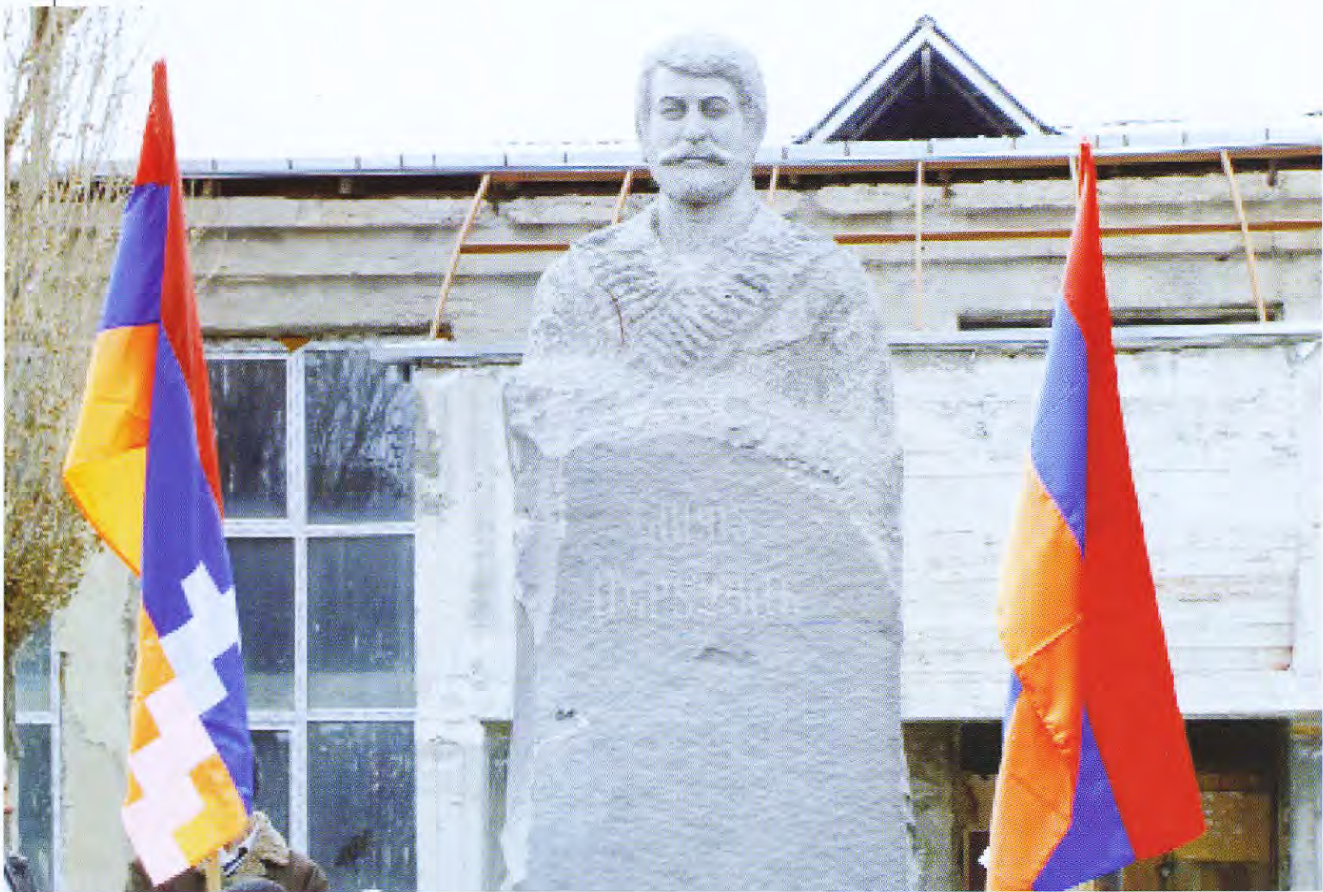
Կարոսի կիսանդրին Պոռոյան ավանում