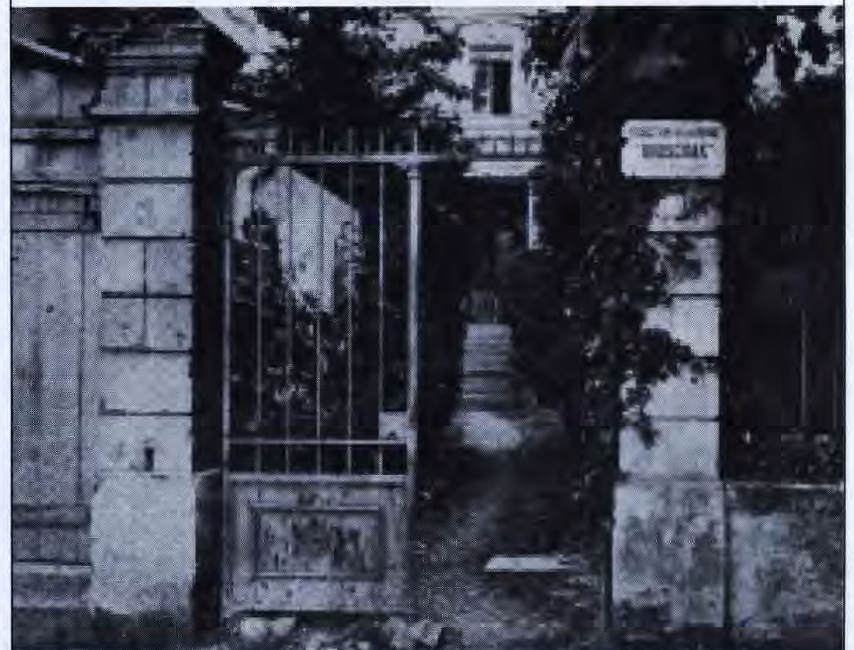
«Դրօշակ»-ի առաջին խմբագրատունը, Ժնև

արևմտահայության ինքնապաշտպանությունը, իսկ Հր. Տասնապետյանի սահմանմամբ՝ «...կը նախապատրաստեր յետագայ 5-6 տարիներու յեղափոխական-մարտական գործունեութիւնը, յեղափոխական քարոզչութիւն, կազմակերպութեան ծաւալում, մարդուժի եւ զինամթերքի փոխադրութեան գիծերու հաստատում, ժողովրդի զինում, ֆէտայական թէ տեղական-մարտական խումբերու կազմութիւն, ինքնապաշտպանութեան կամ ժողովրդի պաշտպանութեան կոչիւնը՝ յատկապէս 1895-96 թուականներու համիտեան կոտորածներու շրջանը» 14 :