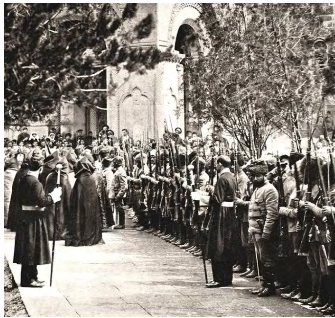
Կաթողիկոս Գևորգ Ե Սուրենյանցը (Տիրիխուցի) օրհնում է կամավորներին: (1914 թ.)

ՀՅԴ-ն իր ուժը միացուց այս պահանջին: Կազմակերպուեցաւ ներգաղթ դէպի Հայաստան. սկզբնական շրջանին, Դաշնակցութիւնը նոյնպէս խանդավառ էր այս աշխատանքով, բայց արագ փոխեց իր դիրքորոշումը, երբ խորհրդային կեդրոնական