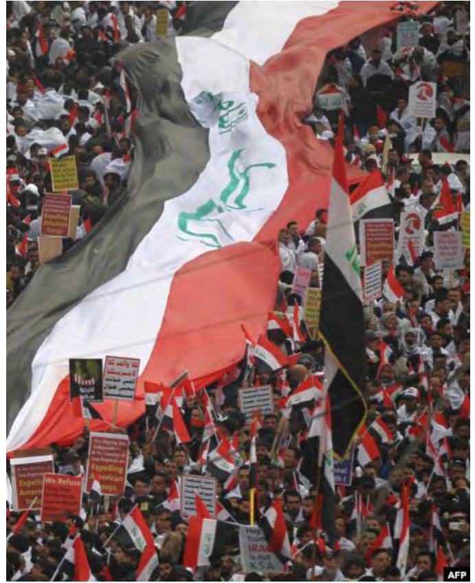
Իրաք - ԱՄՆ ռազմական ներկայութեան դէմ բողոքի ցույցը Բաղդադում

Թէ՛ Ռիատը և թէ՛ Ապու-Տապիս չէին թաքցուցած իրենց տրամադրութիւնները Անգարայի դէմ: Աննախընթաց երևոյթ գրանցուեցաւ, երբ համաարաբական մամուլը, յատկապէս՝ Ծոցին մէջ լոյս տեսնող տարբերակները, դատապարտեցին Թուրքիան՝ հայերուն դէմ ցեղասպանութիւն գործադրած ըլլալու յանցանքով և արարքը հակադրելով իսլամական կրօնին: Այստեղ կար նաև սիննի գանգուածին վրայէն թրքական ազդեցութիւնը չէզոքացնելու յստակ միտում,