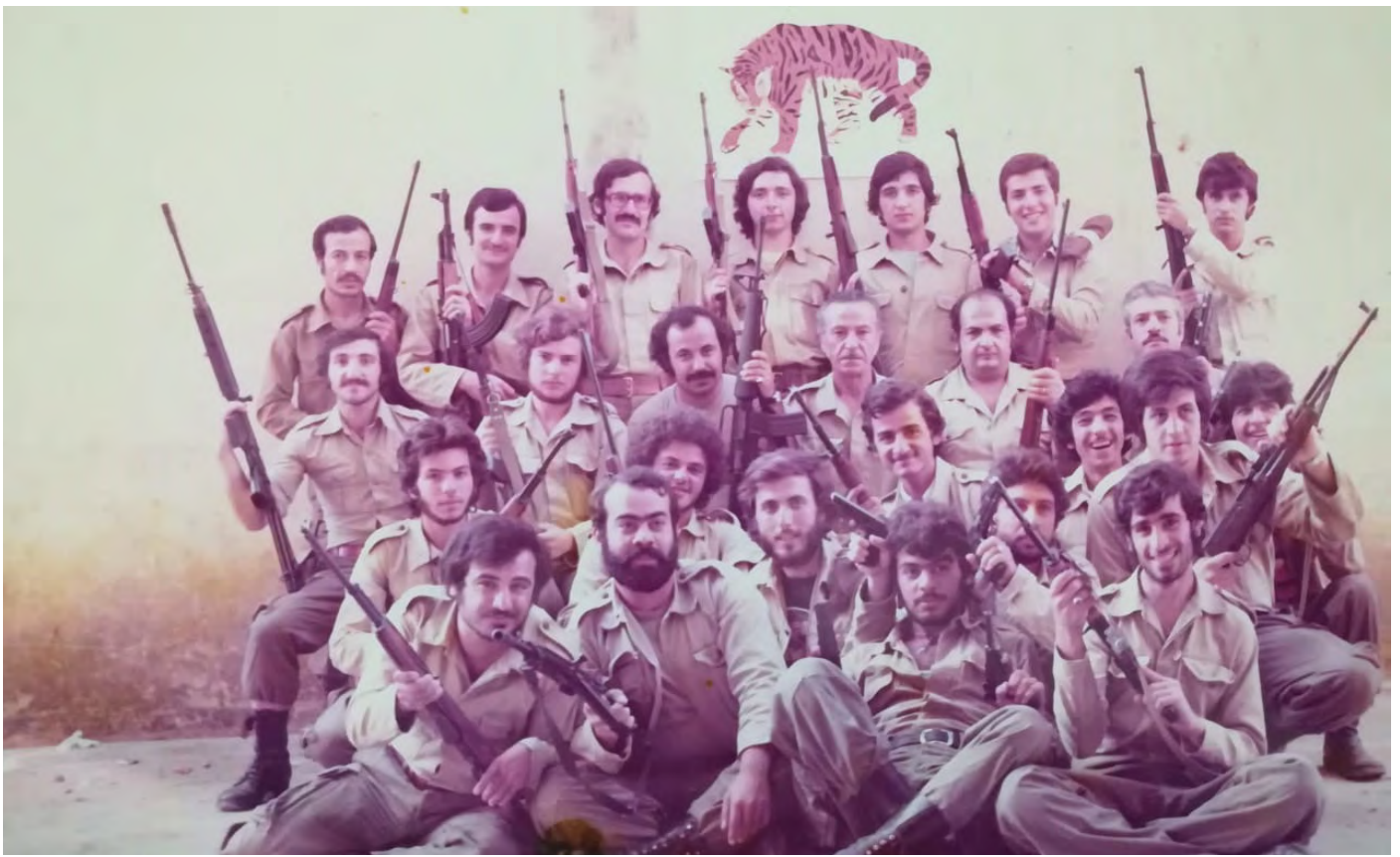
«Նիկոլ Դուման» սկումբի ինքնապաշտպանական խումբը Լիբանանի քաղաքացիական պատերազմի ժամանակ 1975թ.

Անցեալ հարիւրամեակի ընթացքին, Հայաստան-Սփիւռք յարաբերութիւնները անցած են բազմաթիւ փուլերէ: Յարաբերութեան տեսակը, տարողութիւնը, ծիրը, յաճախականութիւնն ու փոխադարձ թիրախները կախեալ եղած են հայրենիքին մէջ իշխող քաղաքական ուժէն, անոր հետապնդած նպատակներէն և ընդհանրապէս քաղաքական տեսլականէն: Անկախ իւրաքանչիւր ժամանակաշրջանի իւրայատկութիւններէն, հայութեան աշխարհագրական գրեթէ ամբողջ աշխարհը ընդգրկող տարածուածութենէն բխող հաւաքական մշակութային, կենցաղային ու բարքերու այլազան ազդեցութեններու պատճառած տարբերութիւնները անպայման դեր ունեցած են Հայաստանի՝ արտերկրի իւրաքանչիւր համայնքի հետ մշակած յարաբերութիւններուն վրայ: Այս յարաբերութիւնները շատ բարդ եղած են և տակաւին են ներկայիս. անոնք ցարդ գիտական լուրջ ուսումնասիրութիւններու առարկայ չեն դարձած: Յուսանք, որ Երևանի պետական համալսարանէն ներս քանի մը տարիներէ ի վեր գործող սփիւռքագիտութեան բաժանմունքը բաւականաչափ քաջալերանք կը ստանայ համալսարանի ղեկավարութենէն և երկրի կառավարութենէն, լուրջ աշխատանքի ձեռնարկել կարենալու համար: