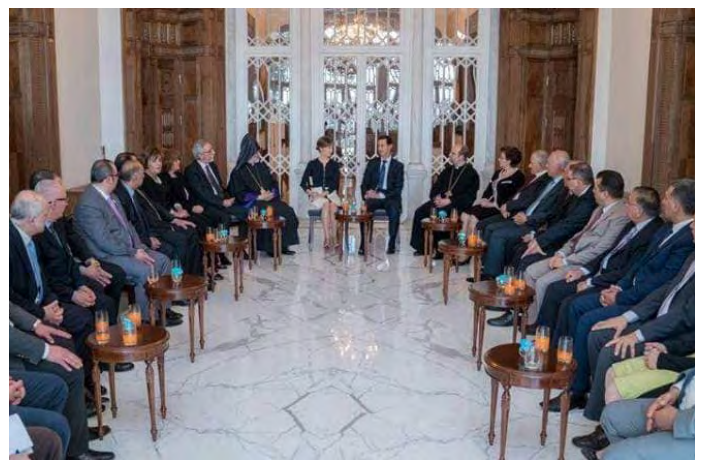
Բաշար Ասադը ընդունել է հայկական համայնքի պարլիմենտարները

Այստեղ կարելի է շեշտել նաև Միջին Արևելքի հայ համայնքներուն քաղաքական ազդեցութեան կարևորութիւնը: ■