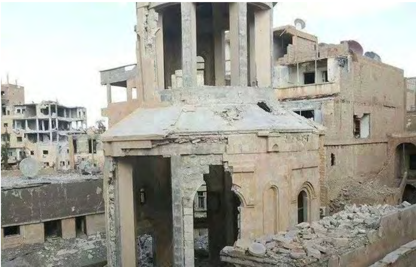
Ավերված Սրբոց Նահապակաց եկեղեցին Դեր գորում

ամեն գնով կանգուն պահեց իր ազգային, մշակութային կեանքը, բաց պահեց իր ամրոցները՝ հայկական վարժարանները: Ազգային իշխանությունը քանիցս յայտարարեց, որ նիւթական դժուարություններու պատճառով ոչ մէկ հայ աշակերտ դուրս պիտի մնայ հայկական դպրոցներէն: