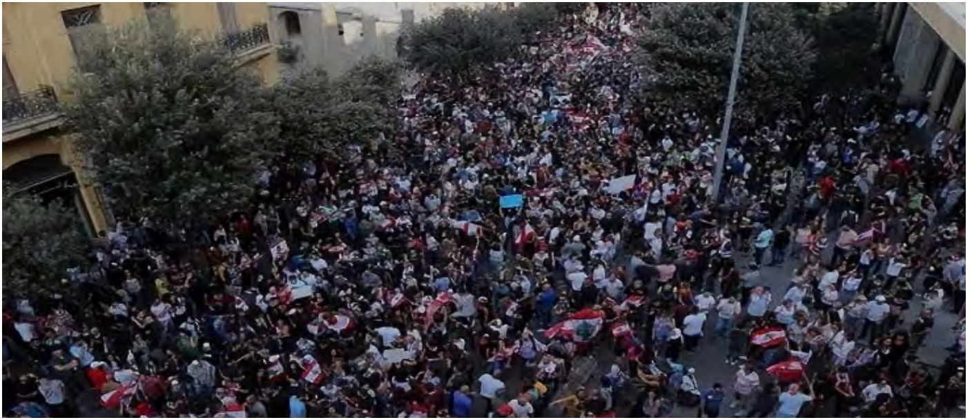
Հակակառավարական ցույց Լիբանանում

Միջինարևելեան զինուորաքաղաքական իրադարձութիւնները կը նախանշեն, որ տակաւին որոշ ժամանակահատուածի վրայ ցնցումային փուլեր պիտի շարունակուին արձանագրուիլ: