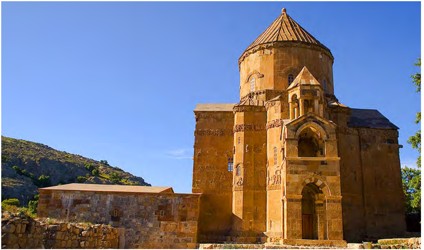
Աղթամարի Մուրթ խաչ եկեղեցին

Դեռևս 2012 թ. թուրքական զանգվածային լրատվամիջոցներով լուրեր տարածվեցին, համաձայն որոնց՝ գյուղենական համայնքի ներկայացուցիչները մտադիր են սեփականացնել ներկայիս Թուրքիայի Հանրապետության տարածքում գտնվող Սիիրթ (Մղերդ) նահանգի Էրուի գավառի Դեհ թաղամասում պահպանված հայկական Մուրթ Աստվածածին եկեղեցին: Թեև եկեղեցու միայն պատերն էին կանգուն մնացել, սակայն այն ուխտավայր էր բազմաթիվ հայերի համար, ովքեր ամեն տարվա ապրիլին ուխտի էին գնում այնտեղ: Հարկ է նշել, որ Արևմտյան Հայաստանի տարածքում, թեև ուղևորակա պահպանված յուրաքանչյուր հայկական եկեղեցի, վանք կամ մատուռ ոչ միայն հայկական հետք է, այլև աղոթատեղի կամ ուխտավայր՝ բացահայտ կամ ծպտյալ հայ մնացորդացի համար: Եվ այս համատեքստում խիստ կարևոր է նման սրբավայրերի՝ թեև ուղևորակա պահպանումը պահպանումը: Մակայն ուղիղ մեկ տարի անց՝ 2013 թ. հուլիսին, եկեղեցու տարածքը տեղի գավառապետարանի կողմից վերջնականապես վաճառվեց գյուղենական շարժմանը մոտ կանգնած մի ընկերության: Գործարքին մասնակցել էին Մղերդի նահանգապետն ու Էրուի գավառապետը: Տարածքը վաճառվել էր նախատեսվածից ցածր գնով: