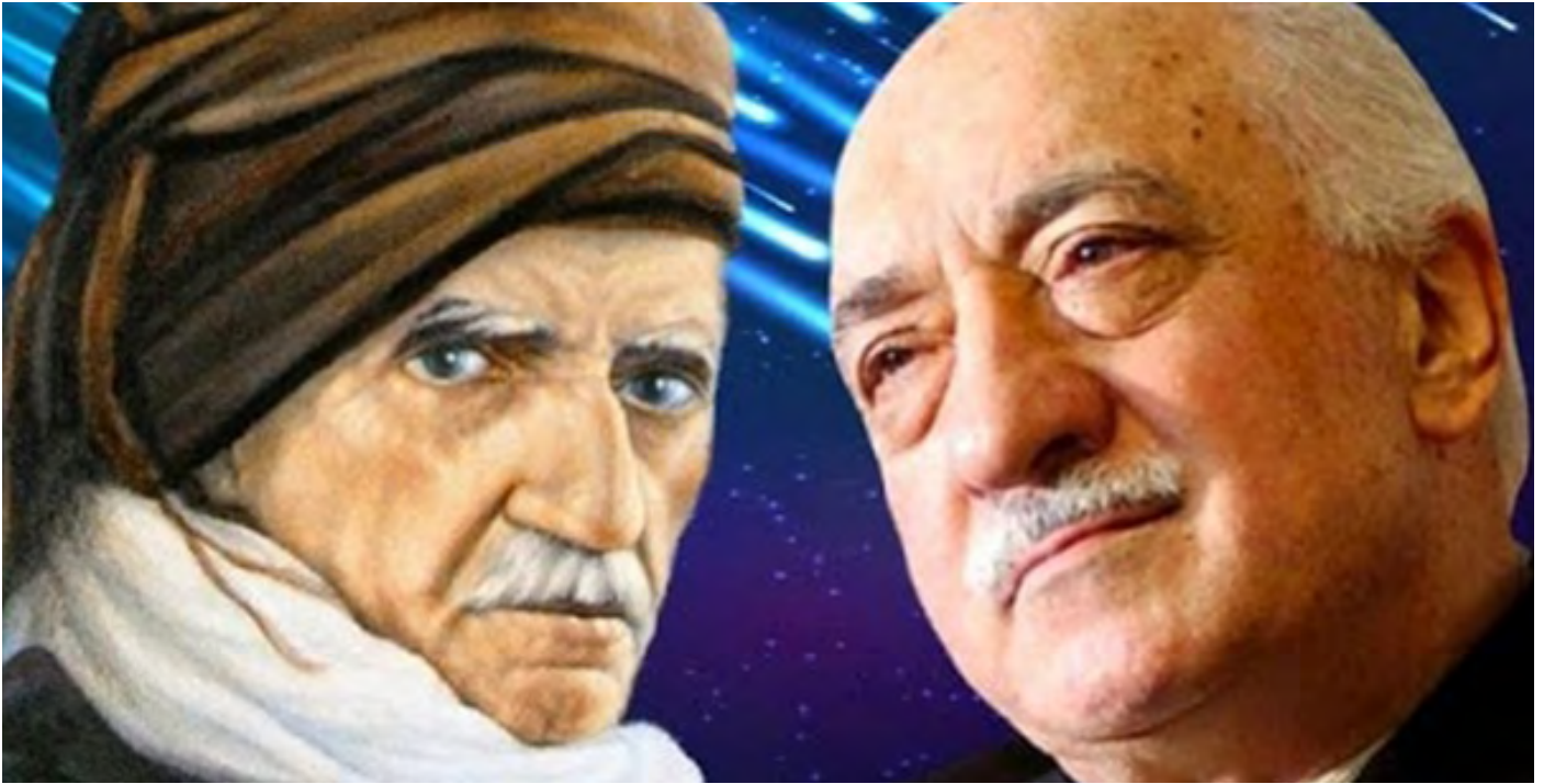
Սաիդ-ի Նուրսին և Ֆեթհուլահ Գյուլենը

շարք հետաքննություններ որևէ արդյունք չեն ունեցել ապացույցների բացակայության պատճառով: 1980 թ. սեպտեմբերի 12-ի ռազմական հեղաշրջումից հետո՝ 1981 թ., Գյուլենը թողել է հոգևորականի պաշտոնը: 1988-1991 թթ. ելույթներ է ունեցել մեծ քաղաքների մզկիթներում: Սույն աշխատանքների շնորհիվ հանրահայտ է դարձել Թուրքիայի իսլամական շրջանակներում: Այդ ժամանակաշրջանում ընդգրկվել է «Նուր» շարժման մեջ, որի շնորհիվ նրա կշիռը բավականին մեծացել է քաղաքական շրջանակներում: 1996 թ. ապրիլի 4-ին հանդիպում է ունեցել Ֆեների հունաց տիեզերական պատրիարքի հետ՝ միջկրոնական երկխոսություն ծավալելու նպատակով: Միջկրոնական երկխոսությանն ուղղված աշխատանքները շարունակվել են նաև հետագայում: Այսպես՝ 1998 թ. հունվարի 23-ին նա մոտ կեսժամանոց հանդիպում է ունեցել նաև Հռոմի պապ Հովհաննես-Պողոս Երկրորդի հետ: Գյուլենը ներկայումս բնակվում է ԱՄՆ-ում: Բազմաթիվ գրքերի և հոդվածների հեղինակ է: Իսլամական չափավորության գաղափարախոս է, ով կողմ է հանդուրժողականությանը և միջկրոնական երկխոսությանը: