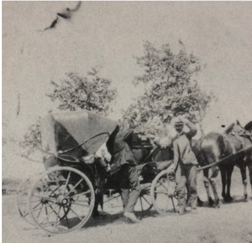
Մուլլթան Յամիտի մահափորձի ժամանակ օգտագործուած կառքը