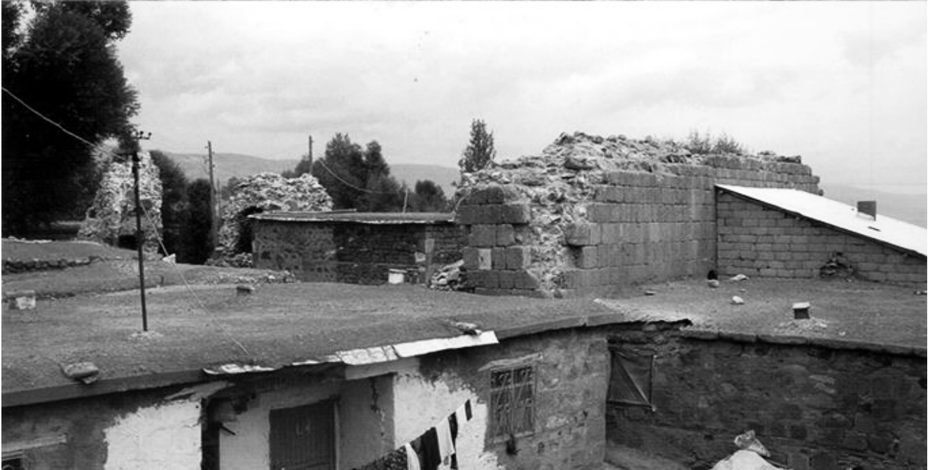
Մշոյ Ս. Կարապետ (Բնասկնեան, Գլակալանք) վանքը հարաւ-արեւմուտքէն 1910-ականներուն և վանքի մնացորդները 2006-ին

The monastery seen from the south-west, around 1910 and the remnants in 2006