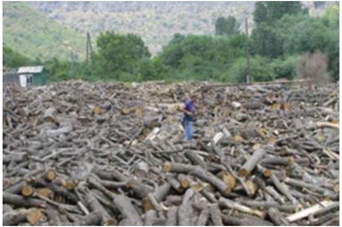
Թեղուրում հարված ծառերը