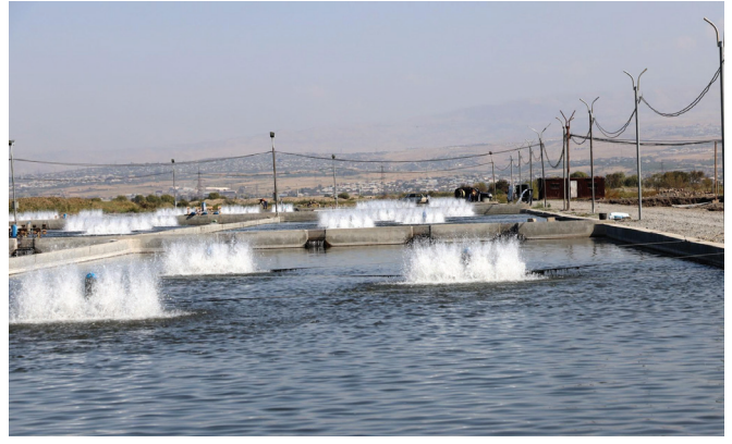
Ձկնարսուծարանի կողմից ջրի օգրագործումը

Անկախացումից հետո Հայաստանում հսկայական տնտեսական անկում գրանցվեց, մեծ փոփոխություններ տեղի ունեցան շուկայական տնտեսությանն անցնելիս և ծագեցին դրանց ուղեկցող, անհասպաղ ուշադրություն պահանջող բնապահպանական խնդիրներ: Անկախացման պահին ի հայտ եկած ազգային անվտանգության խնդիրները պատճառ դարձան, որ բնապահպանական մտահոգությունները առաջնահերթություն չդիտվեն հանրության համար: Բացի այդ՝ արագ տնտեսական զարգացման ընթացքում բնապահպանական խնդիրները հետ էին մղվել շինարարության, քիմիական արդյունաբերության մասնակի վերականգնման և հանքարդյունաբերական գործունեության ընդլայնման