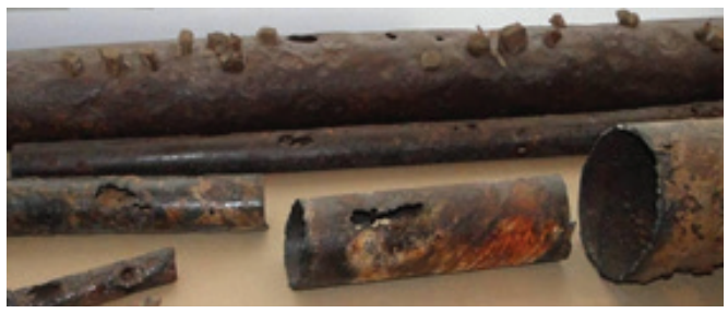
Երևանի ջրի քայքայված խողովակները

Ձկնաբուծական տնտեսություններն օգտագործում են հսկայական քանակությամբ ջուր՝ չունենալով վերամշակման որևէ համակարգ: Այս պատճառով Արարատյան դաշտի ստորերկրյա ջրերի մակարդակը իջել է մոտ 15 մետրով, ինչի հետևանքով մեծ թվով գյուղական հորեր ցամաքել են: 2017 թվականին Բնապահպանության նախարարությունը մի ձկնաբուծականի հորի վրա տեղադրեց Սկադա սարքավորումը, որի միջոցով նախարարության էին ուղարկվում էլեկտրոնային տվյալներ օգտագործվող ջրի քանակի վերաբերյալ: Նպատակն էր հսկել, որ հորից ստացվեր միայն թույլատրելի քանակությամբ ջուր: Իսկ գլխավոր նպատակը Սկադա սարքավորումների տեղադրությունն էր բոլոր ձկնաբուծական հորերի վրա, բայց այդ նախագիծը չգործադրվեց: 2017 թ. ընթացքում