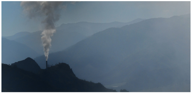
Ալավերդու արտանետումների ծխնելույզը

Քիմիական ռեագենտների գործարանը ևս մեկ հիմնական քիմիական գործարան էր, որը սկսեց գործել 1959 թ. և արտադրեց 916 տարբեր տեսակի ռեակտիվներ: Այս գործարանը մեծ քանակությամբ թափոններ է առաջացրել շահագործման ընթացքում