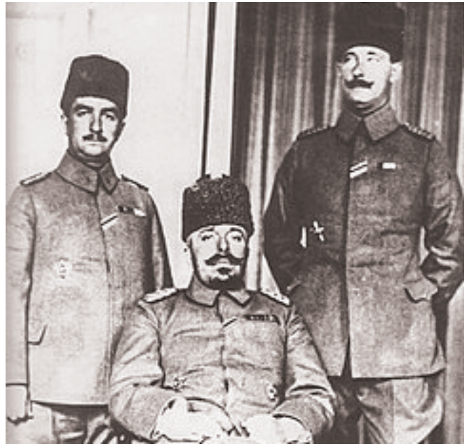
Բաթումի թուրքական պատվիրակությունը. Կենտրոնում՝ նախած՝ Վեհիբ փաշա, կանգնած ձախից՝ Խալիլ փաշա:

Շատ հետաքրքիր տեղեկություններ կան Բաթումի բանակցությունների ընթացքի մասին, որոնք այստեղ մանրամասն ներկայացնելու հարկ չկա: Կան մասնակիցների բազմաթիվ հուշեր, արխիվային նյութեր և այլն: Կցանկանայինք երկու դրվագի վրա ուշադրություն հրավիրել, որոնց մասին պատմում է հայկական պատվիրակության ղեկավար Ա. Խատիսյանը: Վրաստանի անկախության հռչակման նախօրեին Բաթում էր եկել Նոյ Ժորդանիան՝ Վրաց ազգային խորհրդի և մենչևիկների կուսակցության նախագահը, որպեսզի վրաց պատվիրակների հետ զաղտնի քննարկի իրենց անկախության հարցը: Խատիսյանը հանդիպում է նրան և նրանից իմանում, որ հայոց զորքը շարունակում է պատերազմել, իսկ թուրքերն առաջանում են: Ժորդանիան ասում է, որ իրենց այլ բան չի մտում, քան հայտարարել Վրաստանի անկախությունը: Խատիսյանի հարցին,