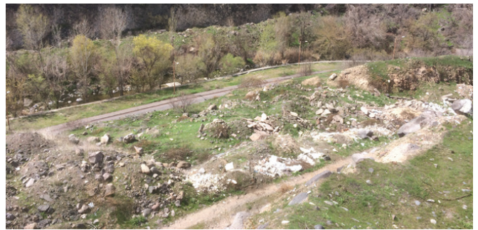
Շինարարական աղբը Հրազդանի կիրճում

Ընդհանուր առմամբ Հայաստանում անտառահատման հիմնական պատճառը վառելափայտի պահանջարկն է՝ պայմանավորված այլընտրանքային վառելիքի պաշարների բացակայությամբ: Առկա խնդիրը լուծելու համար անհրաժեշտ է մեղմացնել ճնշումը անտառների վրա՝ մերձակա գյուղերում տեղակայելով վերականգնվող