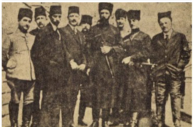
Բաթումի բանակցությունների կովկասյան պարվիրակությունը

Այն, որ այս «հեռագիրը» ամբողջությամբ կեղծ է, երևում է թե՛ անսաթվից, թե՛ ստորագրություններից: Ինչպես իրավացիորեն նկատել է Ա. Ասրյանը, 1918 թ. հունիսի 17-ին Արամը, Հ. Քաջազունին և Ա. Սահակյանը միաժամանակ չեն գտնվել ոչ Երևանում, որտեղից իբր թե ուղարկվել է հեռագիրը, և ոչ էլ մեկ այլ վայրում: Քաջազունու կառավարությունը, ինչպես կտեսնենք, Երևան է ժամանել միայն հուլիսի 19-ին 10 : Ակնհայտ կեղծիքի մասին է խոսում նաև այն փաստը, որ Արամի անվան դիմաց գրված է «զինվորական մինիստր»: