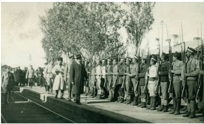
Իտալիայանը զինվորական փողանցի ժամանակ. Սարիղամիշ, 1919 թ.:

Այդուհանդերձ, սրանք ավելի քան մեկ դար առաջ սեփական ազգային ինքնիշխան պետության համար արված քայլեր ու գործողություններ էին, որոնք կատարվում էին երկրում առկա ներքին ու արտաքին, սոցիալ-տնտեսական ու քաղաքական արտակարգ ծանր պայմաններում: Ասվածներին պետք է հավելել նաև այն, որ նորաստեղծ հանրապետությունում բացակայում էին պետության կառավարման ու կայացման փորձ ունեցող