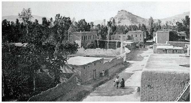
Վանի Այգեարան թաղամասը