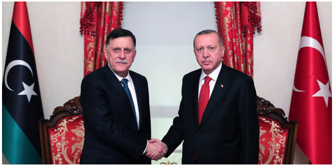
Լիբիայի ԱՀԿ կառավարության ղեկավար Ֆայիզ Սարաջը և Էրդողանը