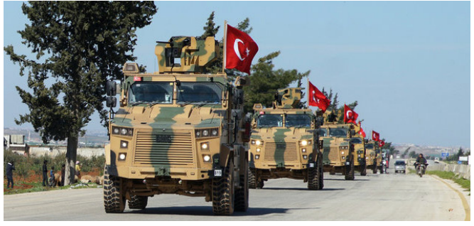
Թուրքական զորքը Սիրիայում

Հաջորդը 2020 թ. փետրվարի 27-ից մարտի 6-ը Սիրիայի հյուսիս-արևմտյան Իդլիբ նահանգում Թուրքիայի նախաձեռնած արդեն չորրորդ՝ «Գարնանային վահան» կողային անվանումով ռազմագործողությունն էր: Դրա նպատակը 2020 թ. սկզբից սիրիական կառավարական ուժերի և նրանց դաշնակիցների կողմից կրկին ակտիվացած, 2017 թ. մայիսին սիրիական հակամարտության կարգավորմանը միտված, «Աստանայի ձևաչափով» նախատեսված 4 դեմոկրատիկ գոտիներից վերջինի՝ Իդլիբ նահանգի և հարակից որոշ շրջանների վերջնական ազատագրման ռազմագործողության կասեցումն էր: Այս գործողությունը դադարեցվել էր դեռևս 2018 թ. սեպտեմբերի 17-ին Մոսկովում Ռուսաստանի և Թուրքիայի նախագահների