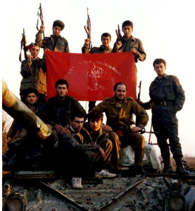
Շուշիի ՀՀԴ ատանձնակի գումարտակի մարտիկները

Այս տողերը, այս էջերը հագիվ թէ բաւեն Դաշնակցութեան 130 տարուայ պատմութեան գլխագիրներու մէկ կարևոր մասը թուելու: Սակայն այս պահուս, տողերուս շարադրման պահուն, Դաշնակցութիւնը և հայութիւնը կանգնած են անձնատուփեան և անոր անմիջական հետևանքներու հարթման հրամայական հանգրուանին: Անձնատուփեան հետևանքներու հաշուեհարդարին,