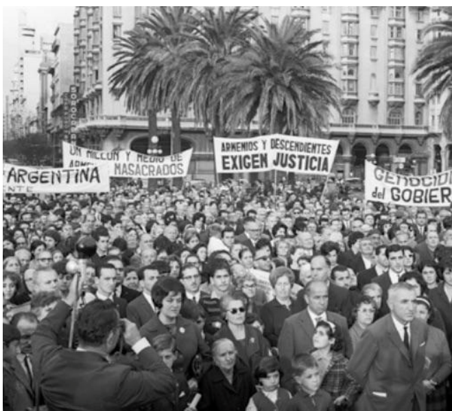
1965 թ. Ցեղասպանութեան օրվա ստիթով ցոյց

Այս է 130 տարեկան Հայ Յեղափոխական Դաշնակցութիւնը: 130 տարուայ փորձով, ւանդով ու ժառանգութեամբ... Դեպի ապագայ: ■