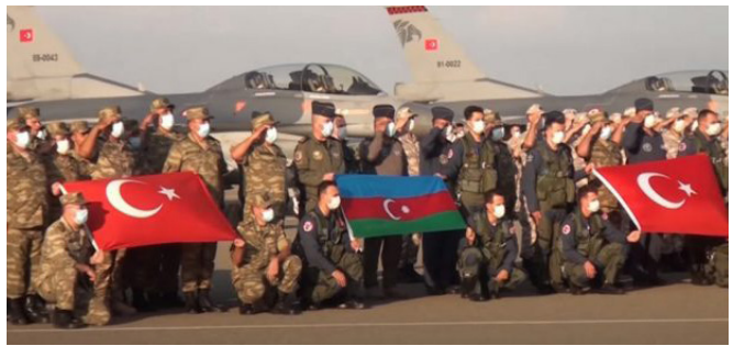
Թուրքական զորքը Ադրբեջանում

Ի պատասխան՝ հունիսի 16-ին Իրաքի ԱԳՆ է կանչվել այդ երկրում Թուրքիայի դեսպանը, ում հանձնվել է բողոք-հուշագիր, որով դատապարտվել են Թուրքիայի