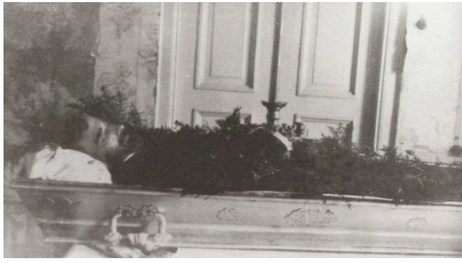
Արամ Մանուկյանը մահվան մահճում