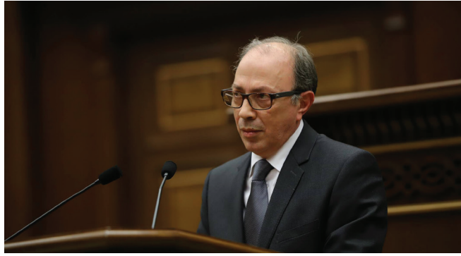
ՀՀ ԱԳ նախարար Արա Այվազյան

Իրեն հատուկ խարդավալից գործելակերպի համաձայն՝ Հայաստանի իշխանությունը հասանելի աղբյուրներով հայ հանրության շրջանում փորձում է տարածել այն մտայնությունը, թե այսօր Արցախի շուրջ տեղի ունեցող շատ գործընթացների թելադրողը Ռուսաստանն է, մասնավորապես տարածաշրջանում