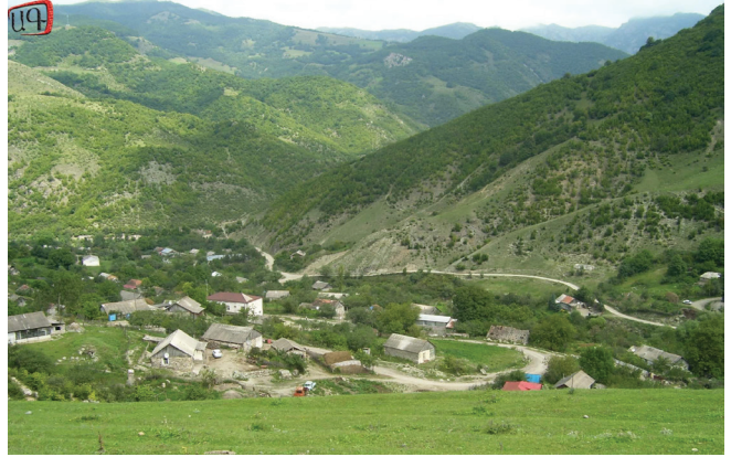
Փոլատ-Այրի՝ ներկայիս Խաչարձան գյուղը

Արշաւախումբի մասնակիցները անխտիր՝ տասնեակներն ու յիսնակները, ձիւներու և անտառային դժուար ու ծանր պայմաններուն մէջ կը պաշարեն Փոլատ-Այրին, ուժգին ընդհարումներ կ'ունենան թշնամիին հետ: Անոնք ցոյց կու տան մարտական մեծ կորով, հնտութիւն, պատրաստակամութիւն ու մանաւանդ քաջութիւն: Աննպաստ պայմաններու մէջ դիրքէ դիրք կը մարտնչեն, մինչև որ թշնամին պարտութեան մատնեն: Փոլատ-Այրին կը գրաւուի, և պատիժը կ'ամբողջանայ՝ թաթար բնակչութիւնը՝ կիները, տարեցներն ու մանուկները