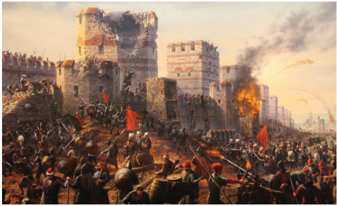
Կ. Պոլսի գրավումը թուրքերի կողմից

Դաշնակցային հարաբերությունները ենթադրում են փոխադարձություն, բայց արդյո՞ք «քայլողների» վարչախումբը բավարար չափով անկեղծ է եղել մեր դաշնակից երկրների հետ: Դրա վկայությունները չունենք: Հետևաբար վերջին պատերազմում մեծ հաշվով մենք հնձեցինք այն, ինչ ցանել էին «քայլողները»: Սկզբունքորեն հարցի էությունը չի փոխվում նույնիսկ այսպես կոչված «Լավրովյան պլանի» անկայության պայմաններում: Դաշնակիցների հետ հարաբերություններում «քայլողների» վարքագիծը հնարավոր չէ բնորոշել այլ կերպ, քան՝ երկդիմի, որը քաղաքական տգիտության դրսևորում է, եթե չասենք՝ դավաճանություն ազգային շահերի դեմ, անկախ այն բանից, այդ վարքագիծը պետության արտաքին քաղաքական կուրսի վեկտորների քողարկված փոփոխության արդյունք է, թե՛ պարզապես անգրագիտության: Գաղտնիք չէ, որ Ռուսաստանին անդրկովկասյան տարածաշրջանը անհրաժեշտ է ամբողջությամբ կամ առնվազն պետք