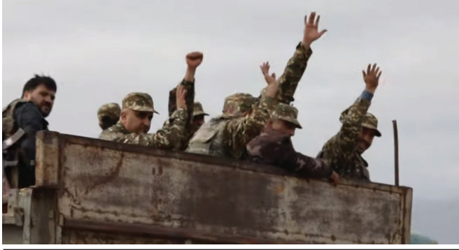
Հայ զինվորները 44 օրյա պատերազմի ժամանակ

ուժերուն կ'իյնայ Հայաստանի խորհրդարանին մեջ այս ճանաչման օրհնադրության անցման ապահովումը: