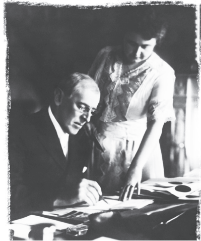
Վ. Վիլսոնը կնք հեք

պայմանագրում 4 : Հետևանքն այն եղավ, որ Վ. Լենինի գլխավորած Ռուսաստանի բոլշևիկյան կառավարությունն առաջինը ճանաչեց թուրքական «Ազգային ոլխտը», իսկ շատ շուտով՝ 1920 թ. ամռան-աշնանը, ոսկով, գենք-գինամթերքով և այլ միջոցներով աջակցեց քեմալական բանակին, ինչի հետևանքով Հայաստանը ծանր պարտություն կրեց, նրա տարածքները բզկտեցին ու բաժանեցին միմյանց միջև, իսկ Սևրի մեծախոստում պայմանագիրն ու վիլսոնյան իրավարար վճռով ձևավորվելիք ավելի քան 160 հազար քառ. կմ տարածքով Միացյալ Հայաստանի պայմանագրային պահանջը մնացին օդից կախված ու անկատար: Կրկին ուզում ենք արձանագրել պատմական այն փաստը, որ Խորհրդային Ռուսաստանը առաջին երկրներից մեկն էր, եթե ոչ առաջինը, որ չի ճանաչել Սևրի պայմանագիրը, այդ թվում նաև՝ այդ պայմանագրի «Հայաստան» բաժնի 88-93-րդ հոդվածներով ներկայացված Միացյալ և Անկախ Հայաստանի տեպլականի իրագործումը 5 : Իսկ հայ բոլշևիկ, ՀՄԽՏ Ժողկոմխորհի նախագահ Ա. Մյանսիկյանը Սևրի պայմանագիրը բնորոշել է իբրև «Թուրքիային ուժով պարտադրված երկրորդ ասիական Վերսալ» 6 :