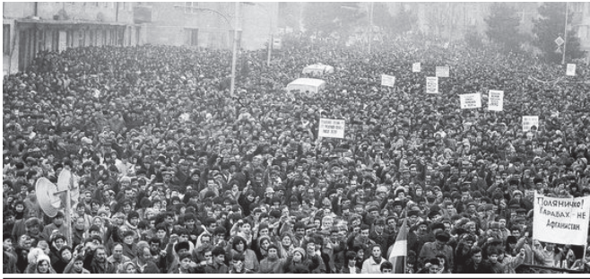
Հանրահավաք Սյունիսկաներպում, 1988 թ.