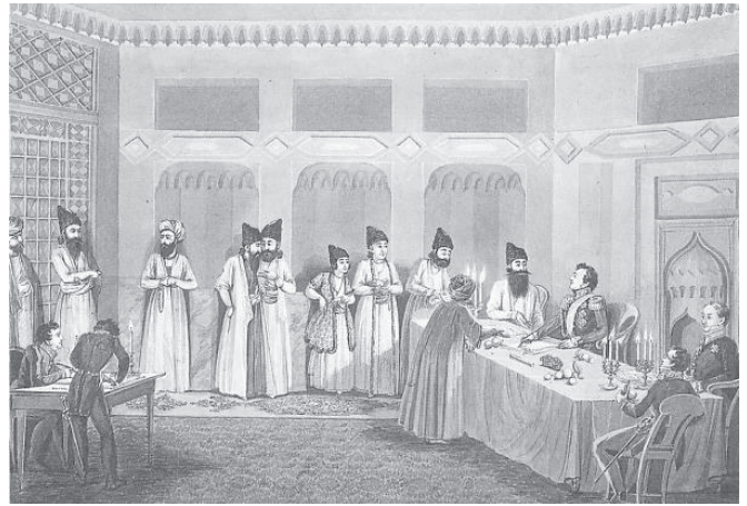
Թուրքմենչայի պայմանագրի կնքումը

Բեռլինի վեհաժողովում Սան Ստեֆանոյի 16-րդ հոդվածը փոխվեց 61-րդի և վերաձևակերպվեց այսպես. «Բարձր Դուռը պարտավորվում է առանց հետագա հասպտակների իրագործել հայաբնակ մարզերում տեղական կարիքներից հարուցված բարելավումներն ու բարենորոգումները և ապահովել հայերի անվտանգությունը չերքեզներից ու քրդերից: Բարձր դուռը տերություններին պարբերաբար կհաղորդի այն միջոցների մասին, որոնք ինքը ձեռք է առել այդ նպատակի համար, իսկ տերությունները կհսկեն դրանց կիրառումը» 4 : Անգլիայի պահանջով Թուրքիային վերադարձվեցին Ռուսաստանի կողմից գրավված Էրզրումը, Բայազետը, Ալաշկերտի հովիտը և հարակից տարածքները: Ռուսաստանին մնացին Կարսը, Արդահանը և Արդվինը, որոնցից էլ կազմվեց Կարսի մարզը, որը գոյություն է ունեցել մինչև Առաջին համաշխարհային պատերազմը: