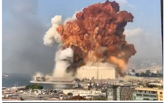
Բեյրութի նավահանգստի պայթյունը

Լիբանանյան քաղաքական համակարգի կարևոր առանձնահատկություններից մեկն էլ արտաքին դերակատարների ազդեցությունն է ներքին գործընթացների վրա: Բանն այն է, որ երկրի ազդեցիկ կրոնական համայնքներն ունեն սեփական արտաքին հովանավորները, իսկ վերջինների փոխհարաբերությունների բնույթն ուղղակիորեն արտացոլվում է նաև Լիբանանի տարածքում: Այսպես՝ քրիստոնյա մարոնիների հովանավորը հիմնականում Ֆրանսիան է, սուննի մուսուլմաններինը՝ Սաուդյան Արաբիան, շիաներինը՝ Իրանը: Ներկայում շարունակվող Էր-Ռիադ-Թեհրան, Արևմուտք-Իրան, Իսրայել-Իրան հակասություններն էականորեն դրսևորվում են նաև Լիբանանի տարածքում՝ միտված իրանամետ «Հիզբալլահ» կրոնաքաղաքական կառույցի ազդեցության զգալի սահմանափակմանը: Այս իրողությունները հավելյալ բարդություններ են ստեղծում կառավարության ձևավորման շուրջ ներլիբանանյան բանակցային գործընթացի համար: Խնդիրն այն է, որ ստեղծված բազմաշերտ ճգնաժամի հաղթահարման համար Լիբանանին անհրաժեշտ է ֆինանսական զգալի աջակցություն, որի ցուցաբերման համար հնարավոր հովանավորները ներկայացնում են հստակ նախապայմաններ, որոնց առանցքում դարձյալ Իրանի