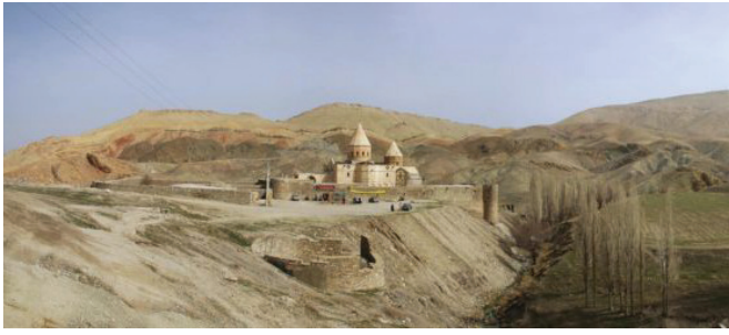
Մուրթ Թաղեի վանքը

այլ մասնատր պաշտօնեաներու, ինչպէս այնտեղի գաւառապետը, որ բաւական կաշառք էր կերած: Բայց քիչ ետք Արրպարականի ընդհանուր նահանգապետը Թարսիգ բերել փառ գինքը և, կաշառք առած դրամները խլելով անկէ, Սալմաստի հայերուն ետ փառ, ու դեռ խիստ պարծի ալ ենթարկեց: Իսկ Խոյի մօր քիւրդերը յարձակեցան միայն Վառ գիւղի վրայ, անխորհր կոտորելով թէ՛ պարսիկ և թէ՛ հայ: