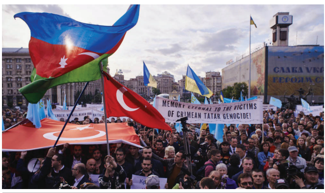
Արևաքաված Ղրիմի թաթարների ցույցը Կիևում

Աշխարհաքաղաքական նոր իրողությունները այսուհետ Ռուսաստանին առնչվելու են ուղղակիորեն, և նա մեզ կդիտի կամ որպես գործընկեր, կամ առևտրի առարկա, կամ հակառակորդ: Ընտրությունը նրանն է, բայց մենք ասելիք ու անելիք ունենք, եթե իհարկե ունենք և եթե ունակ ենք համոզիչ լինելու: ■