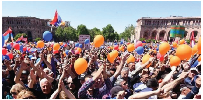
«Թավշյա հեղափոխության» հանրահավաք Երևանում

Դ) Ազգային-պետական շահը գերակա է ամեն ինչի նկատմամբ: Այդ գիտակցումը, սակայն, չունեն հատկապես նրանք, որոնք ի պաշտոնե պարտավոր էին այդպիսի բարձր գիտակցական վարքագիծ դրսևորել: Խոսքս վերաբերում է և՛ իշխանական բուրգի գազաթնամերձ պաշտոնյաներին, որոնց ճնշող մեծամասնությունը անցած ութ ամիսների ընթացքում ապացուցեց, որ չունի Հայրենիքի և Պետականության տարրական ըմբռնում, և՛ հատկապես Սահմանադրական դատարանին, որը պարզապես գործեց պիղատոսաբար (իհարկե, պարզ է, որ ՄԴ-ի բոլոր անդամները չեն ունեցել նույն դիրքորոշումը, բայց ինչպես օրենքի, այնպես էլ դրսից դիտողի տեսանկյունից ՄԴ-ն միասնական մարմին է): Իհարկե, թե՛ առաջին, թե՛ երկրորդ կարգի պաշտոնյաների նմանօրինակ վարքագիծը նորություն չէ: Պետական չինովնիկը, մասնավորապես՝ բարձրաստիճանի չինովնիկը այդպիսին է եղել բոլոր վարչակազմերի ժամանակ: Բայց կա մի էական տարբերություն. նույնը չեն ժամանակները: Անցած երեսուն տարիների ընթացքում մենք չենք ունեցել հասարակության պատակավածության և պետականության վտանգավածության այնպիսի բարձր աստիճան, ինչպիսին որ առկա է նիկոլական Հայաստանում: Եվ որ ավելի վտանգավոր է՝ ետպատերազմյան նիկոլական Հայաստանում: Իրավասու բարձրաստիճանի պաշտոնյաներից և հատկապես ՄԴ-ի անդամներից ակնկալվում էր սեփական «ես»-ից վեր կանգնելու, իրենք իրենցից հասուն լինելու գիտակցականություն,