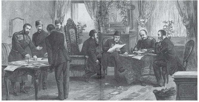
Սան Սյրեֆանտյի պայմանագրի կնքումը

Սա նշանակում էր, որ Թուրքիային էր անցնում