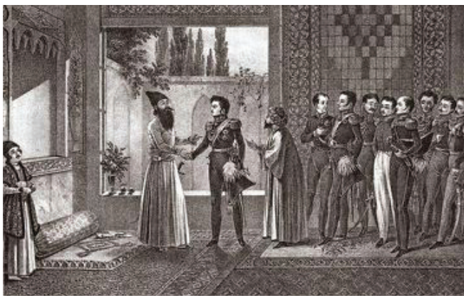
Գյուլիստանի պայմանագրի կնքումը

Այս ամենից բացի՝ ռուսական տիրապետության շրջանում, երբ հայերը ավելի լավ կրթություն ստանալու հնարավորություն ստացան, աստիճանաբար բարձրացավ արևելահայության կրթական մակարդակը, արևելահայ երիտասարդները տարիների ընթացքում սկսեցին ուսանել նախ ռուսաստանյան, ապա եվրոպական առաջատար բուհերում՝ իրենց հետ հայկական շրջանակներ բերելով ավելի առաջադիմական և լուսավոր գաղափարներ: