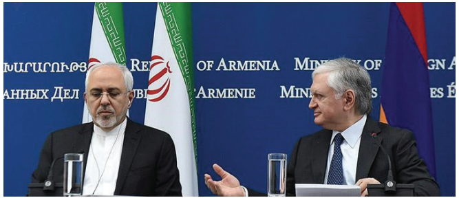
Իրանի և ՀՀ արտգործնախարարներ Մոհամմադ Ջարիֆը և Էդվարդ Նալբանդյանը

Պաշտոնական Թեհրանի ընդհանուր մոտեցումները հակամարտության համեմատաբար պասիվ և ոչ պատերազմական շրջաններում տարբեր ժամանակահատվածներում ԻԻՀ նախագահների և արտաքին