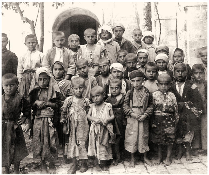
Մասպարից բերված հայ որբեր

Պետք է նշել, որ առավել դժվար էր պարզել թուրքերի մոտ գերության մեջ պահվող հայերի թիվը, քանի որ, ինչպես նշում է Գ. Սյուրմենյանը, «թուրքերը իրենց մօտ գտնուած հայերը կը թաքցնէին խիստ զգուշութեամբ» 16 : Ի տարբերություն քրդերի՝ թուրքերի մոտ պահվում էին բացառապես երեխաներ և երիտասարդ աղջիկներ. վերջիններս գտնվում էին հիմնականում հարեմներում: Թուրք