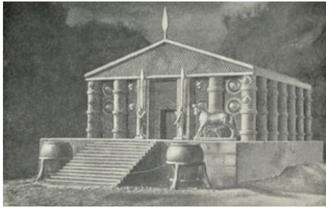
Արդինի-Մուսասիր, Վանի թագավորության գլխավոր սրբավայրը

Հայկական լեռնաշխարհում Ք. ա. XVI-XIII դարերից մեզ հայտնի մյուս պետությունը (Հայաստանի հարավում և Միջագետքի հյուսիսում) Միտաննիի թագավորությունն է՝ Վաշշուգանե մայրաքաղաքով: Եգիպտական աղբյուրներում Միտաննին հիշատակվում է «Նահաիրնա» ձևով: Իր գոյության ընթացքում Միտաննին ստիպված էր պատերազմել Եգիպտոսի դեմ, որի՝ հիքսոսների