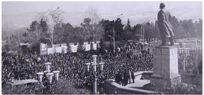
Մրեփանակերպ 88 թ.

Դավադրական պատերազմից մեկ տարի անց անդրադարձնալով անցած ճանապարհին և ներկա վիճակին՝ պարտավոր ենք հանուն ապագայի հստակեցնել, թե արդյոք թույլ չենք տվել այնպիսի ճակատագրական սխալներ, որոնք դեր են խաղացել ողբերգական հետևանքների հարցում: Ինչո՞վ էինք զբաղված տասնամյակներ շարունակ, երբ թշնամին, մանկապարտեզից սկսած, դաստիարակում էր իր ժողովրդին, թե Ղարաբաղն իրենցն է, և այն ցանկացած գնով պիտի ետ նվաճեն: Երբ այդ թշնամին, իր նպատակներին հետամուտ, ամեն օր խնդիրներ էր ստեղծում հայկական կողմի համար սահմանային գոտում, մարտական շփման գծում, միջազգային կազմակերպություններում և ամենուր, մենք հակադարձողի դերի մեջ գոհանում էինք, եթե հաջողվում էր չեզոքացնել հակահայկական հերթական որոշումը միջազգային ատյաններում կամ ռազմական սադրանքը սահմանին: Անցած 30 տարիներին թշնամի երկրում իշխող գաղափարախոսության և ներհասարակական մթնոլորտի պայմաններում չհայտնվեց մի «խաղաղասեր», որը կասկածի տակ