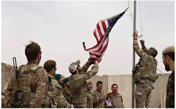
Ամերիկյան զորքը հեռանում է Աֆղանստանից

հայտնի խողովակներով կաշառելով թալիբներին և ահաբեկչական այլ կազմակերպությունների ղեկավարներին, վերջիններիս ֆինանսական կախվածության մեջ են գցել և նրանց վրա ազդեցության հզոր լծակներ ձեռք բերել: