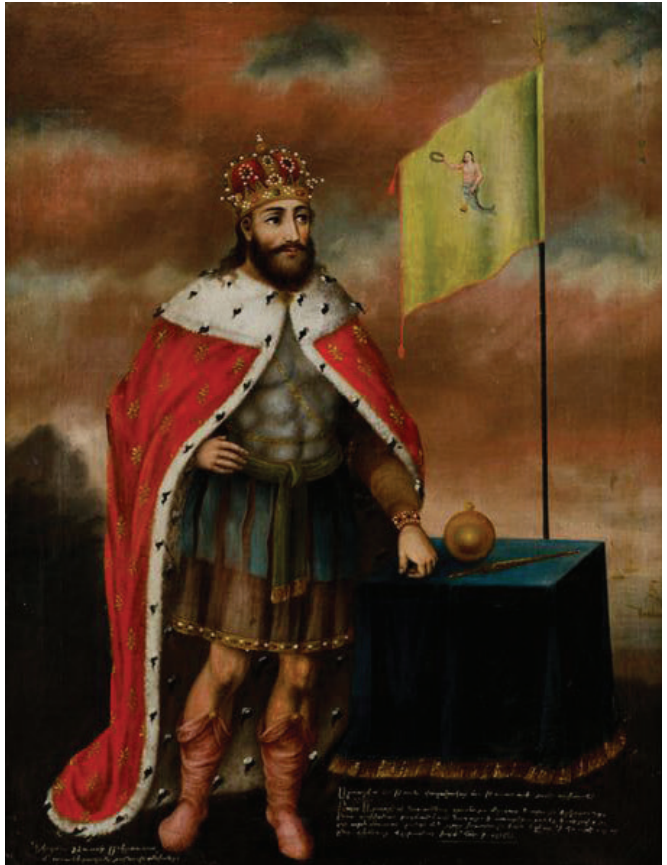
Տրդատ Գ Մեծ

Արտաշես Ա-ն (Ք.ա. 189-160) հայ ժողովրդի կողմից արժանացել է «Բարեպաշտ» պատվանվանը. «Արտաշեսի ժամանակ մեր հայոց աշխարհում աննշակ հող չմնաց, ո՛չ լեռնային և ո՛չ դաշտային, այնքան էր շենացել երկիրը» 14 : Արտաշես Բարեպաշտի և նրա որդիներ Արտավազդ Ա-ի (Ք.ա. 160-115) ու Տիգրան Ա Արտաշեսյանի (Ք.ա. 115-95) համեմատաբար խաղաղ և հայրենաշեն կառավարումը հող նախապատրաստեց հայոց պատմության մեծագույն տիրակալի՝ Տիգրան Բ Մեծի (Ք.ա. 95-55) կողմից հայկական կայսրության ստեղծման համար: Տիգրան Մեծի մասին շատ է խոսվել, նրա կառավարման տարիները և 3 մլն քառ. կմ տարածք ընդգրկող հայկական կայսրության պատմությունը թերևս լավագույնս ուսումնասիրված են, ուստի մեծ տիրակալի կերպարի վրա շատ