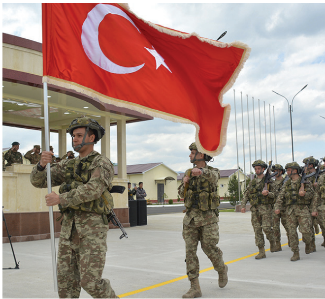
Թուրք զինվորները Աֆղանստանում

Հակառակ անոր, որ Թուրքիա և Էրտողան, այլ խօսքով՝ պաշտօնական Անգարան, ունէին բոլորովին այլ նպատակներ, այնտեղ մնալու յստակ ու անթաքոյց ախորժակ, սակայն, հակառակ իրենց բոլոր ճիգերուն, մերժուեցան Աֆղանիստանի