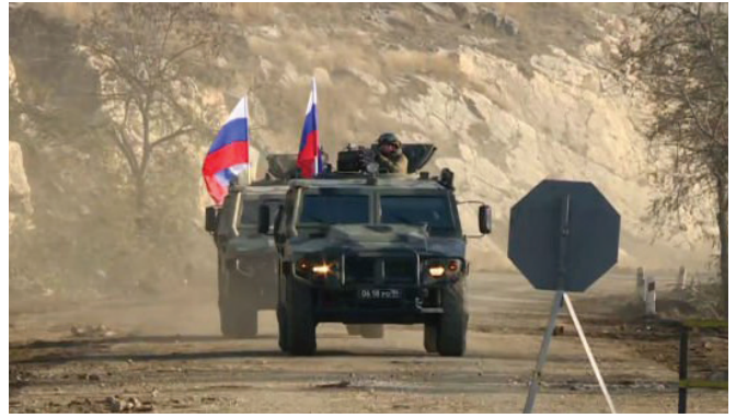
Ռուս խաղաղասպահները Արցախում

Մտում է, թերևս, վերջին տարբերակը՝ ոչ թե խաղաղության դարաշրջան, այլ հայկական պետությունների կենսական շահերի խաղաղ հանձնում թշնամուն: Եվ սա, ցավոք, կյանքի կոչվող ամենաիրական սցենարն է: Այս տողերը գրելիս նոր տեղեկատվություն ստացվեց, որ ՀՀ իշխանությունները Կապանի Փելա սարը հանձնում են Ադրբեջանին: Այդ մասին սկզբում ահագանգեց «Հայաստան» խմբակցության պատգամավոր Աննա Գրիգորյանը, իսկ ավելի ուշ հաստատեց նաև «Պատվի