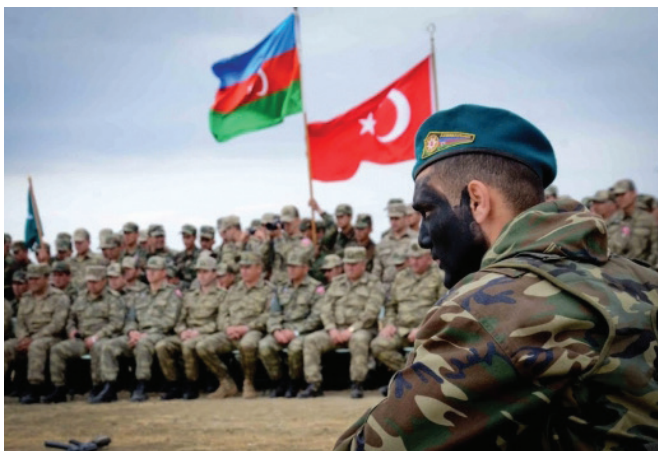
Թուրքական զորքը Նախիջևանում

Ադրբեջանի և Հայաստանի միջև հակամարտությունում Թուրքիան սատարում է Ադրբեջանին, իսկ Իրանը, որպես հակակշիռ, որոշ չափով աջակցում է Հայաստանին: Եվ մինչ իրանցիները զորքեր և ծանր տեխնիկա էին կենտրոնացնում Ադրբեջանի սահմաններին, վերջինի տարածքում Բաքվի դաշնակիցների՝ Թուրքիայի և Պակիստանի զորամիավորումների և ադրբեջանական բանակի համատեղ զորավարություններ էին ընթանում: