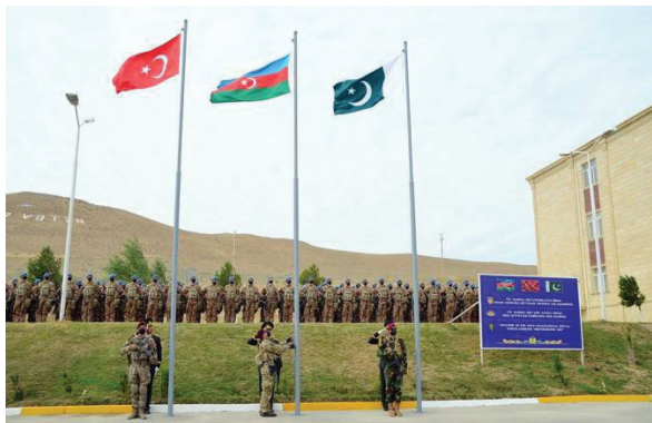
Ադրբեջան, Թուրքիա, Պակիստանի զորավարժություններ

պատերազմն անխուսափելի կդառնա: Եվ եթե այդ պատերազմը սկսվի, դրա ամենամեծ զոհը կլինի հենց ադրբեջանական կողմը, ընդ որում՝ երկու դեպքում էլ՝ և՛ եթե Թուրքիան ու Ադրբեջանը, որին անպայման կաջակցի Իսրայելը, հաղթանակած դուրս գան այդ պատերազմից, և՛ առավել ևս, եթե առավելությունը Իրանի կողմը լինի: Վերջին դեպքում տուժելու է ոչ միայն ադրբեջանական իշխող վարչակարգը, այլև ժողովուրդը: Փաստն այն է, որ Ի. Ալիևի կառուցած պետությունը չափազանց աշխարհիկ է ոչ միայն կղերական Թեհրանի, այլև Անկարայի՝ չափավոր մահմեդական Էրդոհանի համար: Հետևաբար այս վարչակարգը երկու դեպքում էլ կդառնա հակամարտության հիմնական զոհը, նույնիսկ եթե Ի. Ալիևը հաղթի: Այդուհանդերձ, ադրբեջանական կողմը շատ լավ գիտակցում է, որ հաղթանակը կարող է հասանելի լինել միայն Թուրքիայի շտրկիով, ինչը նշանակում է, որ Ադրբեջանի նկատմամբ վերջինիս վերահսկողությունը կմեծանա: Իսկ եթե հաղթանակ տանեն «իրանական մոլլաները», ապա չի բացառվում, որ Ադրբեջանի ինչ-որ հատված, որը զրկված է արտոնություններից և բարեկեցիկ կյանքից, նման պայմաններում ցանկանա վերամիավորվել պատմական հայրենիքի հետ. խոսքը, մասնավորապես, Ադրբեջանի տեղաբնիկ ժողովուրդների՝ թալիշների, լեզգիների և այլոց մասին է, որոնք տարիներ ի վեր Բաքվի իշխանությունների կողմից ենթարկվում են քոնաճնշումների և ճուլման քաղաքականության: ■