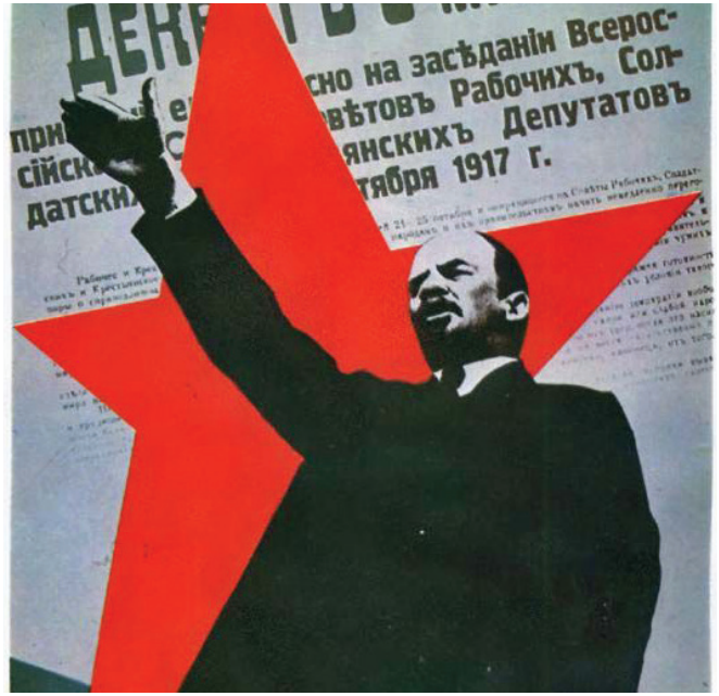
Բոլշևիկները հոշակեցին խաղաղության դեկրետ, որին հետևեց Հայաստանի հսկայական տարածքների գիշուկը հարևան պետությունների

Նկատենք՝ ես դեռ փորձում եմ խուսափել Նիկոլ Փաշինյանին ու նրա կառավարությանը պոպուլիզմի հերթական մեղադրանքն առաջադրելուց՝ անկեղծ փորձելով հասկանալ, թե ինչպես են նրանք պատկերացնում իրենց առջև դրված նպատակի իրականացումը: Որովհետև այն լուծումները, որոնք ԱՊՀ պետությունների ղեկավարների խորհրդի նիստին առաջարկել է Փաշինյանը, այն է՝ երկխոսությունը, թշնամանքի մթնոլորտի հաղթահարումը և Ադրբեջանին ՀՀ տարածքով դեպի Նախիջևան ճանապարհ տրամադրելը, իրատեսական չեն և ավելի շատ կենացներ են հիշեցնում: Համենայնդեպս, առաջին երկու կետերը միանշանակորեն այդպիսին են, իսկ երրորդը՝ թուրք-