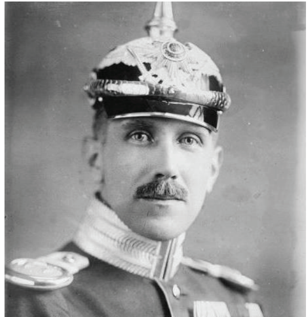
Նրանց Յոն Պասկեն

Ահմեդ Ջաֆարը (որին անվանում են նաև Ահմեդ Սաիդ Ջաֆար), դրիմցի թյուրք, համարվում է որպես մի մարդ, որի վրա բոլորովին չի կարելի հույս դնել, նաև լրտեսական աշխատանք է տանում կառավարության