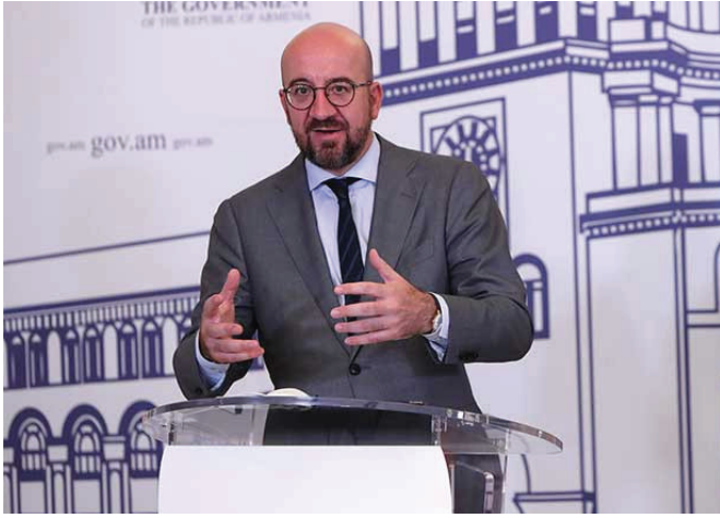
Շարլ Միշելը՝ Երևանում

Վերոնշյալի համատեքստում կարելի է փաստել, որ պատերազմի հետևանքով և հետպատերազմյան շրջանում ձեռք բերած առավելությունները Ռուսաստանը ձգտում է կապիտալիզացնելու ինչպես Հայաստանի և Ադրբեջանի հետ երկկողմ հարաբերությունների, այնպես էլ հենց «Նոյեմբերի 9»-ի ձևաչափի հարթությունում՝ երկու տիրույթում էլ փորձելով չեզոքացնել մրցակիցների հավակնությունները: Բայց և այնպես, Մոսկվան սկսել է բախվել մրցակիցների՝ սեփական դիրքերը վերականգնելու փորձերին: Մասնավորապես, հատկապես պաշտոնական Երևանի դիրքորոշման և գործադրվող ջանքերի շնորհիվ արցախյան հակամարտության վերջնական կարգավորման նպատակով աստիճանաբար վերակենդանանում է ԵԱՀԿ ՄԽ համանախագահության ձևաչափը՝ որպես այս հիմնախնդրի հանգուցալուծման հարցով միակ իրավազոր միջազգային կառույց: Բացի նշվածից՝ Ռուսաստանը զգալի բարդությունների է բախվում նաև Ադրբեջանում ու Հայաստանում: Առաջին