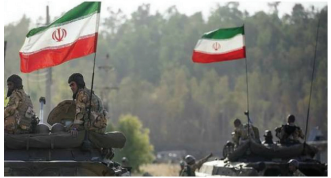
Իրանական զորքը Ադրբեջանի սահմանների մոտ

Կարելի է ենթադրել, որ եթե Իրան-Ադրբեջան լարված հարաբերությունների շուրջ իրավիճակը բարդանա այն աստիճան, որ հանգուցալուծման միակ ելքը լինի պատերազմը, և որոշ արտաքին խաղացողներ, հատկապես Իսրայելն ու Թուրքիան, Բաքվին և Թեհրանին դրդեն դրան, իրական