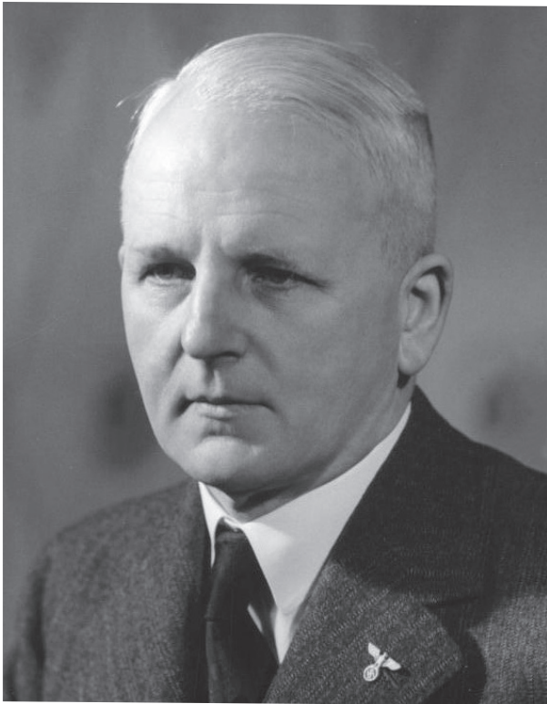
Բեռլին, 5 օգոստոսի 1941 թ. № 494