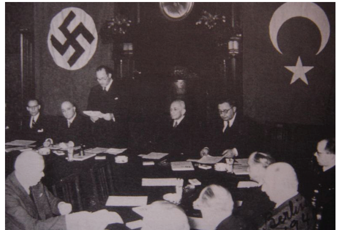
1941-ի հունիսի 18-ին ստորագրվեց գերմանա-թուրքական բարեկամության և ոչ ագրեսիայի դաշնագիրը

Զույգ փաստաթղթերի աստղանիշերով ծանոթագրությունները Փաստաթղթերի ժողովածուի անվանացանկից: