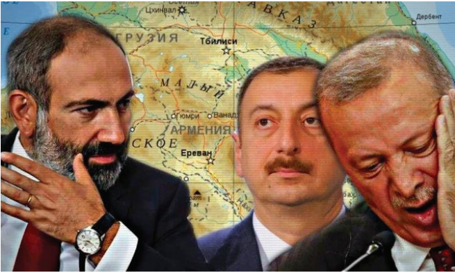
Դեպի «խաղաղություն և եղբայրություն»

ցեղասպանական զարգացումների լույսի ներքո սա անասելի մեծ առաքելություն էր, որը, փաստորեն, ողջ միջազգային հանրության կողմից դրվեց հենց հայոց պետության ուսերին: Դրա հետևանքով միջազգային հարաբերություններում Հայաստանը տեղափոխվում էր միանգամայն այլ մակարդակ, որտեղ կարելի էր քաղաքական ճիշտ հաշվարկված քայլերով անվտանգության բավական լուրջ խնդիրներ լուծել մեր ժողովրդի համար: Եվ այդ գործը հաջողությամբ ընթանում էր մինչև 2018 թ. հեղաշրջումը: 2018 թվականից սկսած՝ Հայաստանում և մեր հարևանությամբ ամեն ինչ սկսեց արագ փոխվել: Հայաստանի նոր իշխանությունները մի քանի ամսվա ընթացքում բառացիորեն ոչնչացրին նախորդ տասնամյակների ընթացքում ձևավորված անվտանգության բոլոր համակարգերը, այդ թվում՝ Հայկական հարցի՝ Թուրքիայի ակտիվությունը գսպող գրեթե ողջ պոտենցիալը: Փաշինյանի կառավարությունը դադարեց սպասարկել համահայկական և