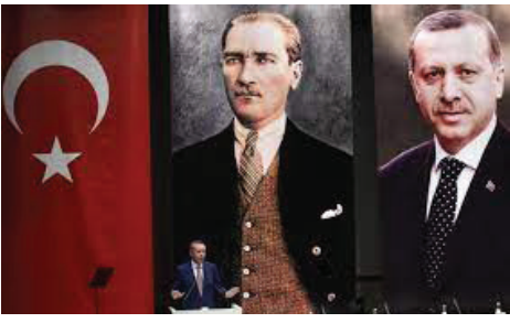
Քեմալ և Էրդոդան

Քեմալականները շարունակեցին նաև հայերի ուժացման և ունեզրկման քաղաքականությունը: Դրա վտո ապացույցն էին մանկահավաքության դեպքերը, երբ հայ որբերին հավաքում էին մի տեղ, տալիս կրթություն և դաստիարակում մոլի հայատյացության գա-