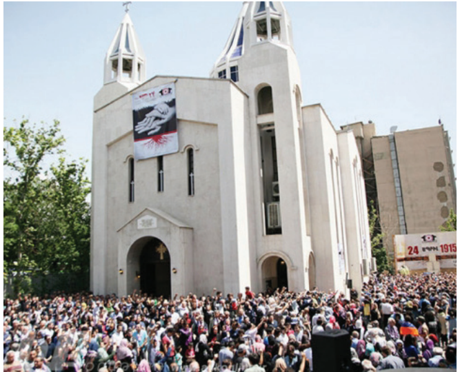
Ապրիլի 24-ի միջոցառում Թեհրանում

Նախ՝ Հայոց ցեղասպանության ճանաչման խոչընդոտներից մեկը Իրանի հյուսիսում կենտրոնացած ազերիախոս ատրպատականցիների մեծաթիվ համայնքն է, որը սերտ կապեր ունի Թուրքիայի և Ադրբեջանի հետ՝ կարևոր դեր խաղալով երկրի քաղաքական և տնտեսական կյանքում: Վերջիններն էլ, բնականաբար օգտագործելով իրենց ազդեցության լծակները, կարող են զգալի ճնշում գործադրել իրանական իշխանությունների վրա: Բացի այդ՝ Իրանի շատ բարձրաստիճան հոգևոր և քաղաքական առաջնորդներ այս էթնիկ խմբի ներկայացուցիչներ են, ինչը բնականաբար չի կարող չազդել երկրի