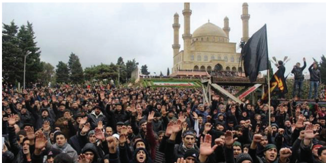
Բողոքի հանրահավաք Նարդարանում