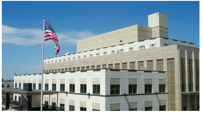
ԱՄՆ դեսպանատունը Հայաստանում

Արցախյան պատերազմի ընթացքում և դրանից հետո ԱՄՆ իշխանությունների կողմից բազմիցս հնչել են կոչեր՝ հակամարտությունը կարգավորելու Մինսկի գործընթացի շրջանակներում, քանի որ դա այն ինստիտուտն է, որը զբաղվում է արցախյան հակամարտությամբ՝ ԱՄՆ-ի, Ռուսաստանի և Ֆրանսիայի համանախագահության ներքո 22 : Արցախյան պատերազմի դադարեցումից և եռակողմ հայտարարության ստորագրումից հետո անգամ, երբ Ռուսաստանը ստանձնեց նախաձեռնողականությունը և նրա դերը (թե՛ որպես առանձին երկիր և թե՛ որպես Մինսկի խմբի համանախագահ երկիր) մեծացավ, ԱՄՆ-ն շարունակեց հավատարիմ մնալ Մինսկի եռակողմ համանախագահության ձևաչափին՝ շեշտելով, որ ԱՄՆ-ն, «ինչպես և Ֆրանսիացիները, նվիրված է Մինսկի խմբի համանախագահությանը և գործընթացին... [ԱՄՆ-ն] դիտարկում է այն ինստիտուտներն ու կառույցները, որոնք [ԱՄՆ-ն] կարող է օգտագործել ԵԱՀԿ գործընթացի շրջանակներում» 23 : Սա վկայում է այն մասին, որ ԱՄՆ-ն, լինելով Մինսկի խմբի երեք համանախագահ երկրներից մեկը, այս ինստիտուցիոնալ հարթակը շարունակում է դիտարկել որպես հակամարտության կարգավորման հիմնական կարևոր մեխանիզմ: Պատահական չէ նաև, որ Արցախում ռազմական գործողությունների դադարեցման կապակցությամբ