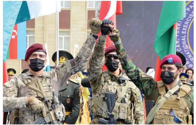
Ադրբեջան-Թուրքիա-Պակիստան ռազմական գործակցությունը Կովկասում

Հասկանալի է, որ նման իրավիճակում Թուրքիան պետք է ամեն ինչ աներ այդ կապանքներից ազատվելու համար: Թուրքական իշխանությունների՝ երկար տասնամյակների քաղաքականությունը ժխտողականությունն էր: Սակայն մեր Մփյուռքի, իսկ