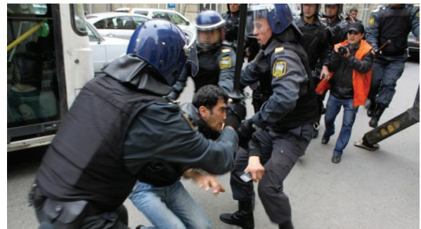
Բռնություններ ցուցարարների նկատմամբ

Դեպքերի առնչությամբ Ադրբեջանի ՆԳՆ-ն և գլխավոր դատախազությունը նոյեմբերի 27-ին համատեղ հայտարարություն հրապարակեցին՝ պնդելով, թե բնակավայրի շիա հավատացյալները երկրի Սահմանադրությունը փոխելու և շարիաթ հաստատելու նպատակով ստեղծել են «Մուսուլմանական միասնություն» կազմակերպությունը, կողմնակիցներ ձեռք բերել երկրի այլ շրջաններում և նրանց