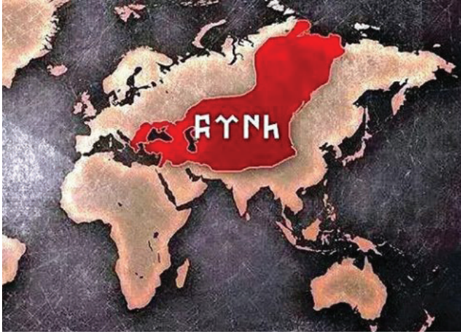
«Մեծ երազ» թուրան աշխարհը

տառացիօրէն գործադրող, ներքին գործոց նախարարը և ոճրագործը՝ Թալեաթ, յաջողած էր պարծենալ. «Ես Հայկական հարցը լուծելու համար երեք ամսուան մէջ ըրի աւելին, քան Համիտ՝ 30 տարուայ ընթացքին...» 4 : Ուստի, կը մնար շարունակել պայքարը և այդ, յանուն համաթուրանականութեան: