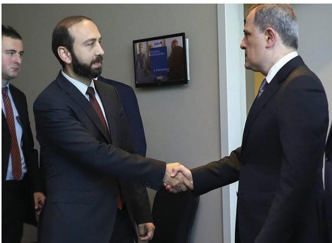
Բանակցություններ ադրբեջանական կողմի հետ

Որպես քաղաքական վերջնապատակ Հայաստանի իշխանությունները խոսում էին նաև, այսպես կոչված, խաղաղության դարաշրջանի բացման մասին: Սակայն այս հարցում էլ Նիկոլ Փաշինյանն ու իր թիմակիցները կարծես հիասթափվել են: Համենայնդեպս, ՀՀ գործող վարչապետն այլևս բաց հայտարարում է այն մասին, որ Ադրբեջանը նոր պատերազմ սկսելու հիմքեր է նախապատրաստում, և Հայաստանի ու Արցախի գլխին կրկին ամպեր են կուտակվում: Այս ամենը նշանակում է, որ պաշտոնական Երևանն ինքն էլ չի վստահում իր մարտավարությանն ու դրանից բխող բանակցային դիրքորոշմանը: Սակայն, չնայած դրան, բանակցություններն Ադրբեջանի հետ չեն դադարում: Իսկ սա իր հերթին նշանակում է, որ բանակցային սեղանին Բաքվի մշակած օրակարգն է՝ հայկական կողմի համար դրանից բխող բոլոր հետևանքներով հանդերձ... ■