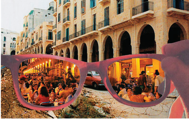
Ադրբեջանի մայրաքաղաքն այսօր

Սկսած 1969 թվականից՝ 33 տարի (ներառյալ 1987-1993 թթ. վեցամյա ընդմիջումը) Ալիևը եղել է Ադրբեջանի գլխավոր դեկավարը: Պոլիտբյուրոյի որոշ հուշագիրներ նշում են, որ 1988 թ. Սունգայիթում և Բաքվում տեղի ունեցած հայկական առաջին ջարդերը Կրեմլում իշխանության համար մղվող պայքարի արտացոլումն էին: Դրանք կառավարում էին Ալիևի հին կադրերը, որոնք հույս ունեին Գորբաչովի կողմից նշանակված Ա. Ռ. Վեզիրովի փոխարեն, ով «չափից ավելի ազնիվ էր հանրապետությունում կազմակերպված հանցավորության համար», Ադրբեջանում վերականգնել Ալիևի իշխանությունը 4 : Հեյդար Ալիևի քաղաքական ծրագրի հիմնական կարգախոսն էր անգործունակ քաղաքական գործիչների՝ իրավասու և գործունյա քաղաքական գործիչներով փոխարինումը 5 : Եվ իշխանության, և՛ ընդդիմության քաղաքական մանևրները կենտրոնացած էին Հեյդար Ալիևի ժառանգության շուրջ: Հ. Ալիևը դեռևս 1994 թ., երբ եկավ իշխանության, իր որդուն՝ Իլհամ Ալիևին, նշանակեց ադրբեջանական նավթային ընկերության «ՄՈԿԱՐ»-ի փոխնախագահ: Նախագահի պաշտոնում Իլհամին ժառանգորդ նշանակելու գործընթացի օրինականացման համար նախագահ Ալիևն առաջարկեց Սահմանադրության մեջ կատարել 39 փոփոխություն և 2000 թ. օգոստոսին դրանց հաստատման համար հանրաքվե անցկացրեց: Ամենակարևոր փոփոխությունն այն էր, որ նախագահի մահվան, հրաժարականի կամ անաշխատունակության դեպքում նրա պարտականություններն անցնում