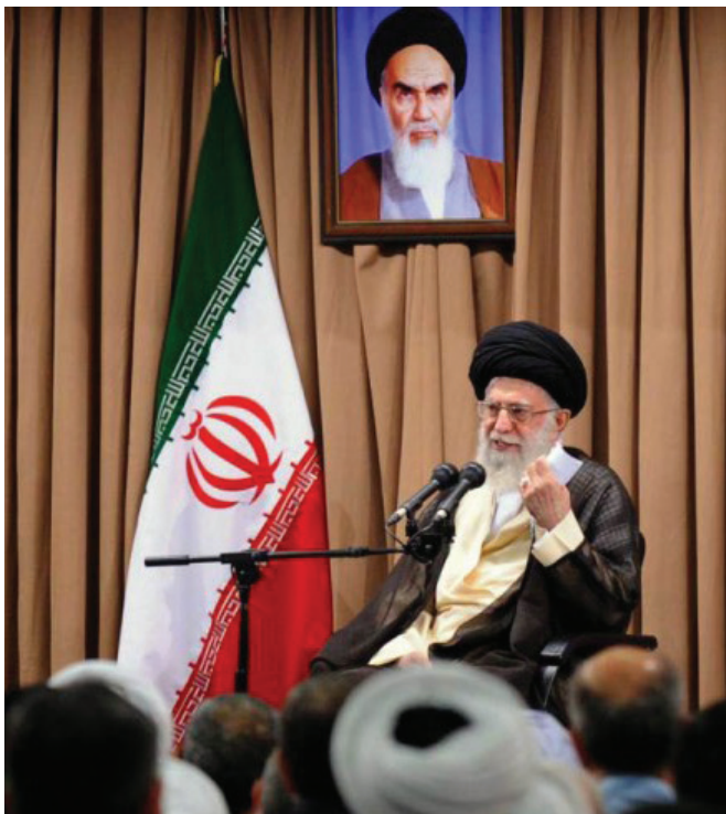
Իրանի հոգևոր առաջնորդ Ալի Խամենեին

առաջին անգամ թույլատրել էր նաև կանանց և աշխարհիկներին առաջադրել իրենց թեկնածուներին, սակայն նրանք որակագրկվեցին, քանի որ չէին համապատասխանում իսլամական անհրաժեշտ չափորոշիչներին 14 :