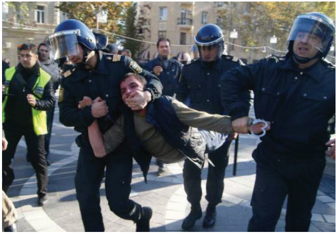
Ընդդիմության նկատմամբ ճնշումները Բաքվում

Այս հաղթանակը լուրջ խնդիր է ստեղծել Ադրբեջանում վերջին 20 տարվա ընթացքում իրականացվող քարոզչության համար: Իշխանությունները ժողովրդին վստահեցնում էին, որ հենց ազատագրվեն վիճելի տարածքները, դրանք անմիջապես կընակեցվեն: Բայց այդ գործընթացը շատ դանդաղ է ընթանում, հիմնականում խոսքը ռազմական ներկայության մասին է, ոչ թե տարածքների կարգավորման: Բացի այդ՝ ի հայտ է եկել անհաբեկական նոր գործոն: Հայտնի տվյալներով՝ կա մինչև 2000 սիրիացի անհաբեկիչ, որոնք սպասում են իրենց ընտանիքների ժամանմանը այս տարածք: Որպես արդյունք՝ Ադրբեջանի իշխանությունների քարոզչությունը կորցնում է իր հիմքը: