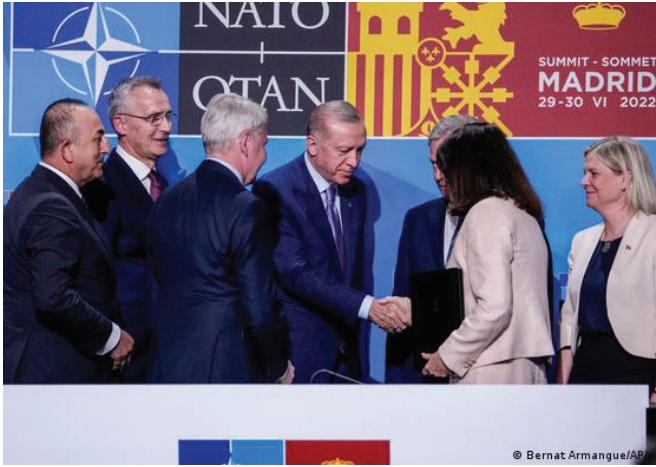
Թուրքիան համաձայնում է ՆԱՏՕ-ին Շվեդիայի ու Ֆինլանդիայի անդամակցության առաջարկի հետ

տեսակետի օգտին է խոսում ինչպես հայ-թուրքական հարաբերությունների կարգավորման գործընթացի տեմպի դանդաղեցման իրողությունը, այնպես էլ մինչև ճգնաժամը նաև Թուրքիայի կողմից ակտիվորեն առաջ մղվող «3+3» ձևաչափի նախաձեռնման ուղղությամբ ակտիվ քայլերի բացակայությունը: Թուրքական հարավկովկասյան օրակարգի այս միջանկյալ մարտավարությունը, ամենայն հավանականությամբ, հաշվարկվում է ուկրաինական հակամարտության խորացման պայմաններում նաև այս տարածաշրջանում Ռուսաստանի դիրքերի թուլացման հնարավորությամբ, որը, ինչպես ապացուցված է պատմականորեն, ավելի կոյուրիանցնի Հարավային Կովկասում Թուրքիայի դիրքերի ամրապնդումը և, որ ամենակարևորն է, առանց լուրջ զիջումների: Հետևաբար թուրքական ներկայիս մարտավարությունը հիմնված է Ադրբեյջանի դերակատարությանը համակողմանի աջակցության, ինչպես նաև ընդհանուր խնդիրների առաջնորդման տրամաբանության վրա: Ինչ վերաբերում է հայ-թուրքական հարաբերությունների կարգավորման գործընթացին, ապա ներկա փուլում Անկարայի հիմնական խնդիրը զուտ գործընթացի կենսունակության ապահովումն է՝ առանց շոշափելի արդյունքների արձանագրման: Որպես վերոնշյալ տեսակետի փաստարկում կարելի է դիտարկել Թուրքիայի կողմից Հարավային Կովկասում տրանսպորտային կապուղիների ապաշրջափակման գործընթացում ադրբեյջանա-թուրքական «Ջանգեզուրի միջանցքի» նախագծի առաջնորդումը առնվազն պաշտոնական հոեոտրաբանության և քարոզչական հարթություններում: