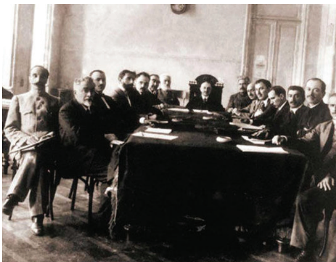
Ադրբեջանի կառավարությունը 1918 թ.

Հարկ է կրկին շեշտել, որ «Ադրբեջան» եզրը քաջատապես վերաբերել է Իրանի պատմական երկրամաս Ատրպատականին, որի բնակիչները հայտնի են ազերի անվամբ: Հենց այդ պատճառով էլ, ինչպես ասվեց, ժամանակին շահական Պարսկաստանի կառավարությունը բողոքել է նորանկախ Հարավարևելյան Անդրկովկասի՝ թյուրք-