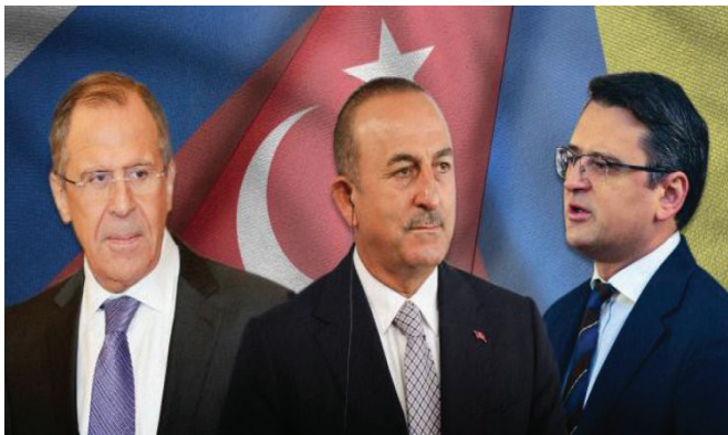
Ռուսաստանի և Ուկրաինայի արտգործնախարարների հանդիպումը Թուրքիայում՝ միջնորդ կողմի նախաձեռնությամբ

Թուրքիայի շահերի գոտի հանդիսացող մեկ այլ տարածաշրջանում՝ Հարավային Կովկասում, նկատվում է Անկարայի քաղաքականության ակնհայտ պասիվություն: Մասնավորապես, ուկրաինական ճգնաժամի ակտիվ փուլի մեկնարկից հետո Թուրքիայի արտաքին քաղաքական ուղեգծի առաջնահերթություններում հետին պլան են մղվել այս տարածաշրջանի խնդիրները: Վերոնշյալ