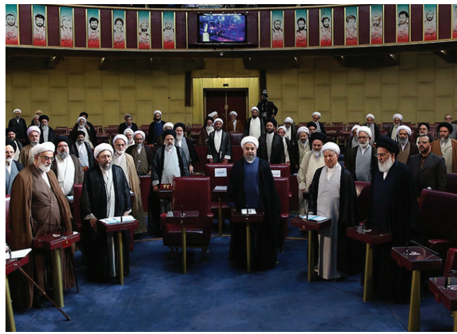
Իրանի փորձագետների խորհուրդը՝ Հաշեմի Ռաֆսանջանի նախագահությանը

2006 թ. Փորձագետների խորհրդի ընտրություններն ընթացան բավականին լարված մթնոլորտում: Իրենց թեկնածուներին էին առաջադրել ծայրահեղ պահպանողականները՝ նախագահ Մահմուդ Ահմադինեթադի հոգևոր հայր Մոհամմադ Թաքի Մեթահ-Յազդին և բարեփոխական, նախկին նախագահ Հաշեմի Ռաֆսանջանին: 2007 թ. Հ. Ռաֆսանջանին ընտրվում է Փորձագետների խորհրդի նախագահ՝ առավելության հասնելով հիմնական մրցակից՝ ծայրահեղ կղերական և Մահմանադրության պահպանների խորհրդի քարտուղար Ահմադ Ջաննաթիի նկատմամբ: Խորհրդի 76 անդամներից 41-ը քվեարկել էին նրա օգտին 13 : Նշենք, որ հենց այս ընտրություններին էր, որ Մահմանադրության պահպանների խորհուրդն