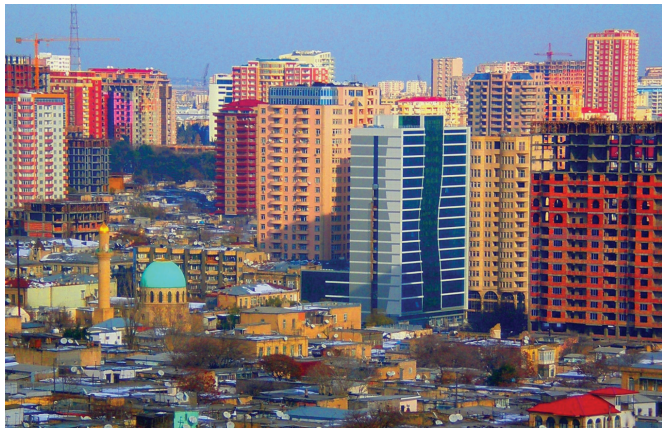
Հսկասությունների քաղաք Բաքուն

Ալիևի դոկտրինի ռազմավարական և աշխարհաքաղաքական բաղադրիչը պետք է դիտարկել 20-րդ դարի 50-ական թթ. վերջի և 70-ական թթ. սկզբի այն գործընթացների ծիրում, երբ արաբա-խորհրդային հակամարտության ենթատեքստում և ավելի լայն՝ գաղութատիրական համակարգի դեմ «երրորդ աշխարհի» ու «չմիացած երկրների» պայքարի ընթացքում նավթային հարստությունը և նավթի տարանցիկ ուղիները սկսեցին դիտարկվել որպես աշխարհաքաղաքական գործող գործիք 7 : Ալիևի դոկտրինը հակադրության մեջ է մեր տարածաշրջանի 6 երկրներից անմիջականորեն 3-ին (Հայաստան, Իրան, ՌԴ)՝ պատանդ վերցնելով տարածաշրջանի 4-րդ երկիրը՝ տրանզիտային Վրաստանը: Իրականում Անդրկովկասի ներկայիս պատակտման հիմքում ընկած են հենց Ալիևի դոկտրինը և գաղութատիրական աշխարհաքաղաքական իրողությունները, այլ ոչ թե հայ ժողովրդի ինքնորոշման իրավունքը և ազատագրական պայքարը: Այն անշեղորեն և գրեթե անփոփոխ կյանքի կոչվեց 1990-ական թթ. կեսից սկսած մինչև 2007-2008 թթ.՝ մի կողմից ապահովելով Ադրբեջանի համախառն ներքին արտադրանքի տպավորիչ աճը, մյուս կողմից՝ տարածաշրջանում Հայաստանը համառորեն շրջանցող էներգատրանսպորտային ենթակառուցվածքների զարգացումը, լինեն դրանք նավթատարներ և գազատարներ, մայրուղի, երկաթուղի (Բաքու-Թբիլիսի-Կարս) թե էլեկտրաէներգիայի բարձրավոլտ հաղորդագծեր (Բորչկա-Ախալցխա 400 կվ լարման գիծ):