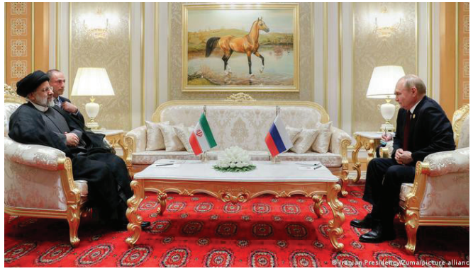
Նախագահներ Ռեհիսի և Պուրխիսի առանձնագրույցը Թեհրանում

Վերոնշյալի համատեքստում բավականաչափ «խոսուն» է հայտարարության տեքստում գետնդրված հետևյալ ձևակերպումը. «Տարածաշրջանային հարցերի առնչությամբ ղեկավարներն ընդգծել են Ռուսաստանի և Թուրքիայի միջև անկեղծ և վստահելի հարաբերությունների կարևորությունը՝ հասնելու տարածաշրջանային և միջազգային կայունության» 14 : Գուցե նաև հենց այս մտքի միջոցով են ակնարկվում երկու կողմերի հետաքրքրությունների շրջանակում գտնվող այնպիսի հարցեր, որոնց մասին ուղղակի արձանագրում չկա տեքստում: Դրանց թվում են, բնականաբար, Հարավային Կովկասին առնչվող հարցերը, արցախյան հիմնախնդիրը, որի շրջանակում վերջին ռազմական լարվածությունը Բերձորի հատվածում ադրբեջանական կողմից հրահրվել էր Մոչիի հանդիպումից ընդամենն օրեր առաջ: Ուստի այս խնդրի և ընդհանրապես հարավկովկասյան զարգացումների շուրջ հատուկ շեշտադրումների բացակայությունն առնվազն ստվերային քննարկումների վերաբերյալ ենթադրությունների հիմքեր է ստեղծում, մասնավորապես այն դեպքում, երբ դեռ բանակցություններից առաջ հանդիպման օրակարգում հայ-ադրբեջանական թեմատիկայի ընդգրկման մասին նշվել էր երկու կողմից էլ, ընդ