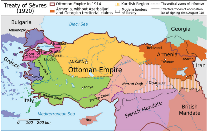
Հայաստանը ըստ Սևրի պայմանագրի

Ստեղծված իրավիճակում թուրքական նոր իշխանությունները սկսեցին արագացնել թուրքական ռազմական տրիբունալներում երիտթուրք պարագլուխների դատավարության ընթացքը՝ մտավախություն ունենալով, որ հետագայում կարող էր ստեղծվել ինչպես պատերազմական հանցագործություններ, այնպես էլ մարդկության դեմ հանցագործություններ կատարած նախկին բարձրաստիճան պաշտոնյաներին քրեական պատասխանատվության ենթարկող միջազգային տրիբունալ, ինչի մասին պատերազմի ավարտից հետո շատ էր խոսվում: Միջազգային տրիբունալում ակնհայտ կդառնար