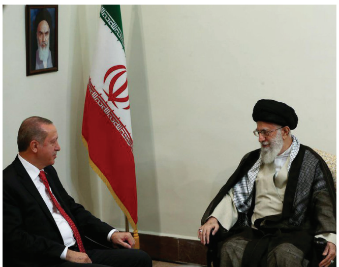
Ալի Խամենեիի և Ռ. Էրղոզանի ստանձնագրույցը Թեհրանում: 19.07.2022 թ.

Ա. Խամենեիի հայտարարությունը առ այն, որ Իրանը չի հանդուրժի հայ-իրանական սահմանի փակումը կամ դրա շահագործման համար արգելքների ստեղծումը: Հատկանշական է, որ Թուրքիայի նախագահի հետ հանդիպման ժամանակ առաջ տանելով վերոնշյալ թեզը՝ Ա. Խամենեին հավելել էր, որ հայ-իրանական սահմանը հազարամյակների պատմություն ունի, ուստի իրանական կողմը կարևորում է դրա անվտանգությունն ու անարգել շահագործումը: Ա. Խամենեին, ըստ էության, իրանական լեզվամտածողությանը համապատասխան, Թուրքիային և Ադրբեյջանին հասկացրեց, որ հայ-իրանական սահմանն ավելի հին է, քան նրանց մտացածին պատմությունը, և այն կեղծ օրակարգը, որը նրանք փորձում են առաջ տանել տարածաշրջանում, դատապարտված է կործանման: ■