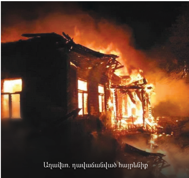
Աղավառ. դավաճանված հայրենիք

«Դրոշակ» ամսաթերթ Հայ Յեղափոխական Դաշնակցության պաշտոնաթերթ Հիմնադիր՝ «ՀՅԴ պատմության թանգարան հիմնադրամ» Երևան, Միեր Սկրոպյան փ. 12/1 Հեռ. (+374) 10-52-18-90 Էլ. հասցե՝ droshak@arf.am Կայք՝ https://www.droshak.am Գլխավոր խմբագիր՝ Արտաշես Շահբազյան Խմբագրական խորհուրդ