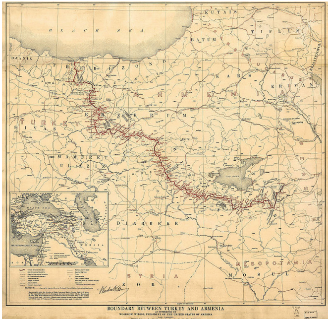
Հայաստանի սահմանը ըստ Սևրի պայմանագրի

Ուշագրավ է, որ պայմանագրի 142-րդ հոդվածով 1914