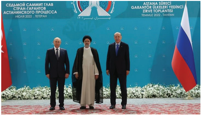
Իրանի, Թուրքիայի և Ռուսաստանի նախագահների 7-րդ եռակողմ զագաթնաժողովում: Թեհրան 9. 07.2022

Իրանի ու Ռուսաստանի նախագահների երկկողմ հանդիպման ընթացքում ընդգծվել է տարածաշրջանային և արտատարածաշրջանային նոր ոլորտներում համագործակցության զարգացման անհրաժեշտությունը, շեշտվել տարածաշրջանում անկախ երկրների անվտանգության ամրապնդման հարցում իրենց լուրջ կամքը: Անդրադառնալով Միրիայում ահաբեկչության դեմ պայքարում երկու երկրների հաջող համագործակցության փորձին՝ Իրանի նախագահը այն համարել է տարածաշրջանում անվտանգության և կայունության ամրապնդման