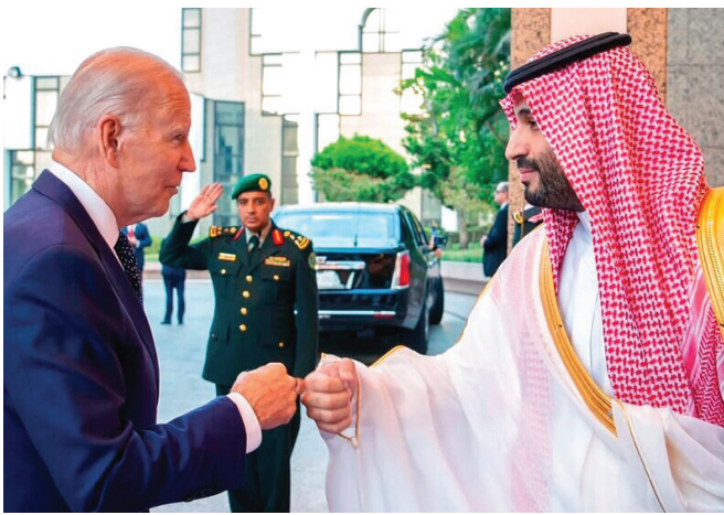
Ջո Բայդենի հանդիպումը Սաուդյան Արաբիայի արքայազն Մուհամմադ բեն Սալմանի հետ

Բայդենն իր այցը տարածաշրջան սկսել է Իսրայելից: Նա միշտ պարծենում է, որ թեև հրեա չէ, բայց սիոնիստ է: Նա չափազանց հեռուն գնաց Իսրայելին ռազմական, քաղաքական և տնտեսական օգնության տրամադրման հարցում և հանգստացրեց ենթադրյալ մտավախությունները Իրանի և Իրանի միջուկային փաթեթի առնչությամբ՝ ստորագրելով Միացյալ Նահանգների և Իսրայելի միջև ռազմավարական համագործակցության վերաբերյալ Երուսաղեմի հռչակագիրը՝ բոլոր հնարավոր