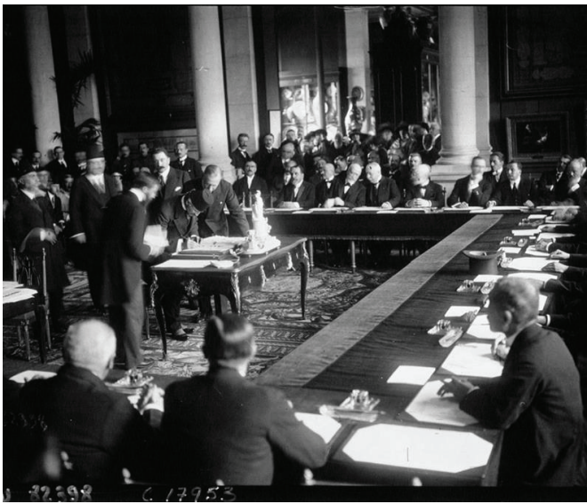
Ստորագրվում է Սևրի պայմանագիրը

Փաստաթղթի 93-րդ հոդվածով էլ Հայաստանը պարտավորվում էր պաշտպանել հիմնական ազգաբնակչությունից ռասայով, լեզվով և կրոնով տարբերվող բնակիչների շահերը, ինչը նախատեսվում էր անրագրել նաև Հայաստանի և գլխավոր տերությունների միջև կնքվելիք պայմանագրերում 7 : Այդ հոդվածով Հայաստանի վրա պարտավորություն էր դրվում առաջին հերթին ապահովելու Էրզրումի, Վանի, Բիթլիսի նահանգների և Տրապիզոնի նահանգի՝ իրեն միացվելիք տարածքներում բնակվող մահմեդական բնակչության՝ թուրքերի, քրդերի, ինչպես նաև թուրքական իշխանությունների կողմից Բալկաններից ու Հյուսիսային Կովկասից այդ տարածքներում վերաբնակեցված մուսուլման ժողովուրդների անվտանգությունը: Քաջատեղյակ լինելով, որ պատերազմի տարիներին այդ տարածքներում բնակվող մահմեդականներն ակտիվ մասնակցություն են ունեցել հայերի զանգվածային բնաջնջման գործում, դաշնակից տերությունները սույն հոդվածով Հայաստանի իշխանությունների վրա պարտավորություն էին դնում կանխելու և բացառելու նրանց նկատմամբ վերապրողների և զոհերի ժառանգների կողմից վրեժխնդրության հնարավոր