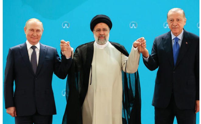
Երեք նախագահների հանդիպումը Թեհրանում. 19. 07. 2022 թ.

Սկսենք թերևս ամենապարզ ճշմարտությունների արձանագրումից: Այսպես՝ Հարավային Կովկասը վերափոխվող աշխարհակարգի կարևորագույն օղակներից մեկն է, որտեղ կենսական շահեր են հետապնդում թե՛ Ռուսաստանը, թե՛ Արևմուտքը և թե՛ տարածաշրջանային տերությունները: Իրանի համար այն ելք է դեպի Սև ծով և Եվրոպա: Ընդ որում, Թեհրանի համար չափազանց կարևոր է, որ այդ ելքը չվերահսկվի իր աշխարհաքաղաքական դարավոր մրցակցի՝ թուրքական աշխարհի կողմից: Այդ վտանգը չեզոքացնելու համար Իրանի իշխանություններն օգտվում են ինչպես դիվանագիտական, այնպես էլ անհրաժեշտության դեպքում ռազմական գործիքակազմից: Սակայն նախապատվությունը տրվում է հենց դիվանագիտական միջոցներին: Դա է պատճառը, որ Թեհրանը շարունակ հղում է տարածաշրջանային պետությունների՝ միջազգային ճանաչում ունեցող սահմանների պահպանման