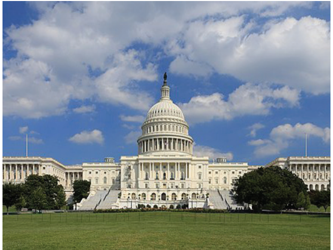
ԱՄՆ կոնգրեսի շենքը

Ինչ վերաբերում է Սենատում ընտրության դրված 14 դեմոկրատական տեղերին, ապա դրանցից վտանգված են հատկապես 4-ը: Այդ նահանգներն են Արիզոնան, Ջորջիան, Նևադան և Նյու Հեմփշիրը: Թեև այժմ այդ նահանգները ներկայացնում են դեմոկրատ սենատորներ, այնուամենայնիվ, այս միջանկյալ ընտրությունների ժամանակ հնարավոր է, որ դրանցում դեմոկրատները կորցնեն իրենց տեղերը: Դա պայմանավորված է տարբեր հանգամանքներով՝ հանրապետականների կողմից անվանի թեկնածուների առաջադրմամբ, դեմոկրատների օրոք տընտեսական վիճակի վատթարացմամբ, ժողովրդագրական պատկերի փոփոխությամբ 9 :