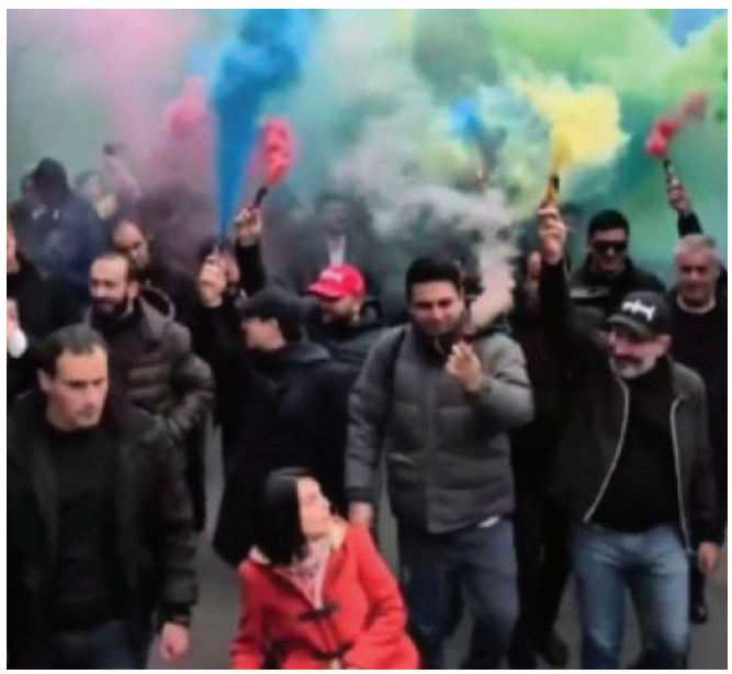
Գունավոր հեղափոխությունը Հայաստանում

Այս իրավիճակում, երբ Հայաստանի իշխանությունները և երջանիկ քաղաքացիական հասարակությունը հրաժարվում են Արցախից և պարտադրում հանձնվել ազերիներին, ո՞ւմ հետ կարող են հույսեր կապել արցախցիները: «Դիմադրության» շարժման 60 հազար մասնակիցներին, որոնց վիճակն այնքան էլ չի տարբերվում իրենց իսկ վիճակից: Արցախցիք կանգնած են լինել-չլինելու խնդրի առջև: Այսօր նրանց կյանքի միակ երաշխավորը ռուս խաղաղապահներն են, և իրենց հայրենիքում գոյատևելու հույսերը նրանք կապում են Ռուսաստանի հետ: Եվ եթե շուտով Արցախը դիմի Ռուսաստանի Դաշնությանը՝ նրա կազմի մեջ մտնելու համար, թող ոչ ոք չփորձի նախատել նրան: Ո՛վ ունի այդ իրավունքը: Ճիշտ է, միայն Ադրբեջանի տարածքային ամբողջականությունը հարգող «առաջադեմ մարդկությունը» և ՀՀ իշխանությունները: Իսկ Արցախը կղիմի և կսպասի, ինչպես սպասեցին Դրիմը և Դոնբասը: Կարծում եք՝ այսպիսի զարգացումներ հնարավոր չեն: Գլոբալ աշխարհակարգի հեղեղապտույտում ամեն ինչ հնարավոր է: ■