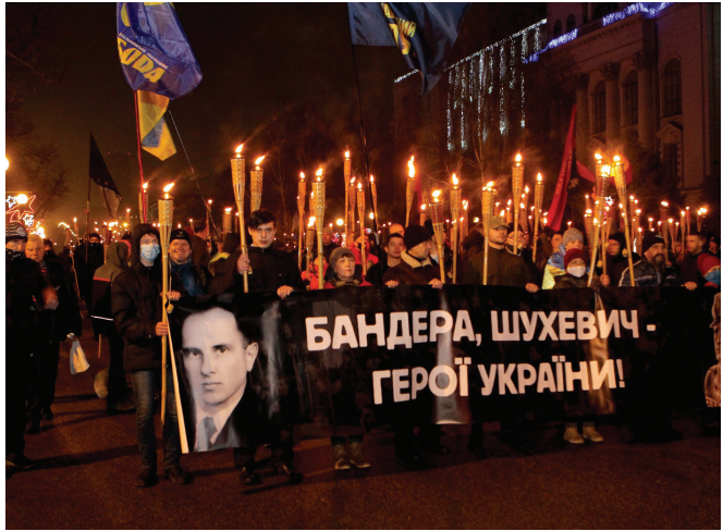
Բանդերականների երթը ժամանակակից Ուկրաինայում

1945 թվականից սկսած՝ ուկրաինական ազգայնականության ու ֆաշիզմի նկատմամբ շեֆությունն իրենց վրա են վերցրել անգլո-սաքսոնական երկրները՝ ոչ միայն ԱՄՆ-ն ու Անգլիան, այլև Կանադան, որտեղ 20-րդ դարում կազմավորվել է բավական ազդեցիկ և ռուսատյաց ուկրաինական գաղութ, որը կայուն ազդեցություն է ձեռք բերել այդ երկրի քաղաքական ու հասարակական կյանքում: Անգլոսաքսերի ուկրաինական քաղաքականության միտումն է կտրել Ուկրաինան Ռուսաստանից, կատարել դեռուսիֆիկացիա, վերածել այն մի խոշոր (30-40-միլիոնանոց) հակառուսաստանի և ամեն ինչ անել՝ միմյանց դեմ դուրս բերելու ռուսական աշխարհի երկու խոշոր հատվածները ու դրանով արյունաքամ անելու Ռուսաստանը: Բավական է ծանոթանալ Բժեզինսկու մտքերին, որպեսզի հասկանալի դառնան Ռուսաստանի և Ուկրաինայի հարցում Արևմուտքի ծրագրերը (տե՛ս http://ilinalexey.ru/2019/07/07/bzhezinskij-ob-ukraine/ ):