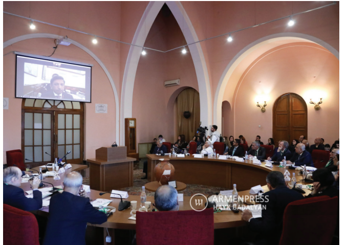
Հայ-հնդկական գիրաժողովը ՀՀ ազգային ակադեմիայում. 28-29 նոյեմբերի 2022 թ.

Խորհրդային Միության փլուզումից հետո Հարավային Կովկասը Հնդկաստանի արտաքին քաղաքականության գերակայություն երբևէ չի եղել: Այս ուղղությամբ Նյու Դելին գուցե տեսլական ունեցել է, սակայն գործնականում այն չի դրսևորվել՝ պայմանավորված Հնդկաստանի ոչ բավարար ներուժով: Հնդկաստանը Հարավային Կովկասի հանրապետություններից յուրաքանչյուրի հետ ունեցել է ուրույն հարաբերություններ: Հնդկական «փափուկ ուժին» տարածաշրջանը վաղուց էր ծանոթ, որը ձևավորվել էր դեռևս խորհրդային տարիներին: Հայաստանում, Վրաստանում և Ադրբեջանում հնդկական ֆիլմերը, երգերը, համեմունքները, դեկորատիվ արվեստի տարրերն ու հագուստի պարագաները որոշակի ժողովրդականություն միշտ էլ ունեցել են: Հետխորհրդային շրջանում և ներկայումս էլ տնտեսական առումով Հնդկաստանի հարաբերություններն առավել ընդլայն-