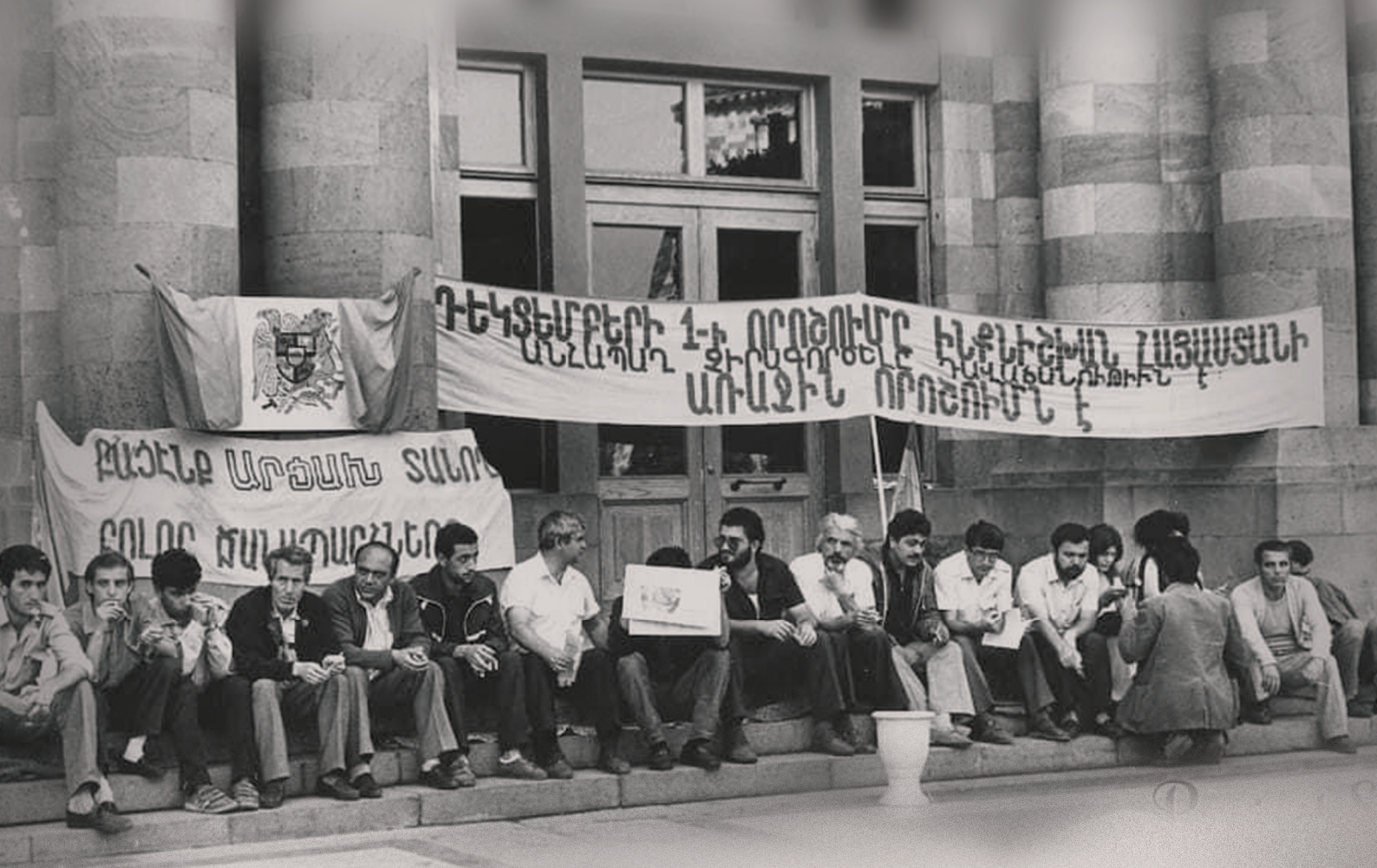
Արցախի շրջափակումը վերացնելու պահանջով նստացույց կառավարության շենքի դիմաց. 1990 թ. ամառ