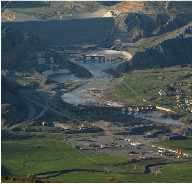
Խոտաֆերինի կամուրջը, հեռվում ջրամբարը

շրջաններում Իսրայելի կողմից «վելացի գյուղերի» կառուցումը Իրանում ընկալում են որպես Իսլամական Հանրապետությանը լրտեսելու և նրա դեմ գործողությունների հարթակի ստեղծում: Ադրբեջանա-իսրայելական համագործակցության ցանկացած դրսևորում ընկալվում է Իրանի դեմ ուղղված քայլ, այդ թվում՝ երկկողմ փոխայցերն ու տարբեր ոլորտներում համագործակցության խորացումը: Թե-Ավիվում դեսպանատուն բացելու Ադրբեջանի որոշումն էլ հակաիրանական գործողությունների նոր շրջափուլի մեկնարկ որակվեց: