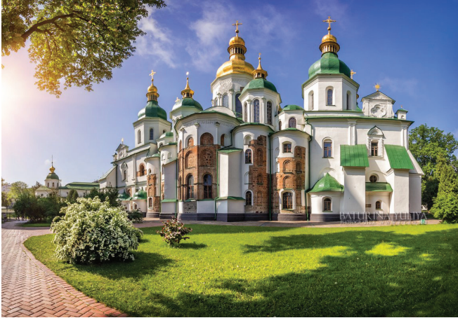
Կիևի սրբ Սոֆիայի տաճարը

կրթական, գիտատեխնիկական մեծ վերելքի համար պարտական է մասամբ ցարական Ռուսաստանին, բայց առավելապես ԽՍՀՄ-ին: