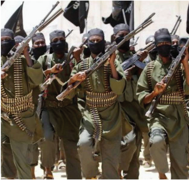
Իսլամական պետության զինյալները Սիրիայում

քարի» գաղափարէն: Ցայսօր դիտատրեալ «շփոթ» ու նոյնացում առկա է այդ երկու գաղափարներուն միջև՝ առ ի ծառայութիւն մեծապետական շահերուն: