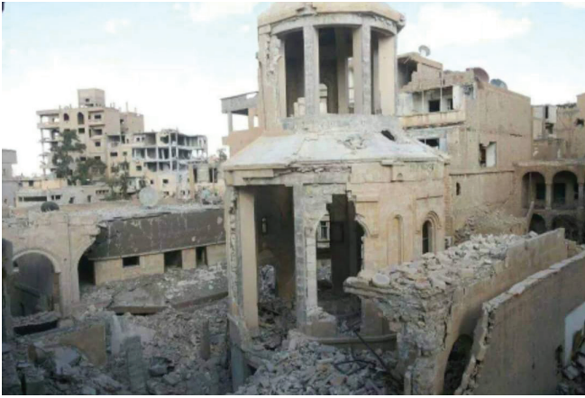
Իեր Զորի հայոց գեղասպանության հուշակոթողը՝ ավերված թուրքերի կողմից

գրկուած են ելեկտրական հոսանքէ, մինչ մենք Սուրիոյ մէջ տասը տարիներէ ի վեր կ'սպրիինք մթութեան մէջ օրական հազիւ երկու ժամ լուսատրութեամբ: