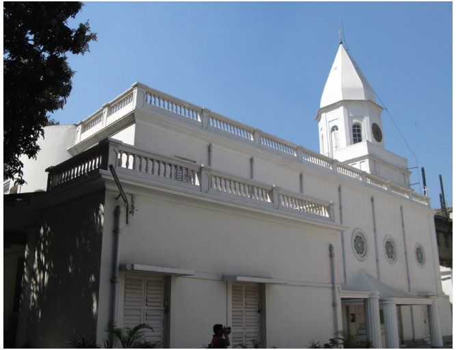
Հայկական սրբ Նազարեթ եկեղեցին Կալկաթայում՝ առաջին քրիստոնեական փամբար

Հայաստանում կան բազմաթիվ մարդիկ, որոնք հետաքրքրված են հնդկական փոփոխությամբ և յոգայով: Հնդկաստանում էլ շատերը հետաքրքրված են հայկական մշակույթով՝ եկեղեցիներով, հոգևոր երաժշտությամբ, արվեստով ու խոհանոցով: Հայ և հնդիկ բարեկամ ժողովուրդների կապերի սերտացման համար մեծ նշանակություն կարող է ունենալ հոգևոր կամ մշակութային զբոսաշրջությունը: Հայ զբոսաշրջիկները կարող են Հնդկաստանում ծանոթանալ ոչ միայն տեղական, այլև հայկական մշակութային արժեքներին, որոնք գտնվում են Հնդկաստանի տարբեր քաղաքներում՝ պետական հոգաձույթի ներքո: Ներկայումս աշխատանքներ են տարվում հայ-հնդկական մշակութային փոխանակումների, հնդկական մշակույթի հոյակապ նմուշները, մասնավորապես՝ Աջանտայի քարանձավների որմնանկարների կրկնօրինակները Հայաստանում ներկայաց-