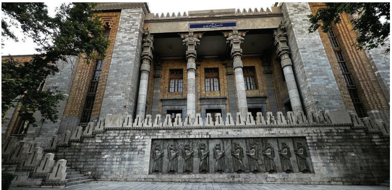
Իրանի Իսլամական Հանրապետության արդգործնախարարության շենքը

Իրանական կողմի համար հատկապես մտահոգիչ է Ադրբեջան-Իսրայել, Ադրբեջան-Թուրքիա հարաբերությունների խորացումը: Արցախի օկուպացված