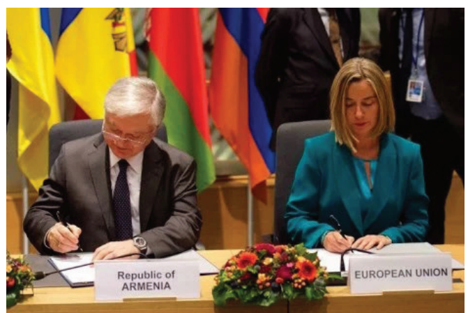
Էդուարդ Նալբանդյանը և Ֆեդերիկա Մոգերինին ստորագրում են Համապարփակ և ընդլայնված գործընկերության համաձայնագիրը

Ըստ համաձայնագրի՝ բոլոր կողմերի վավերացումից հետո ՀՀ-ԵՄ հարաբերությունները կարգավորվե-