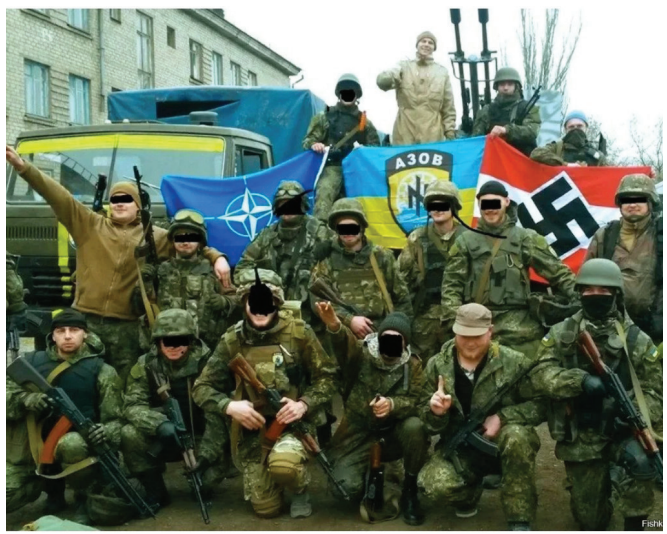
«Ազով» ռուսական կազմավորման զինյալները

Ուշագրավ է, որ Լվովում ուկրաինական ազգային շարժման հիմնադիրները նույնպես լեհ ազնվականության ներկայացուցիչներն էին, որոնցից է, օրինակ, 1863 թ. լեհական ապստամբությունից հետո Մալոռուսիայից Գալիցիա գաղթած Պաուլին Սվենցիցկին, որը դեռ Ռուսաստանում աչքի էր ընկել գյուղացիության լուսավորման անվան տակ Շևչենկոյի ստեղծագործությունները ժողովրդականացնելով: Լեհ կալվածատերերի միջավայրից դուրս եկած հասարակական գործիչների, գրողների ու հրապարակախոսների երազանքն էր երբևէ ոտքի հանել մալոռուսական բնակչությանն ընդդեմ Ռուսական կայսրության և վերստեղծել Ռեչ Պոսպոլիտան: Այդպիսի գործիչները ստացան ավստրիական իշխանությունների աջակցությունը, որոնք մտավախությամբ էին վերաբերվում Ռուսաստանի հարևանությամբ իրենց իշխանության տակ գտնվող Գալիցիայում ռուս բնակչության գոյությանը և 19-րդ դարի երկրորդ կեսից պլաններ էին մշակում քաղաքական ու գաղափարախոսական ճնշմամբ սերմանելու ռուս հպատակների մեջ ոչ ռուսական գիտակցություն: Այդ նպատակով 1868