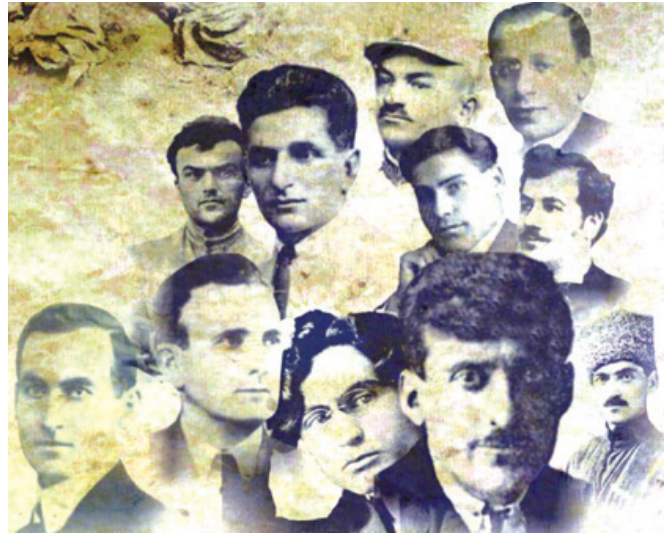
«Նեմեսիս»-ի կազմակերպիչներն ու իրականացնողները

«2. Որպէսզի «սուրբ գործը» արագ հասնի իր վախճանին, քանի որ ստուգուած էր, թէ մահապարտները կը պատրաստուին թողելու Գերմանիան