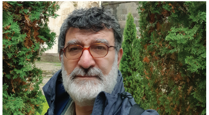
Իշխան Չիֆթճեան Հայագէտ

Զարգացում չեմ համարեր «արդէն գոն» փայլեցնելն ու հրամցնելը կամ, օրինակ, յանուն (լեզուի) զարգացման (անոր) աղաւաղման քաջալերանքը, ինչ որ կը տեսնեմ ներկայիս կիրարկուող. ատելի յստակ՝ մակերեսի «պահպանում» ու «փոխանցում», անմիջուկ՝ լոկ ձևագագացական, անբնորոշելի ինքնութեան մը տարրերու արտայայտութիւններ (գիր, երգ, պար, թատրոն և այլն): Սոյն հաստատումները կը մեկնին անձնական փորձառութենէս, ի միջի այլոց՝ մեր ՀԱՅԵՐԷՆ BLOG