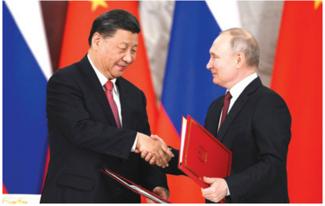
Սյորրագրված պայմանագրի փոխանակում, Մոսկվա, մարտի 22, 2023 թ.

Համաձայն հայտարարության՝ վերահաստատում են իրենց հավատարմությունը սույն պայմանագրով ստանձնած պարտավորություններին և կշարունակեն համակարգել ջանքերը պայմանագրի պահպանման և