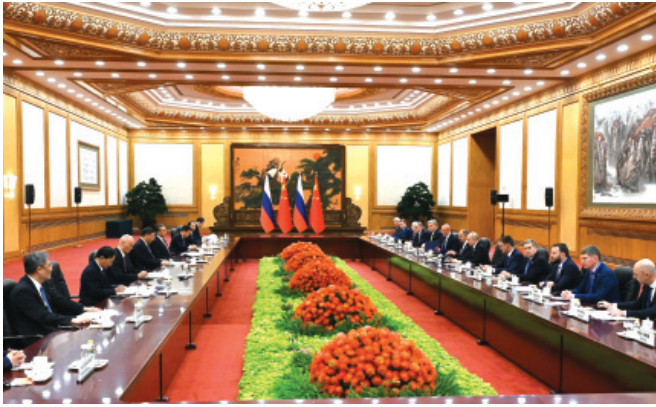
Բանակցություններ Մեկ գուրի, մեկ ճանապարհ ծրագրի շրջանակում, Պեկին, 17-ը հոկտեմբերի, 2023 թ.

Ռուսաստանը ողջունում է Չինաստանի պատրաստակամությունը՝ դրական դերակատարություն ունենալու ուկրաինական ճգնաժամի քաղաքական և դիվանագիտական կարգավորման գործում և չինական կողմի կազմած «Ուկրաինական ճգնաժամի քաղաքական կարգավորման վերաբերյալ Չինաստանի դիրքորոշման մասին» փաստաթղթում շարադրված կառուցողական նկատառումները: