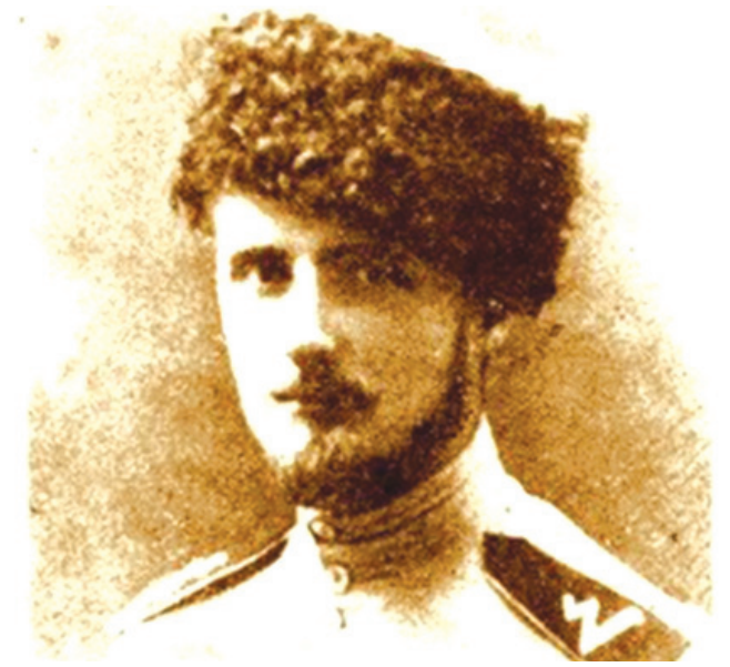
Օլիվեր Բոլդուին, անգլիացի գնդապետ. 1920 թ. կանավոր ծառայել է ՀՀ 1-ին Հանրապետության բանակում:

Այդ պայմաններում Առաջին հանրապետության հետախույզների գործունեությունն անավարտ մնաց,