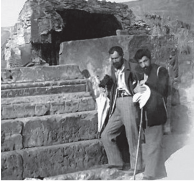
Հովհ. Թումանյանը և Ավ. Իսահակյանը Անիում, 1901 թ.

շրջանում այդպես չէր, ամեն բան հիմնովին թաղվել էր շփոթի և կեղծիքի մեջ: Իմաստուն խոսքն ասում է. «Ավելի լավ է հաղթես ինքդ քեզ, քան տանես հազարավոր հաղթանակներ թշնամիներիդ հանդեպ: Այդ դեպքում հաղթանակը միայն քունն է լինելու, այն չեն կարող քեզնից խլել»: Մեր ժողովուրդը չգործեց ինքն իրեն հաղթել, հատկապես՝ 94-ի զինադադարից հետո: Ահա, թե որտեղ էր մեր մեծագույն վրիպումներից մեկը: Ուրեմն մեծ հաշվով ինքսին լավ կամ վատ ազգեր չեն լինում, աշխարհի մյուս ժողովուրդներից ո՛չ լավն ենք, ո՛չ էլ վատը: Եթե կարծում ենք, թե սովորական ենք, ի՛նչ կա որ, մյուսները ևս սովորական են, եթե մեզ համարում են բացառիկ ժողովուրդ, իսկույն պիտի ընդունենք, որ մյուս ազգերը ևս բացառիկ են: Ազգերից յուրաքանչյուրն էլ ինքնատիպ է, ունիկալ, անկրկնելի, ինչպես աշխարհում և բնության մեջ ամեն ինչ: Ուղղակի մեր խեղճ Թումանյանը ևս հայկական պետություն չէր տեսել, շատ էլ լավ չէր պատկերացնում դրա խորքային նշանակությունը, ազգային հանրությանը առաջնորդելու պատմաքաղաքական առաքելության գերկարևոր փաստի հետ չէր առերեսվել: Այլապես այդքան խիստ չէր դատի անպետություն ժողովրդի մասին, այդքան շատ բան չէր պայմանավորի դրանցով: Նույն այդ «դառնացած ժողովուրդը» այնպիսի հերոսական ու սքանչելի որակներ է ցույց տվել նախկինում, ցուցադրում է այսօր և վստահաբար կդրսևորի ապագայում: Միայն թե լինի ուժեղ «առաջնորդություն...»: