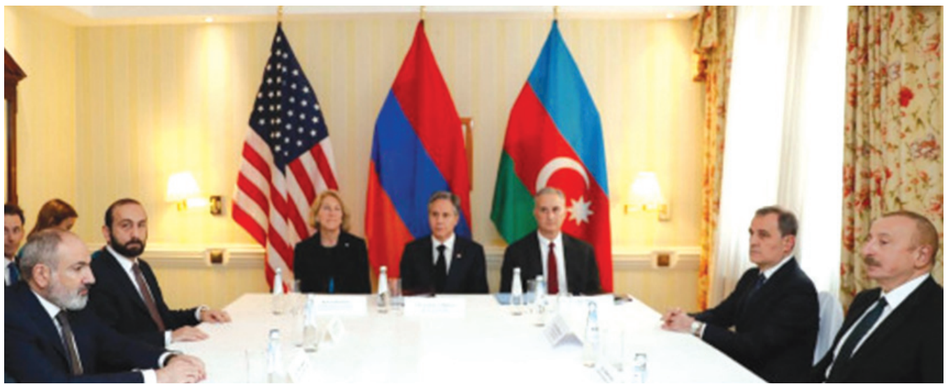
Փաշինյան-Ալին հանդիպումը ԱՄՆ պետքարտուղար Բլինքենի մասնակցությամբ, Մյունխեն, 18-ը փետրվարի