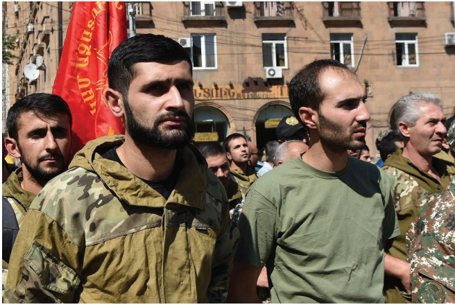
ՀՅԴ կամավորները քառասունչորսօրյա պարերազմին մեկնելիս՝ 27-ը սեպտեմբերի 2020 թ.

Ինչպիսին կլինեին ազգ-բանակ քաղաքականության արդյունքները, եթե չլիներ 2018 թ. «Թավշյա հեղափոխությունը», դժվար է ասել, որովհետև նոր իշխանությունը ազգ-բանակ հայեցակարգի նկատմամբ իր վերաբերմունքը արտահայտեց անվտանգության խորհրդի քարտուղար Արմեն Գրիգորյանի շուրթերով. «Ես միշտ շատ վատ եմ վերաբերվել «Ազգ-բանակ» կոնցեպտին... Եթե պաշտպանելու անհրաժեշտություն լինի, հասարակությունը պաշտպանվելու մեծ բնազդ ունի և պաշտպանվելու է, պետք չէ մարդկանց սովորեցնել հայրենիք սիրել...» 14 : Այլ կերպ ասած՝ հայ հասարակությունը իր հայրենիքը պետք է պաշտպանի ոչ թե գիտակցաբար, որպես այդ հայրենիքի հավերժական տեր ու ժառանգ, այլ բնազդաբար՝ զուտ սեփական կաշին փրկելու համար, իսկ ազգ-բանակը, ըստ անվտանգության խորհրդի քարտուղարի, կոռումպացվածության հետևանք էր, և նախկին իշխանությունները «այդ կոռումպացվածությունը թաքցնելու համար առաջարկել էին ազգ-բանակը» 15 , իսկ Արմեն Գրիգորյանի, Նիկոլ Փաշինյանի ու նրանց քաղաքական թիմի «եղակակենտրոն թավշյա բանակը» բերեց արհեստական պատերազմում հայկական բանակի կորիզի կոտորածի. հայոց մարտունակ բանակի մեջքը կոտրվեց հուսահատության ու հիասթափության ալիքի տակ, երբեմնի բանակապաշտ ու զինվորապաշտ հայ հասարակությունը անտարբեր դարձավ նաև բանակի ու զինվորի նկատմամբ. հետևանքը Արցախի ամբողջական հայաթափումն էր ու Հայաստանի Հանրապետության սուվերեն տարածքի մի զգալի հատվածի ռազմակալումը Ադրբեջանի կողմից: