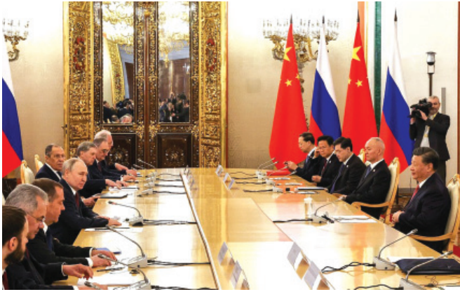
Բանակցություններ Մոսկվայում, մարտի 20-22, 2023 թ.

Ռուսաստանը բարձր է գնահատում Չինաստանի կողմից ԲԻԻԿՍ (БРИКС) XIV գագաթնաժողովի հաջող հյուրընկալումը: Կողմերը ասոցիացիայի մյուս անդամների հետ պատրաստ են իրականացնել BRICS-ի նախորդ գագաթնաժողովների ընթացքում ձեռք բերված պայմանավորվածությունները, խորացնել գործնական համագործակցությունը բոլոր ոլորտներում: