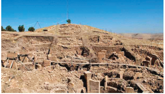
Պորյասար. Նեոլիթյան շրջանի հնավայր հայկական լեռնաշխարհում

կան տեսակետը՝ Ս. Հովհաննիսյանը հիշատակում է հայերի «բալկանյան ծագման» տեսությունը, իսկ պատմահայր Խորենացու տվյալները համարում է «առասպելական»: