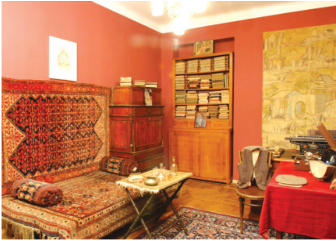
Չարենցի աշխատասենյակը իր բնակարանում

Տարոնցին խոսում է «իր ստեղծագործության մեջ թույլ տված մի շարք նացիոնալիստական սխալների մասին: Կանգ է առնում հակահեղափոխական նացիոնալիստ Ալազանի և Նորենցի հետ միասին «Գրական թերթում» վարած նացիոնալիստական քաղաքականության վրա»: