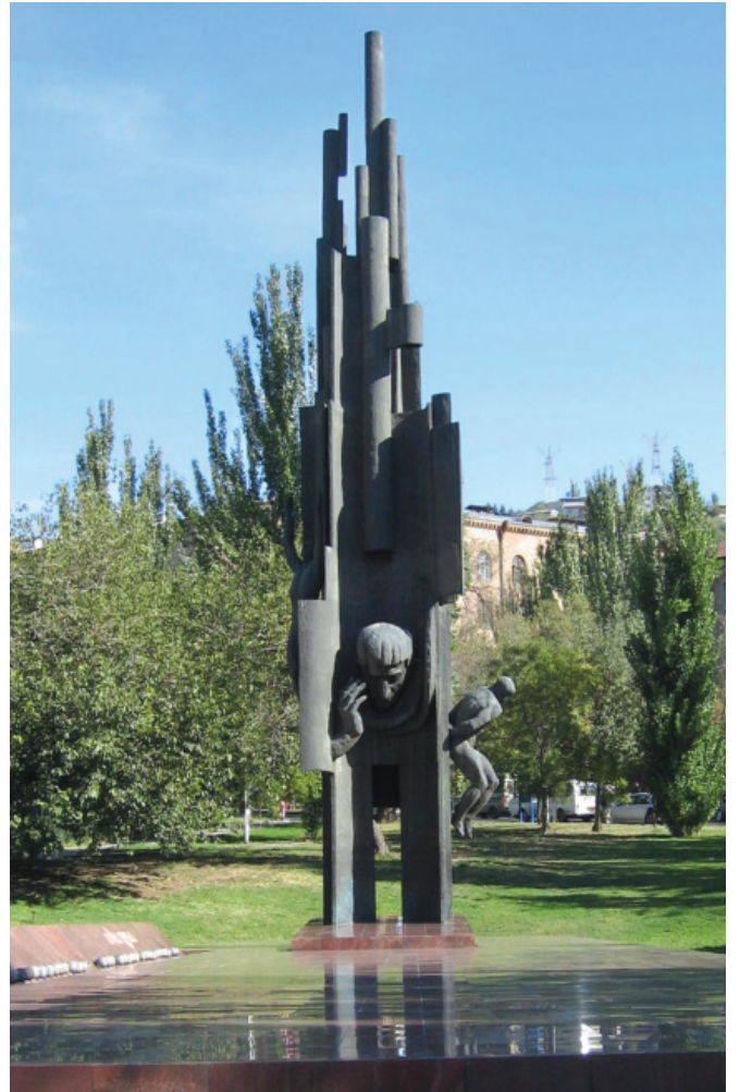
Չարենցի հուշարձանը Երևանում

Ահա այս պայմաններում Չարենցը և նրա համախոհները ստալինյան ղեկավարության կողմից հոշակվեցին որպես նացիոնալիստ ու քողարկված դաշնակցական, հորջորջվեցին ժողովրդի թշնամի և գնդակահարվեցին, արքորվեցին կամ մեռան բանտերում ու ճանապարհներին: ■