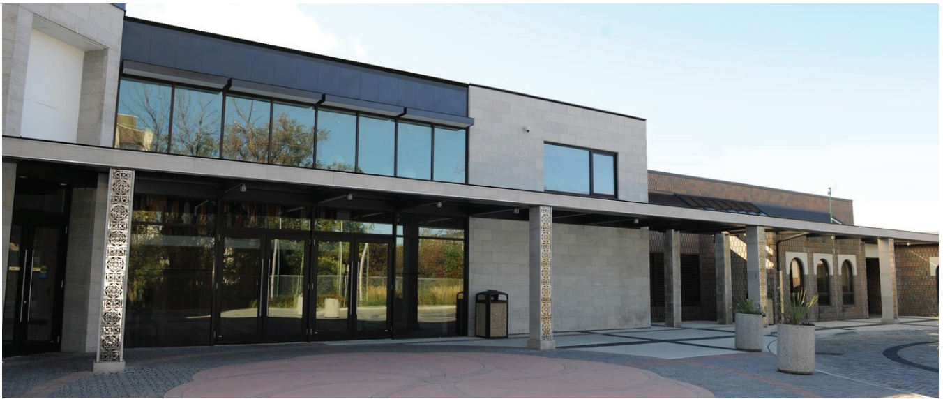
Տորոնտոյի «Հայ կեդրոնի» շենքը

2005-ի մայիսի 20-ին՝ «Պ. Մեակի ծննդեան 80-ամեակի նուիրում երեկոյ» և 2012-ի փետրվարի 26-ին՝ «Յուշահանդէս՝ Պ. Մեակի մահուան 40-ամեակին ձօնուած»: