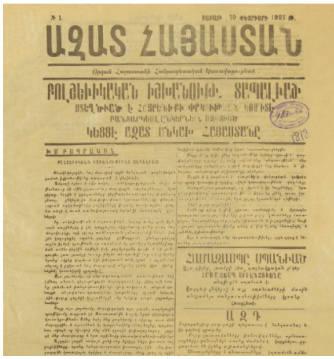
ՀՀ կառավարության կողմից 1921 թ. Փետրուարի 19-ից լրջաբանված «Ազատ Հայաստան» թերթի առաջին համարը

տատր բազուկներու եւ գուրկ բնակչութենէ: Հայ ժողովուրդը քաղաքական եւ տնտեսական պահանջներու բնական մղումով կը ձգտի միացեալ Հայաստանին: Անկախութեան եւ միացեալ Հայաստանի ըմբռնումները ձուլուած, միս ու արիւն դարձած են Հ. Յ. Դաշնակցութեան, ինչպէս եւ ժողովրդական գանգուածներուն համար: