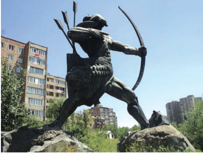
Հայկ Նահապետի արձանը

Արաբական ավանդությունը ևս հայերի ծագումը կապում է ջրհեղեղից հետո ազգերի՝ Նոյի որդիներից առաջացած լինելու պատկերացման հետ: Այն առավել հանգամանորեն շարադրված է 12-13-րդ դարերի արաբ մատենագիրներ Յակուտիի և Դիմաշկիի երկերում: Ըստ այդ ավանդության՝ Նոյի որդի Յաֆիսից (Հաբեթ) ծնվեց Ավմարը, ապա նրա թոռ Լանթան (Թորգոմ), որի որդին էր Արմինին (հայերի նախնին), և որի եղբոր որդիներից սերում են աղվաններն ու վրացիները: Այս ավանդությունը ազգակից է համարում հայերին, հույներին, սլավոններին, ֆրանկներին և իրանական ցեղերին. հետաքրքիր է, որ այն պահպանել է ազգակից հնդեվրոպական ժողովուրդների միասնության շրջանից եկող հիշողությունը: