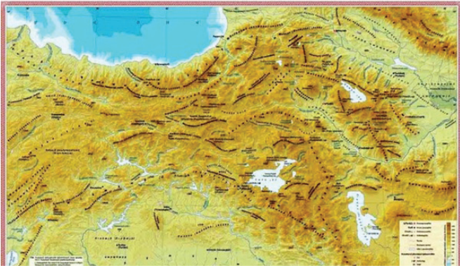
Հայկական լեռնաշխարհի քարտեզը