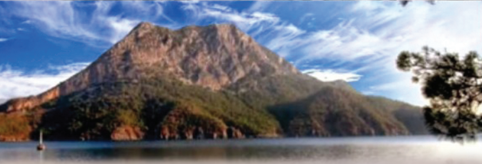
110 տարի առաջ, 1915 թ. օգոստոս-սեպտեմբեր ամիսներին տեղի ունեցավ Մուսա Լեռան հերոսամարտը