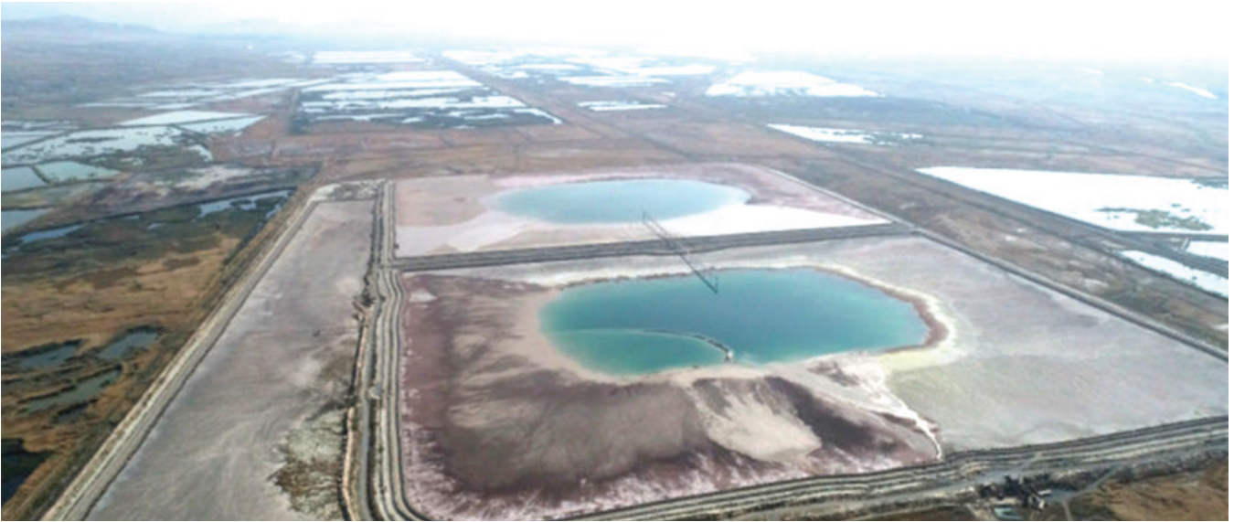
Արարարի ցիանային պղնձաբարձր

քաշի մեջ: Հողի բոլոր փորձանմուշներում մկնդեղի կոնցենտրացիաները գերազանցել են Հայաստանի հողի համար սահմանված չափաքանակները: